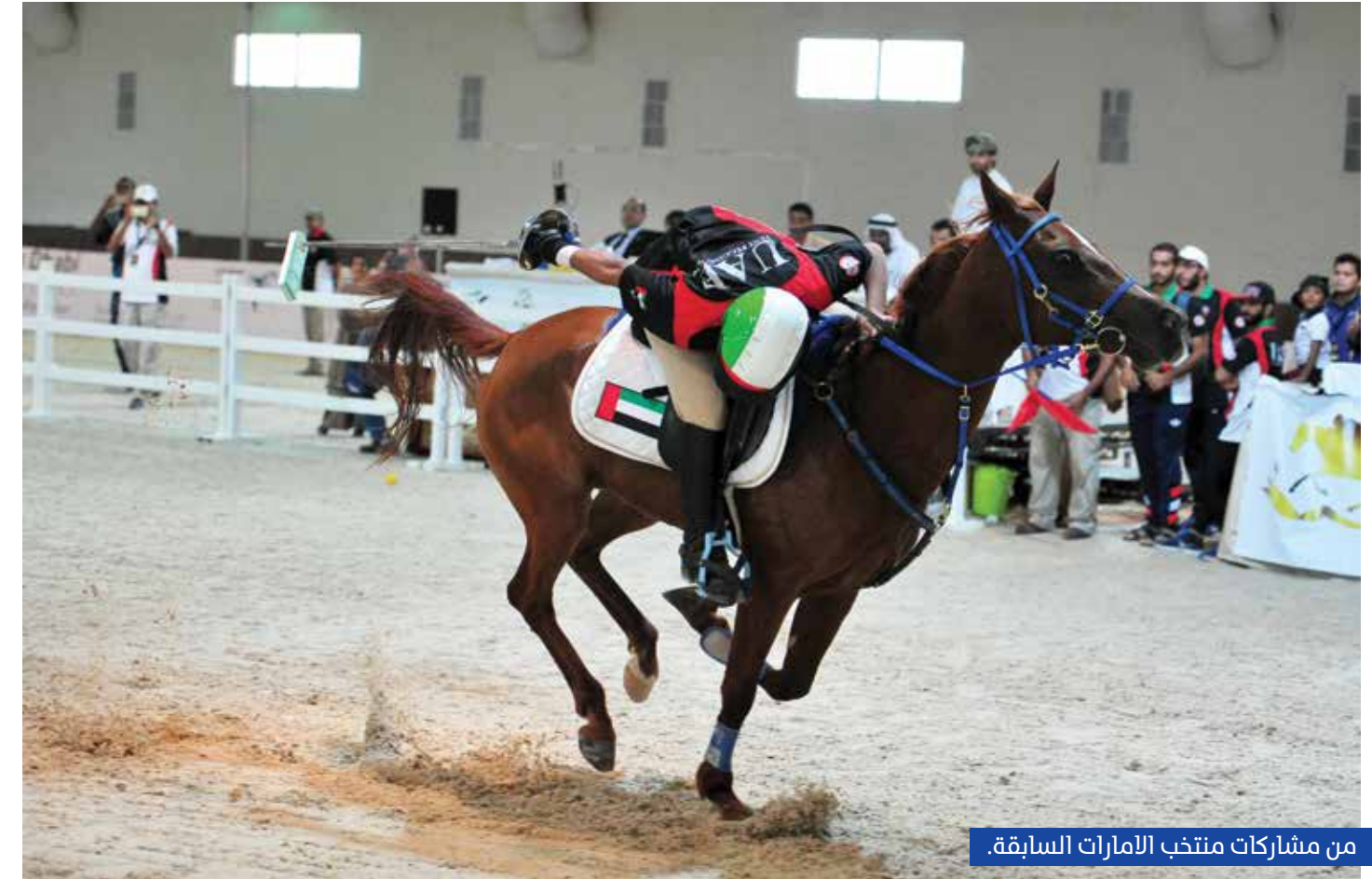
من مشاركات منتخب الإمارات السابقة.

تستضيف العاصمة أبوظبي نهاية شهر أكتوبر المقبل، نهائيات بطولة كأس العالم للتقاط الأوتاد الثالثة في نادي أبوظبي للفروسية، بالتزامن مع عام زايد والاحتفاء بمرور 100 عام على مولده، وتحت رعاية كريمة من سمو الشيخ منصور بن زايد آل نهيان نائب رئيس مجلس الوزراء وزير شؤون الرئاسة، وستتنافس في مونديال التقاط الأوتاد التي تتم في نسختها الثالثة منذ إشهار الاتحاد الدولي في أكتوبر من عام 2013، اثني عشر دولة وهي الإمارات العربية المتحدة، عمان، الأردن، جنوب أفريقيا، اليمن، النرويج، باكستان، الهند، السودان، والمملكة العربية السعودية. وستنضم إلى الدول العشرة المتأهلة سلفاً، دولتين ستحدد من خلال البطولة المؤهلة التي ستجرى في الأسبوع الأول من شهر أكتوبر والتي ستقام في جمهورية مصر العربية. دخل منتخب الإمارات في معسكر تدريبي داخلي مكثف في ميادين إسطنبول بوزيد التابعة لنادي تراث الإمارات منذ عدة أيام، وسينتقل بعدها