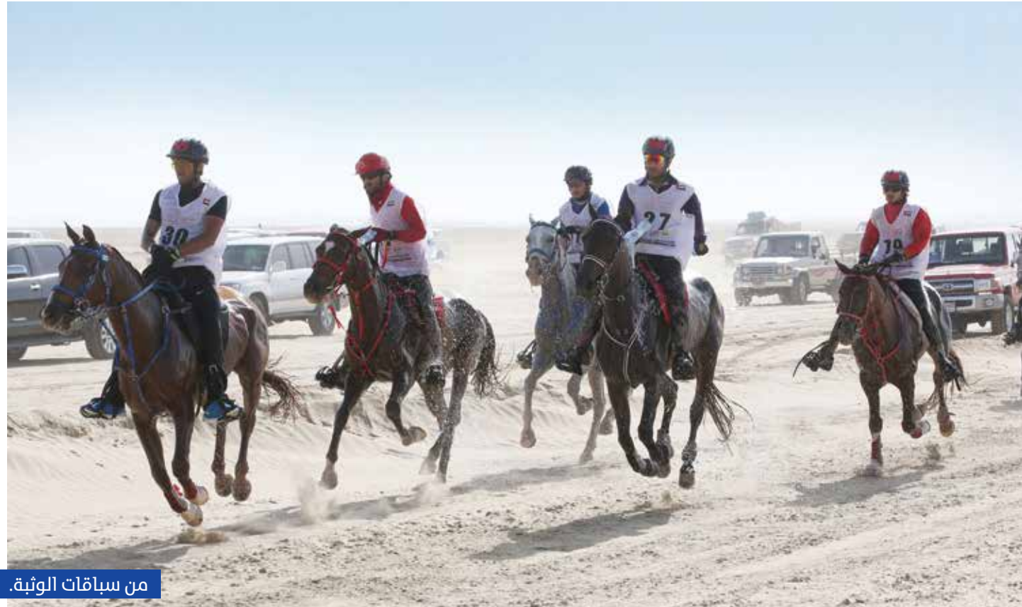
من سباقات الوثبة.

ولي عهد دبي للقدرة لمسافة 120 كم، الذي سيقام يوم 16 مارس. ويقام كأس اليوم الوطني لمسافة 120 كم، يوم 1 ديسمبر المقبل، بقرية الإمارات الدولية للقدرة بالوثبة، بينما ينطلق سباق «يوم الشهيد» للإسطبلات الخاصة، والاشترار الفردي يوم 29 نوفمبر لمسافة 100 كم، بمدينة دبي الدولية للقدرة بسبخ السلم. ويقام كأس سمو الشيخة فاطمة بنت مبارك للقدرة للسيدات، يوم 24 نوفمبر، لمسافة 120 كم دولي «نجمتين» بقرية الإمارات الدولية للقدرة بالوثبة، بينما ينطلق يوم 26 يناير، سباق كأس الشيخ زايد بن منصور بن زايد آل نهيان للشباب والناشئين، لمسافة 120 كم بقرية الإمارات الدولية للقدرة بالوثبة، فيما ينطلق سباق كأس الشيخة فاطمة بنت منصور بن زايد آل نهيان للقدرة، المخصص للسيدات لمسافة 100 كم، يوم 22 فبراير يليه في اليوم الثاني كأس الشيخ محمد بن منصور بن زايد آل نهيان للقدرة للإسطبلات الخاصة، لمسافة 100