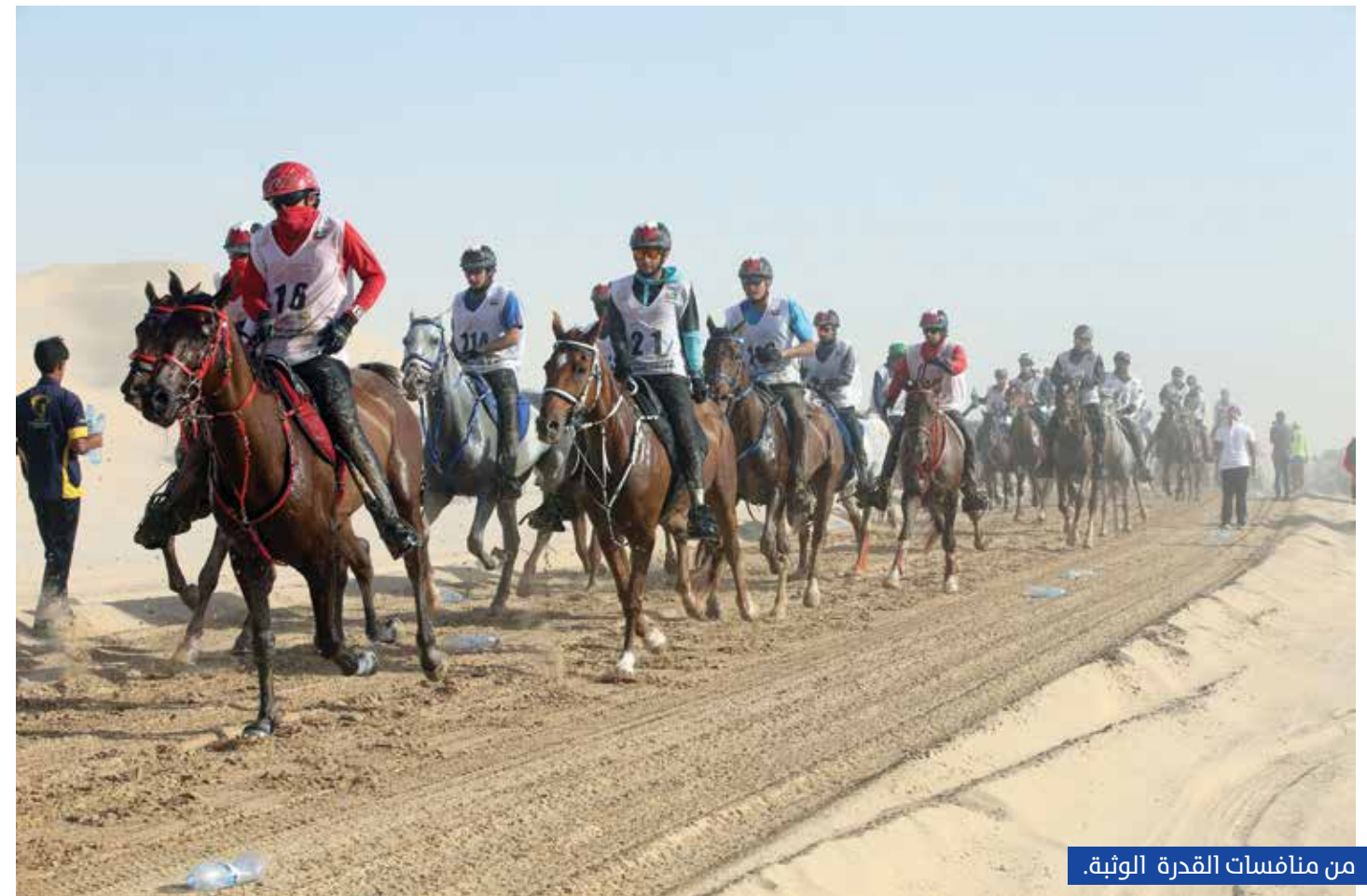
من منافسات القدرة الوثبة.

تستضيف ميادين القدرة الإماراتية 76 سباقاً خلال الموسم الجديد للفروسية 2018 - 2019 الذي ينطلق في أكتوبر ويستمر حتى أبريل المقبل، وأعلن اتحاد الإمارات للفروسية تفاصيل السباقات ضمن رزمة الموسم، والتي تشمل المنافسات الرسمية الرئيسة، والسباقات التأهيلية التي ستحتضنها كل من مدينة دبي الدولية للقدرة في سبخ السلم، وقرية الإمارات الدولية للقدرة في الوثبة، وقرية بوذيب العالمية للقدرة في أبوظبي. وأبرز ما تضمنه برنامج الموسم الجديد، كأس صاحب السمو رئيس الدولة، حفظة الله، التي ستقام يوم 9 فبراير لمسافة 160 كم دولي «3 نجوم»، في قرية الإمارات الدولية للقدرة بالوثبة، ومهرجان صاحب السمو الشيخ محمد بن راشد آل مكتوم نائب رئيس الدولة رئيس مجلس الوزراء حاكم دبي، رعاه الله، الذي سينطلق يوم 27 ديسمبر في مدينة دبي الدولية للقدرة بسبخ السلم.