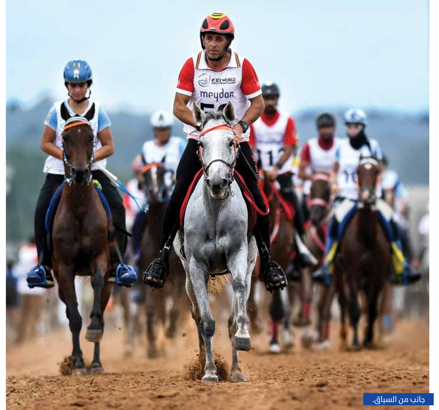
جانب من السباق.

حفل سباق القدرة الذي أقيم ضمن ألعاب الفروسية العالمية تريون 2018، بمركز تريون بولاية نورث كارولينا الأمريكية، بمجموعة من الاحداث الدراماتيكية والتي انتهت بالغاء السباق جاء ضمن ألعاب الفروسية العالمية التي ينظمها الاتحاد الدولي للفروسية وتضم 8 مناشط هي قفز الحواجز، سباق القدرة، الديرساج، البارا ديرساج، ايفينج، رينينج، درايفنج، ويشترك الرياضيون من كلا الجنسين في هذه المنافسات، وتعتبر ثلاثة من هذه الالعاب من الالعاب الاولمبية وهي القفز والديرساج وايفينج، كما ان البارا ديرساج يعد من الالعاب البار اولمبية. لعبت اللجنة المنظمة دورا اساسيا في جميع الاحداث التي صاحبت السباق والتي ادت لانسحاب سمو الشيخ حمدان بن محمد بن راشد آل مكتوم ولي عهد دبي، والذي كان بمثابة تقدير وقراءة سليمة لما ستول اليه الاحداث، فبعد الانطلاقة الخاطئة وبعد انتهاء المرحلة الاولى من سباق البطولة لمسافة 160 كلم، قررت اللجنة الغاء السباق بدلا من تعديل ومعالجة اخطأ الانطلاقة، ثم جاء اعلان اللجنة عن قيام سباق لمسافة 121 كم، وكان هذا القرار بمثابة اخر مسمار في نعش السباق، والذي على اثره قرر سمو الشيخ حمدان بن محمد آل