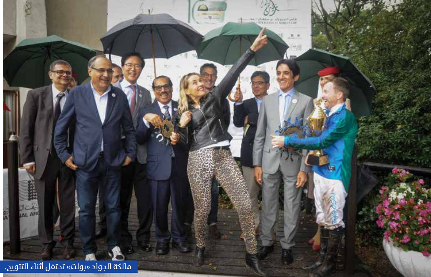
مالكة الجواد «بولت» تحتفل أثناء التتويج.

توج الجواد «لايتنج بولت» ملكة لاندجود ووترلاند وبإشراف كارين فان دين بوس وبقيادة تاج اوشيه، بطلاً للجولة التاسعة لكأس المغفور له بإذن الله الشيخ زايد بن سلطان آل نهيان للفئة الثانية، فيما فازت الفارسة الإيطالية ايلاريا ساجيومو بالجولة السادسة من مونديال «أم الإمارات» للسيدات «افهار»، وظفر الفارس جوس ويسندرو بدولية الشيخة لطيفة بنت منصور بن زايد آل نهيان لخيول البولني، والتي أقيمت بمضمار دوندخت في هولندا، بالتزامن مع النسخة العاشرة لمهرجان سمو الشيخ منصور بن زايد آل نهيان العالمي للخيول العربية، والاحتفاء بـ«عام زايد» ومرور 100 عام على مولده تحت شعار عالم واحد 6 قارات أبوظبي العاصمة. ويقام المهرجان بتوجيهات سمو الشيخ منصور بن زايد آل نهيان نائب رئيس