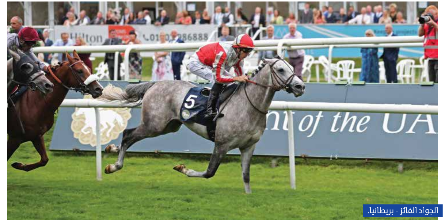
الحواد الفائز - بريطانيا.

حققت المحطة الأوروبية السابعة نجاحاً كبيراً وسط حضور جماهيري غفير بمدرجات مضمار دونكاستر في مهرجان سانت ليجر، وينتقل السباق في محطته المقبلة