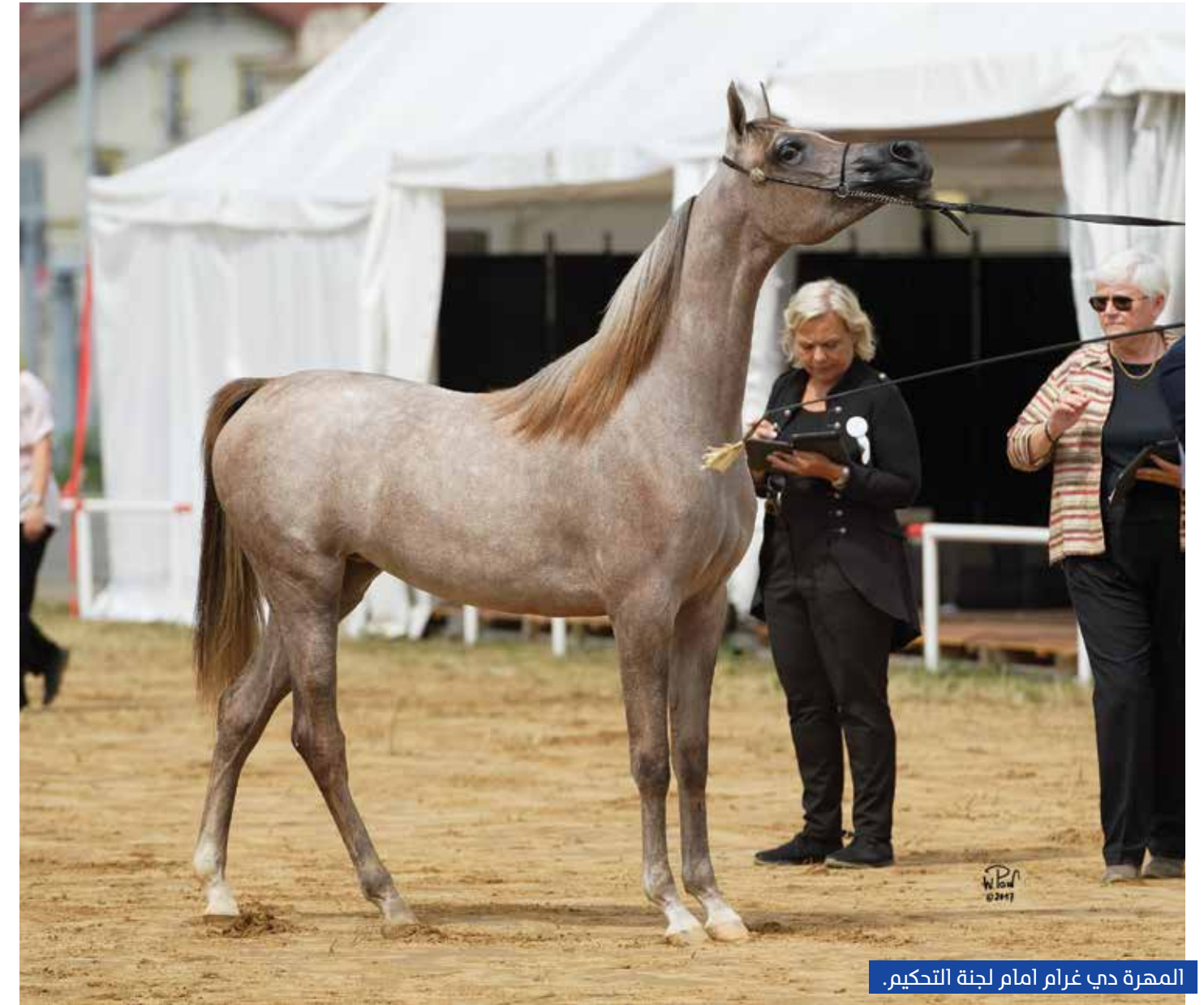
المهرة دي غرام امام لجنة التحكيم.

في كل من مسابقة الأمهر بعمر السنة ومسابقة الأفل، بوساطة كل من المهر دي زيدان ابن الأسطورة الفحل اف ايه ال رشيم والفرس رينزا البلان، والفحل «دي خطاف» ابن الفحل العالمي المتميز رويال كارلز والفرس دي جوان. ومرة أخرى يؤكد الإنتاج المحلي لمربط دبي سطوته الجمالية العالمية في كل البطولات على اختلاف مستوياتها، ويرسخ الفحل الأسطورة إف إيه إل رشيم قوته النوعية في إنتاج الأبطال في نجاح فريد ونادر بين الأفل المنتجة في العالم، مع تميز واضح في غزارة الإنتاج وجدارة الإنجاز.