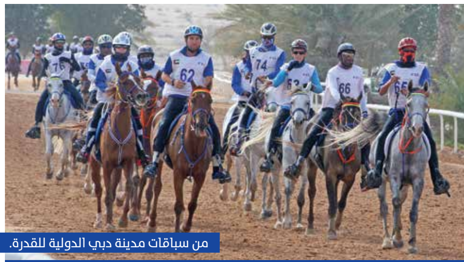
من سباقات مدينة دبي الدولية للقدرة.

يوم 10 نوفمبر، وكأس «ياس» للإسطبلات الخاصة لمسافة 100 كم يوم 8 ديسمبر، وكأس «الوثبة» للقدرة للإسطبلات الخاصة لمسافة 100 كم يوم 15 ديسمبر، وكأس «الريف للقدرة» لمسافة 120 كم يوم 12 يناير، وبطولة الإمارات للقدرة لمسافة 120 كم يوم 2 فبراير. تنطلق منافسات كأس صاحب السمو رئيس الدولة، حفظة الله، يوم 10 يناير، بسباق السيدات لمسافة 100 كم في قرية بوذيب العالمية للقدرة، وسباق آخر للإسطبلات الخاصة لمسافة 100 كم، يليه في اليوم الثاني، سباق كأس صاحب السمو رئيس الدولة، حفظة الله، للشباب والناشئين لمسافة 120 كم «نجمتين».