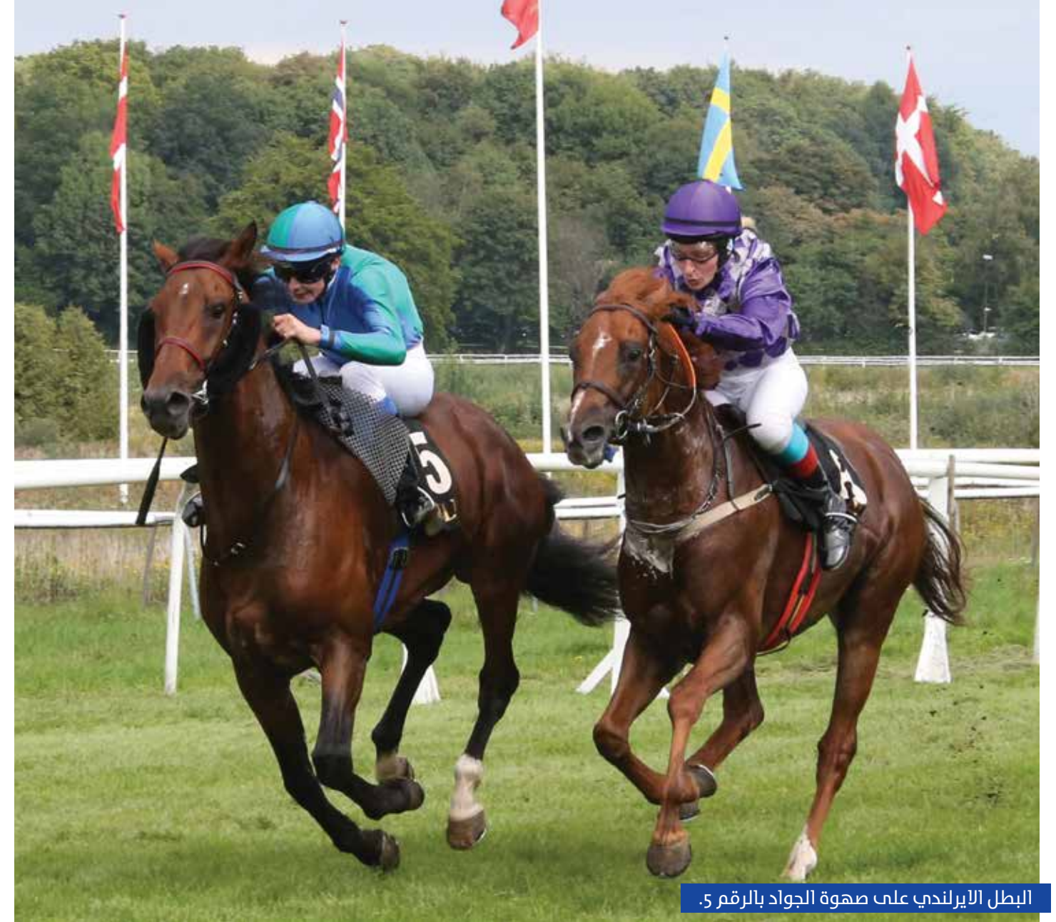
البطل الايرلندي على صهوة الجواد بالرقم 5.

ويأتي تنظيم المهرجان بتوجيهات سمو الشيخ منصور بن زايد آل نهيان نائب رئيس مجلس الوزراء وزير شؤون الرئاسة، وسمو الشيخة فاطمة بنت مبارك (أم الإمارات) رئيسة الاتحاد النسائي العام الرئيسة الأعلى لمؤسسة التنمية الأسرية رئيسة المجلس الأعلى للأمومة والطفولة. واجتذبت الجولة السادسة من مونديال «أم الإمارات» للفارسين المتدربين لمسافة 1800 م، البالغ جائزته المالية 20 ألف يورو، 8 من الفارسين والفارسات بعد