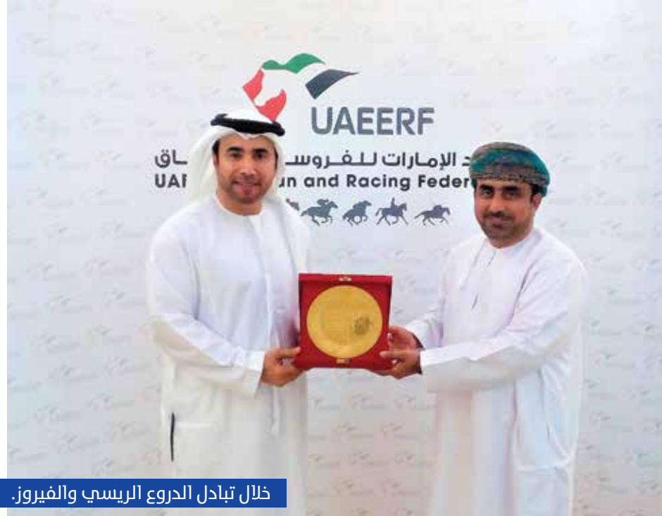
خلال تبادل الدروع الريسي والفيروز.

دولتنا الغالية وبالتحديد العاصمة أبوظبي لتحصل على تنظيم بطولة كأس العالم للتقاط الأوتاد الثالثة. وأكد الريسي أن ذلك جاء كنتيجة لدعم وتوجيهات ومتابعة من سمو الشيخ منصور بن زايد آل نهيان نائب رئيس مجلس الوزراء وزير شؤون الرئاسة المستمر والغير محدودة، وعلى ثقة الاتحاد الدولي للتقاط الأوتاد إلى المكانة الكبيرة التي تحظى بها الدولة في جميع الميادين الرياضية. وأضاف الريسي أن فرسان الإمارات يستعدون لخوض المنافسات والوصول إلى المركز الأول ضمن معسكر تدريبي مكثف، حيث وجه الريسي بتدليل كافة العقبان التي تواجه الفرسان وتجهيزهم بكافة الوسائل الممكنة للوصول إلى أقصى طاقاتهم ورفع علم الوطن عالياً. كما بشر الريسي بأن العمل جار على قدم وساق لإنهاء التجهيزات الخاصة بالبطولة، من تجهيزات خاصة بالخيل واستقبال الوفود وممرات