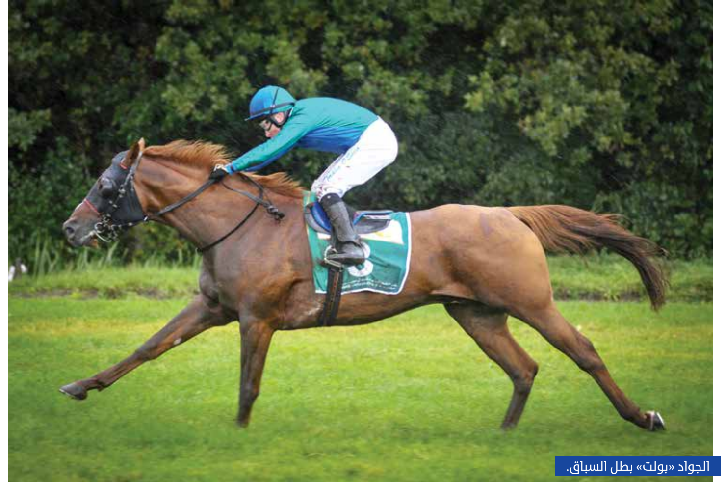
الجواد «بولت» بطل السباق.