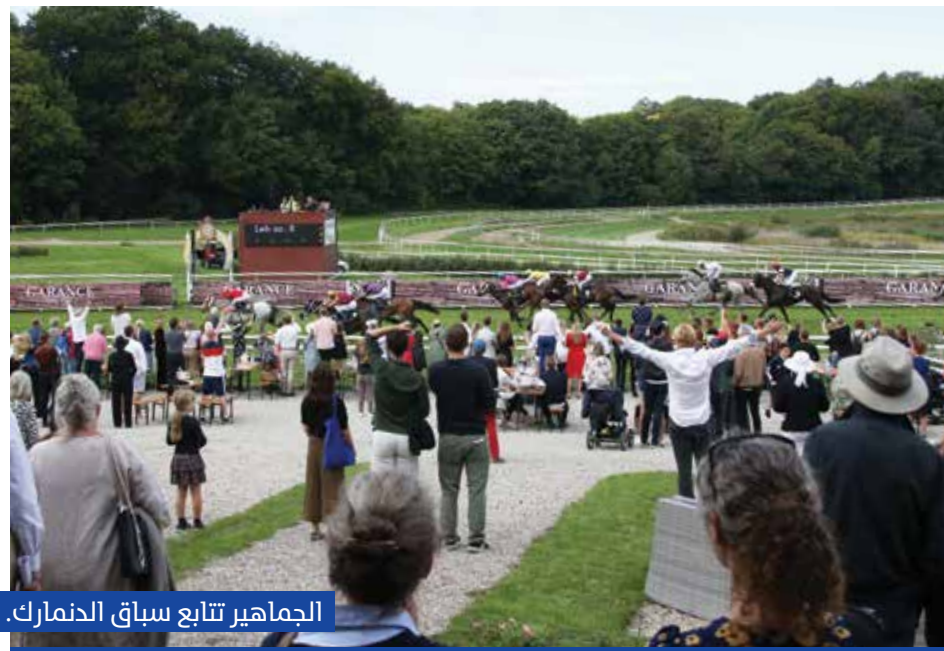
الجمهور يتابع سباق الدنمارك.

المهر «أكوي» بطل الجولة السادسة، سبق أن فاز مرتين كجواد ناشئ، وفعل ذلك مرة أخرى هذا الموسم، قبل أن يحتل المركز الخامس في الديربي الفرنسي، ثم ذهب إلى إيطاليا ليحتل المركز الثاني قبل فوزه بلقب الجولة السادسة من مونديال «أم الإمارات».