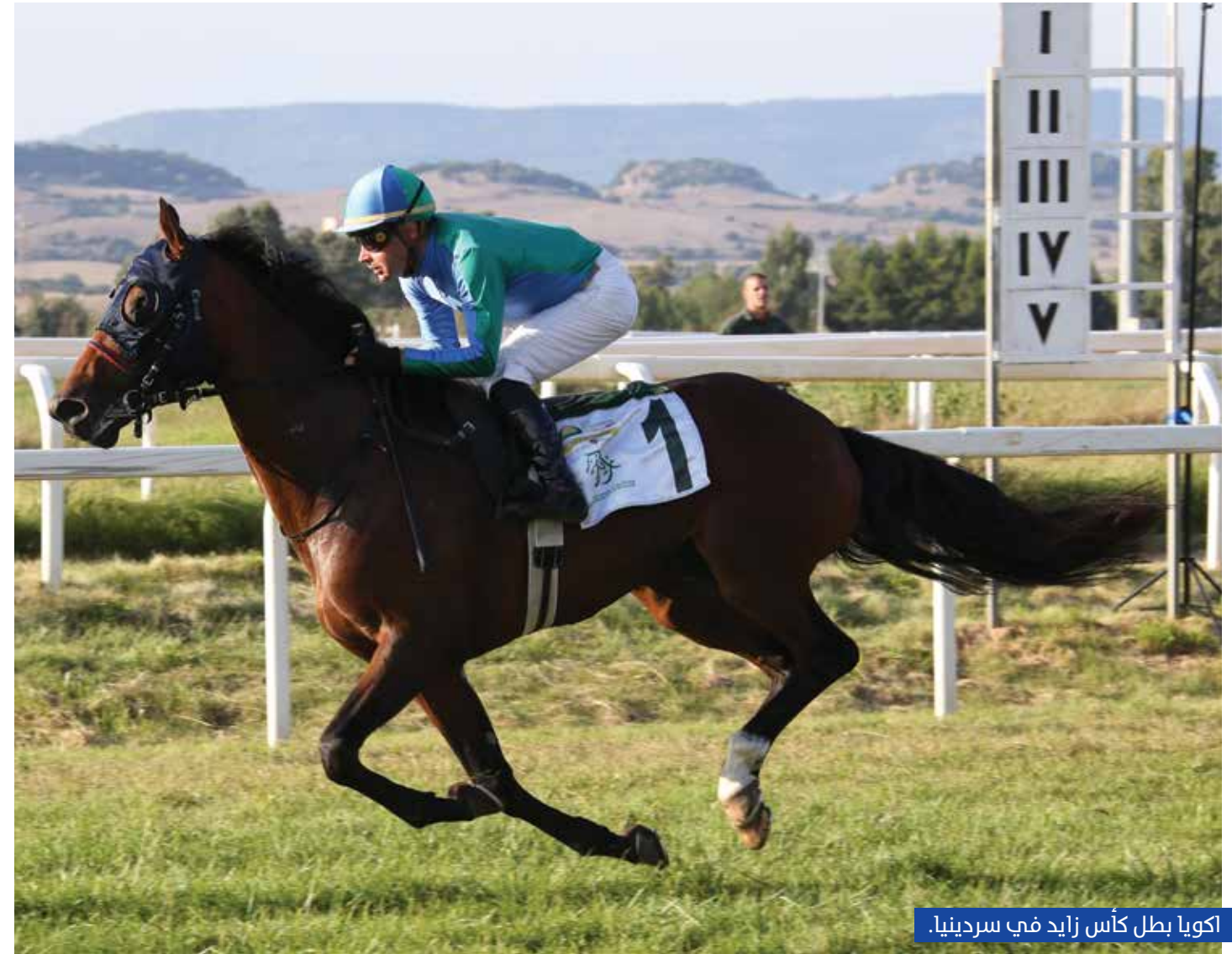
أكويا بطل كأس زايد في سردينيا.