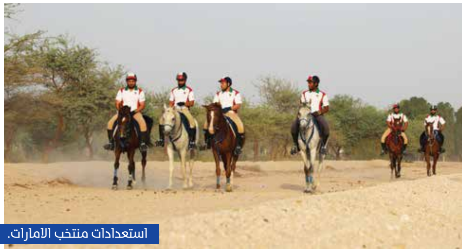
استعدادات منتخب الإمارات.