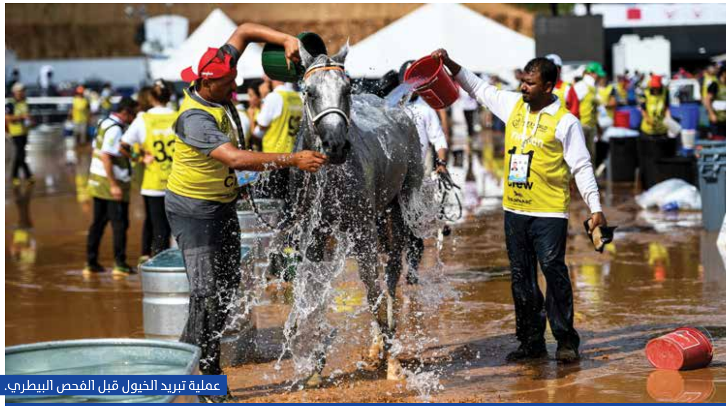
عملية تبريد الخيول قبل الفحص البيطري.

والمحت اللجنة في بيان تال الى انها تدرس امكانية اعادة البطولة، مشيرة الى ان قرار الالغاء كان صحيحا وفيها وان اللجنة اتخذت القرار الصحيح. وذكرت اللجنة في بيانها الأول أنها استندت في قرار الالغاء إلى المادة 109.12 من اللوائح العامة للاتحاد