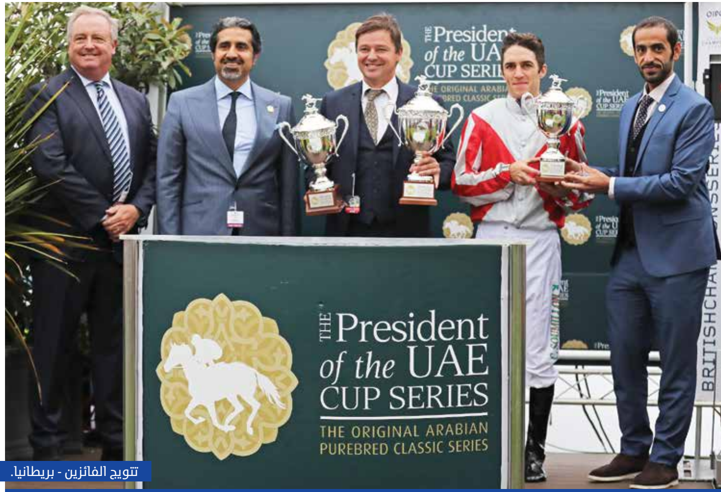
تتويج الفائزين - بريطانيا.