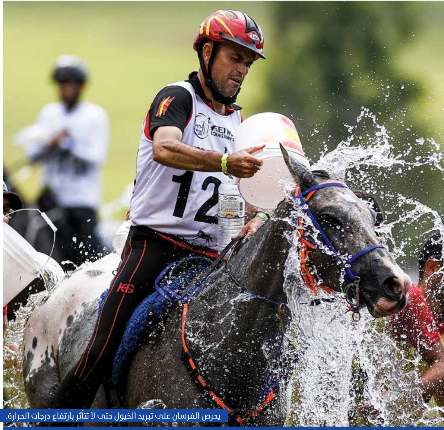
يحرص الفرسان على تبريد الخيول حتى لا تتأثر بارتفاع درجات الحرارة.

وتسببت الإجراءات المتخبطة للجنة المنظمة للبطولة