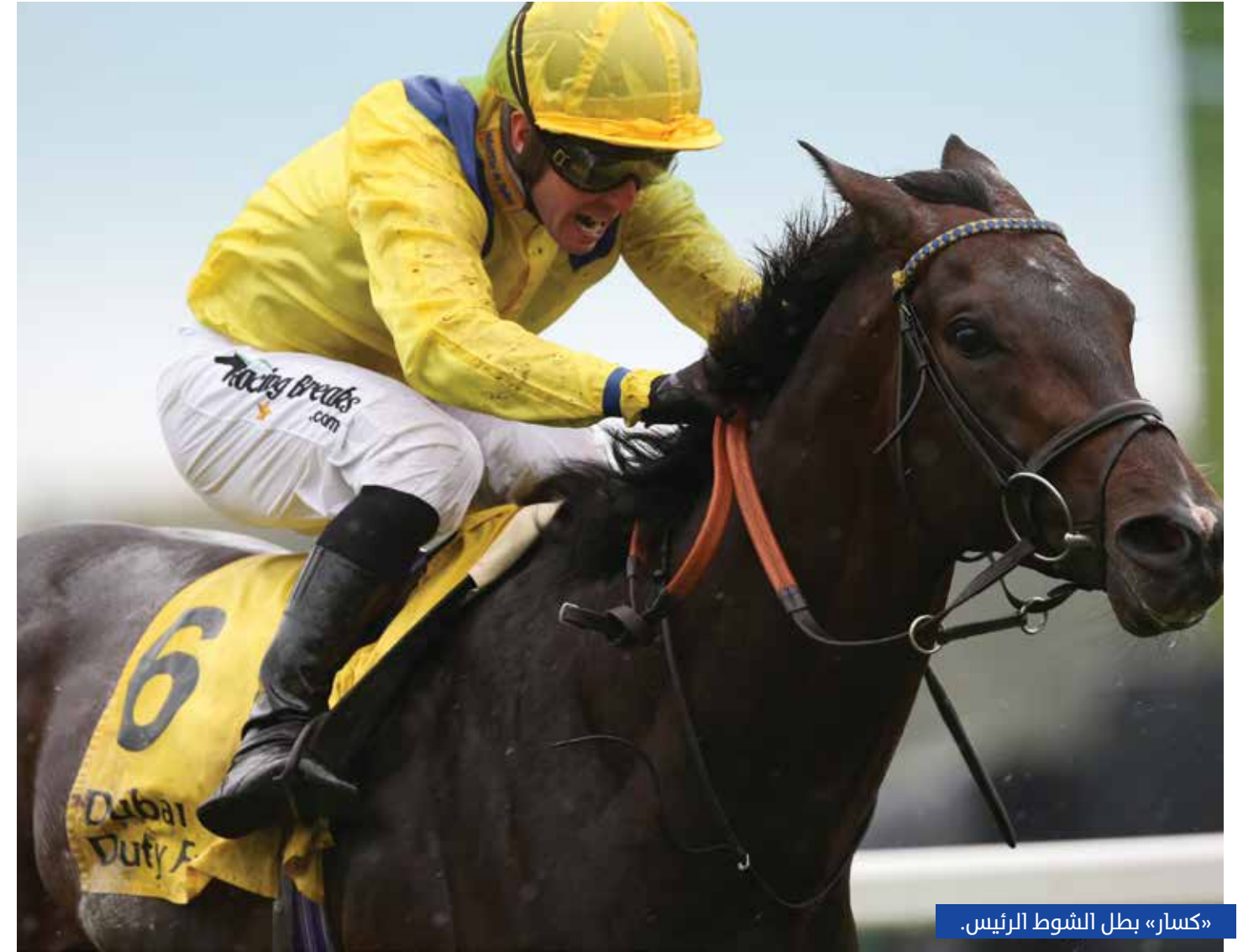
«كسار» بطل الشوط الرئيسي.

شهد مضمار نيوبري الإنجليزي سباقات نهاية الأسبوع الدولية، التي رعت سوق دبي الحرة خمسة من أشواط يومها الثاني، حيث توج الجواد «كسار» بقيادة فرانكي ديتوري، بالشوط الرئيسي «سوق دبي الحرة» ميل ريف ستيكس» لمسافة 1200 متر «جروب 2» في اليوم الثاني للفعاليات. وتمكن «كسار»، الذي يشرف على تدريبه جون جوسدن، من الوصول إلى خط النهاية أولاً، على الرغم من الأمطار الغزيرة التي هطلت على المضمار، قاطعاً مسافة السباق بزمان قدره 1:14.23 دقيقة، وحصل على النصيب الأكبر من جائزة الشوط المالية البالغة 134.000 دولار، وأضاف اسمه إلى