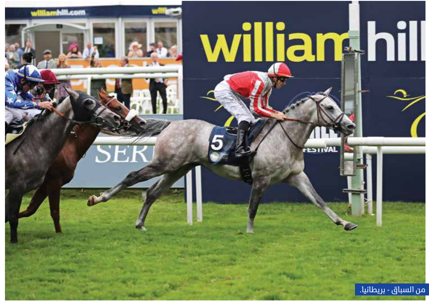
من السباق - بريطانيا.

التميز والإبهار التنظيمي تقديراً لمكانة الكأس العالمية المرموقة في المضامير العالمية، كما شهدت المحطة الروسية، استمرارية النجاحات المبهرة للسباقات في المضامير الأوروبية، في ظل الجهود الدؤوبة، التي قامت بها اللجنة المنظمة، بالتعاون المشترك مع سفارة الدولة في روسيا الاتحادية، التي قامت بدعوة أعضاء السلك الدبلوماسي، للدول الصديقة العربية والأجنبية.