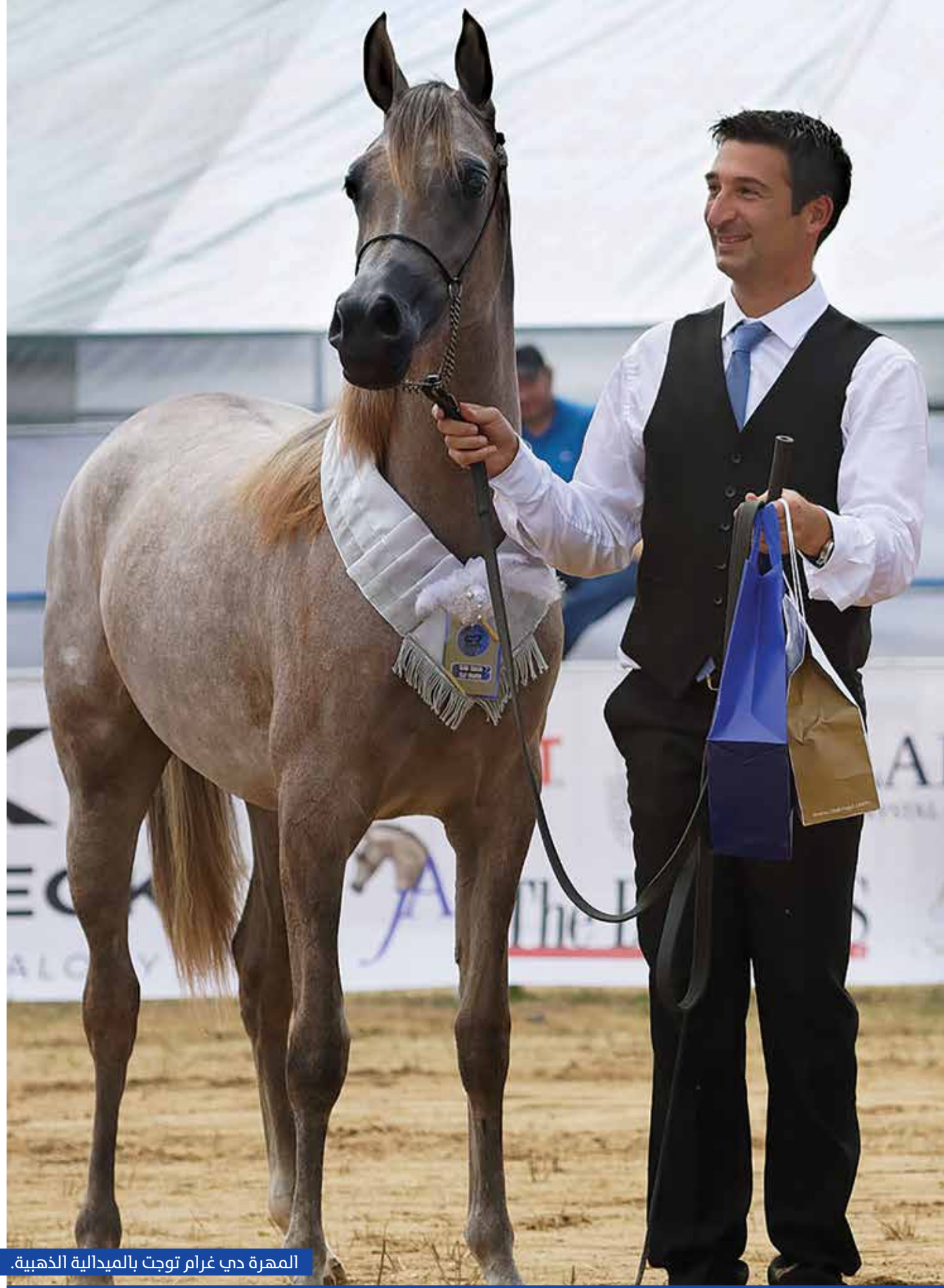
المهرة دي غرام توجت بالميدالية الذهبية.

أكد مربط دبي للخيول العربية حضوره الذهبي في ختام منافسات بطولة بيرغامو الدولية لجمال الخيل العربية الأصلية 2018 بإيطاليا. واستطاعت المهرة «دي غرام» وهي من الفحل العالمي وأسطورة الإنتاج العالمي المعاصر إف إيه إل رشيم والفرس العالمية إف تي شيلا أن تتال ذهبية المهرات بعد عروض مثيرة لأجمل المهرات التي دفعت بها المرباط الدولية. كما استطاعت المهرة دي تميز وهي من الفحل إف إيه إل رشيم والفرس العالمية دي شهلا من انتزاع الميدالية البرونزية معززة حصيلة مربط دبي من ميداليات