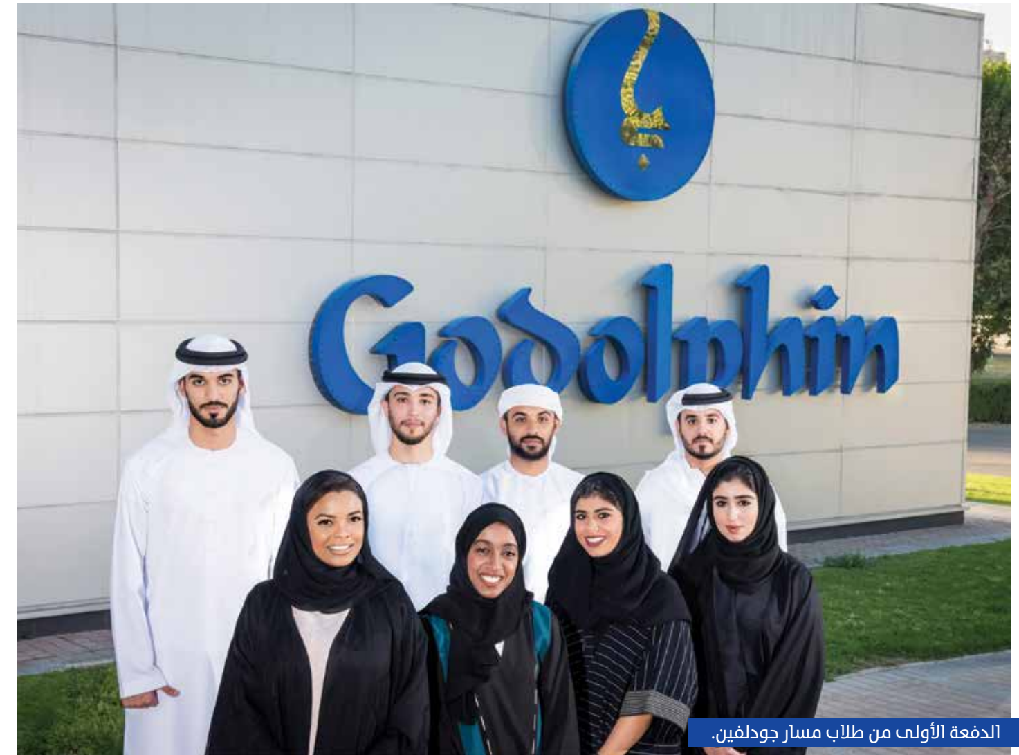
الدفعة الأولى من طلاب مسار جودلفين.

وقال هيو اندرسون، مدير عام جودلفين بالملكة المتحدة ودي: «مسار جودلفين برنامج فريد من نوعه ويظهر مجددا جانبا آخر من الشغف الدائم لصاحب السمو الشيخ محمد بن راشد آل مكتوم بسباقات وإنتاج الخيول، ويعكس التزام سموه المستمر بصناعة مستقبل مستدام لكل من الصناعة والأفراد العاملين بها.» من جانبه قال علي العلي، رئيس مسار جودلفين: «جودلفين هو الفريق المحلي لدي، وكإماراتي أشعر بفخر بالغ لقيادة هذا البرنامج، ونشعر بإثارة بإطلاق عملية البحث عن الكوادر الإماراتية الواعدة، والامارات حافلة بالشباب الموهوبين، وأشجع كل الذين لديهم العاطفة وميل للعمل الجاد بالتقدم لهذا البرنامج.»