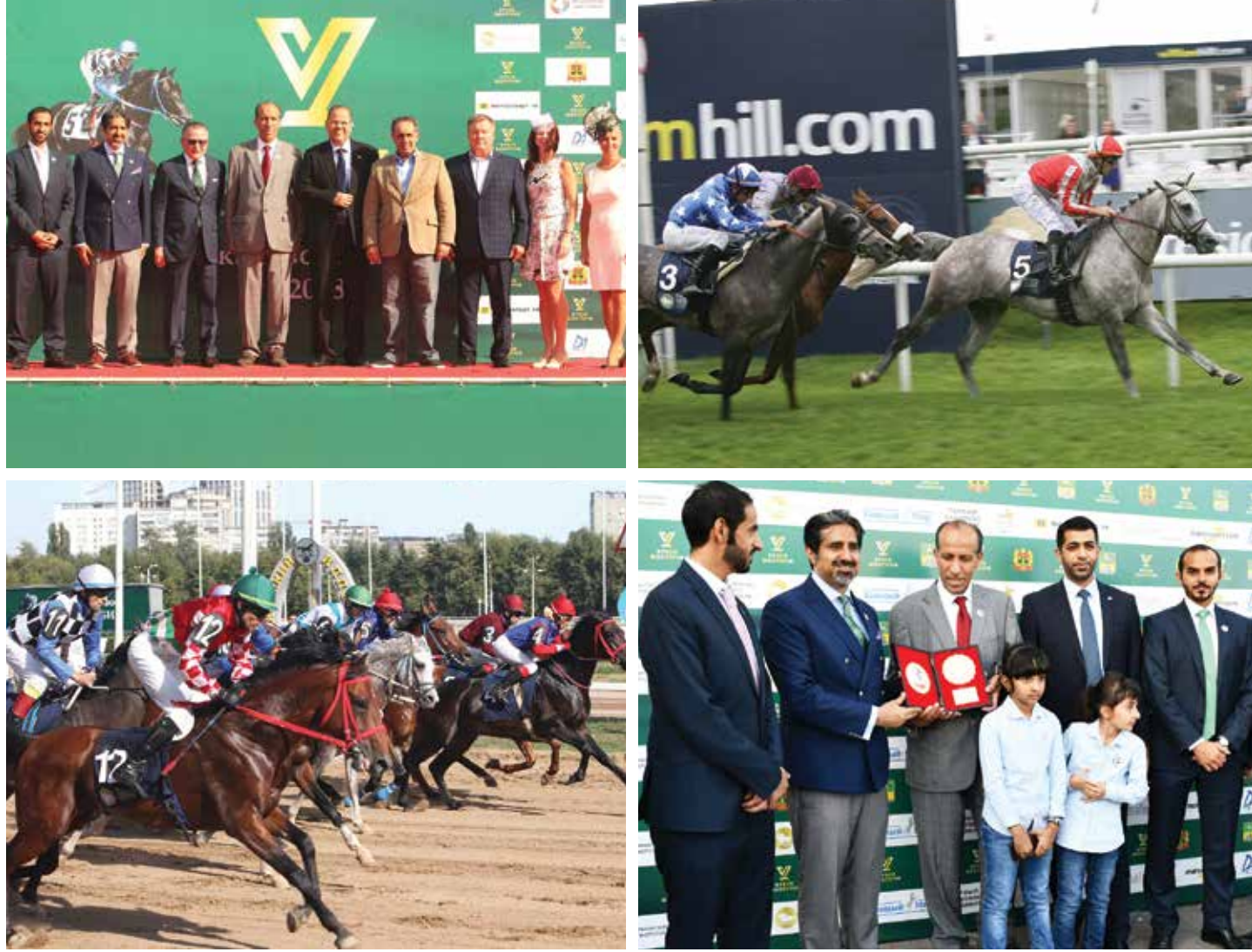
تتويج الفائزين - روسيا.