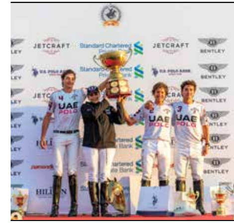
54 كأس ستاندرد تشارترد الذهبية للبولو 2020