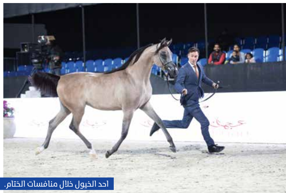
احد الخيول خلال منافسات الختام.

واختتم حديثه متوجهاً بالشكر والتقدير الى جميع أعضاء اللجان الفنية والتنظيمية على جهودهم الحثيثة التي كان لها الأثر البالغ في هذا النجاح، كما تقدم بالتهاني للمرابط الفائزة متمنياً حظاً أوفر لمن لم يحالفهم التوفيق.