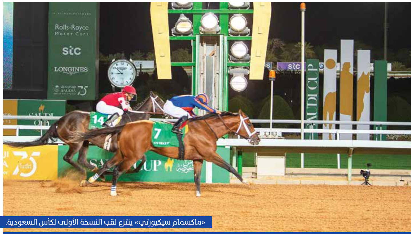
«ماكسمام سيكيورتي» ينتزع لقب النسخة الأولى لكأس السعودية.

الخيول على مستوى العالم، وشملت تشكيلة النجوم المتسابقين، فرساناً وفارسات، من السعودية، والمملكة المتحدة، واليابان، وإيطاليا، وألمانيا، ونيوزيلندا، وكندا، وسويسرا، والولايات المتحدة الأميركية، وفرنسا.