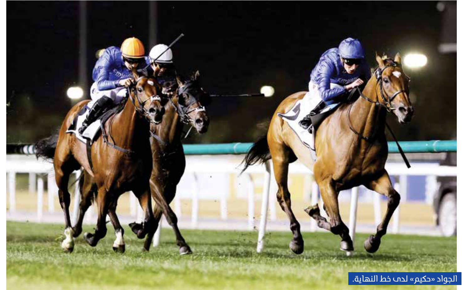
الجواد «حكيم» لدى خط النهاية.