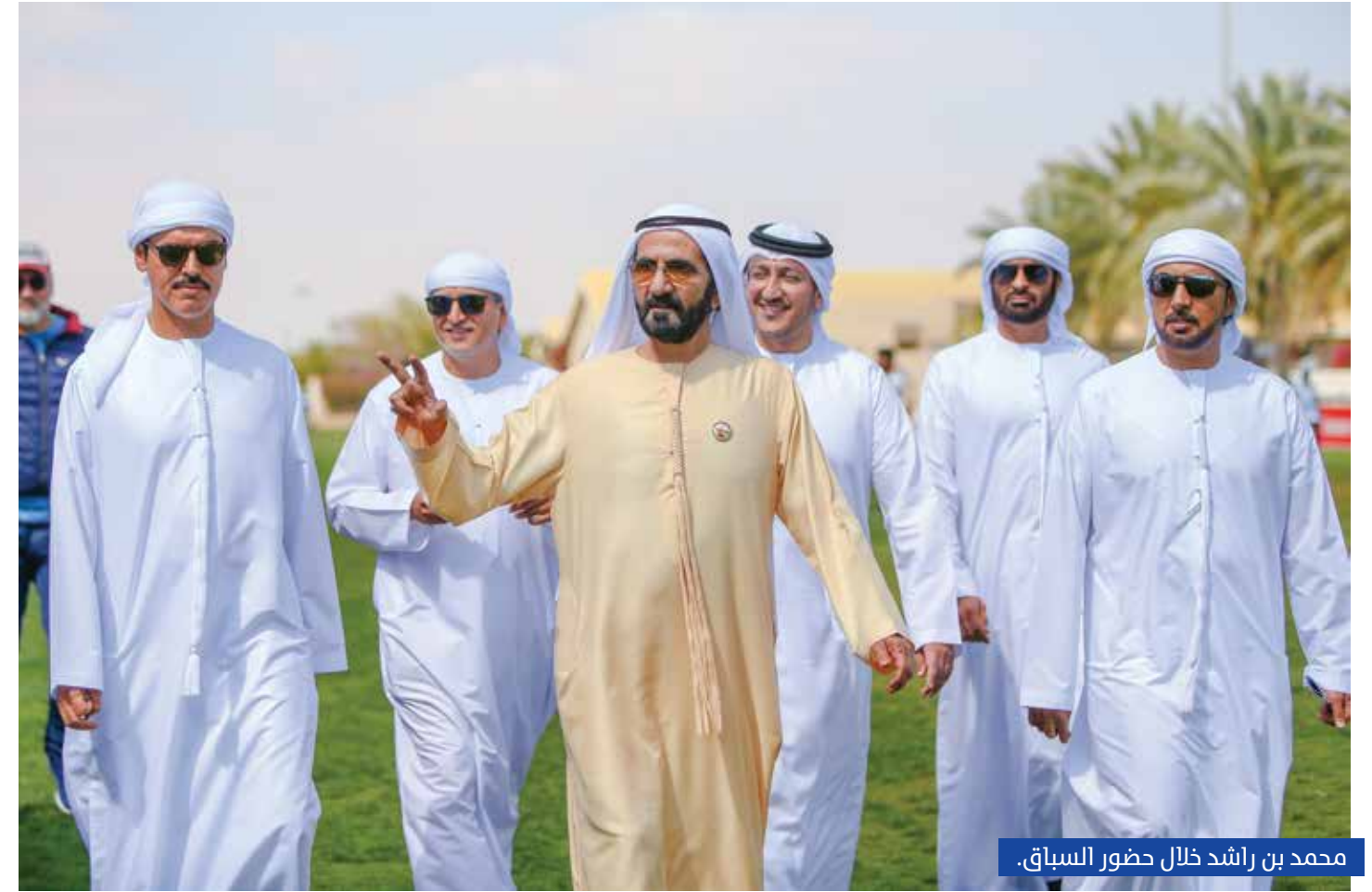
محمد بن راشد خلال حضور السباق.

شهد صاحب السمو الشيخ محمد بن راشد آل مكتوم نائب رئيس الدولة رئيس مجلس الوزراء حاكم دبي «رعاه الله»، بحضور سمو الشيخ حمدان بن محمد بن راشد آل مكتوم ولي عهد دبي، فعاليات السباق الرئيسي لمهرجان سمو ولي عهد دبي للقدرة. وتابع سموه، جانباً من المراحل الأربعة للسباق الذي يعتبر أحد أهم البطولات في روتنامة الموسم المحلي ويترقبه نخبة من المهتمين بهذا النوع من السباقات من داخل الدولة وخارجها.