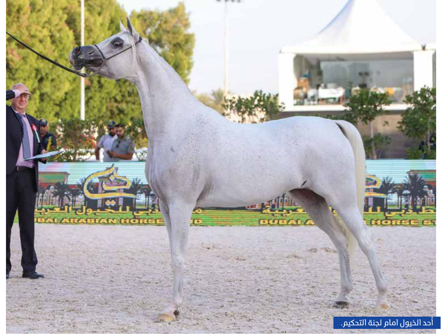
أحد الخيول امام لجنة التحكيم.

بن زايد آل نهيان نائب رئيس مجلس الوزراء وزير شؤون الرئاسة، استطاعت ترسيخ نفسها كأحد أهم الوجهات للخيول العربية الأصيلة.