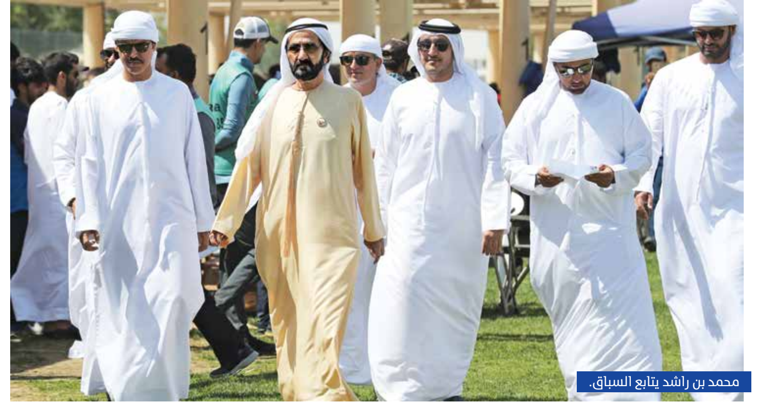
محمد بن راشد يتابع السباق.

وقال «مزيونة» استطاعت أن تواصل تألقها بتحقيق هذه الثانية، مشيراً إلى أن السباق جاء قويا وسريعا وشهد منافسة قوية خاصة من قبل الفرس «فلورا» التي لازمها سوء الطالع. وأشاد بفريق إسطبلات إسطبلات (F3) بقيادة سمو الشيخ حمدان بن محمد بن راشد آل مكتوم، وقال