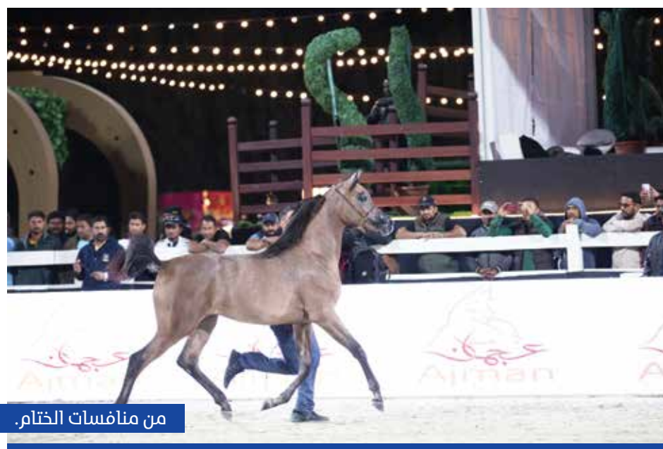
من منافسات الختام.

وقال ان هذا النجاح الكبير جاء بفضل الله ثم الرعاية