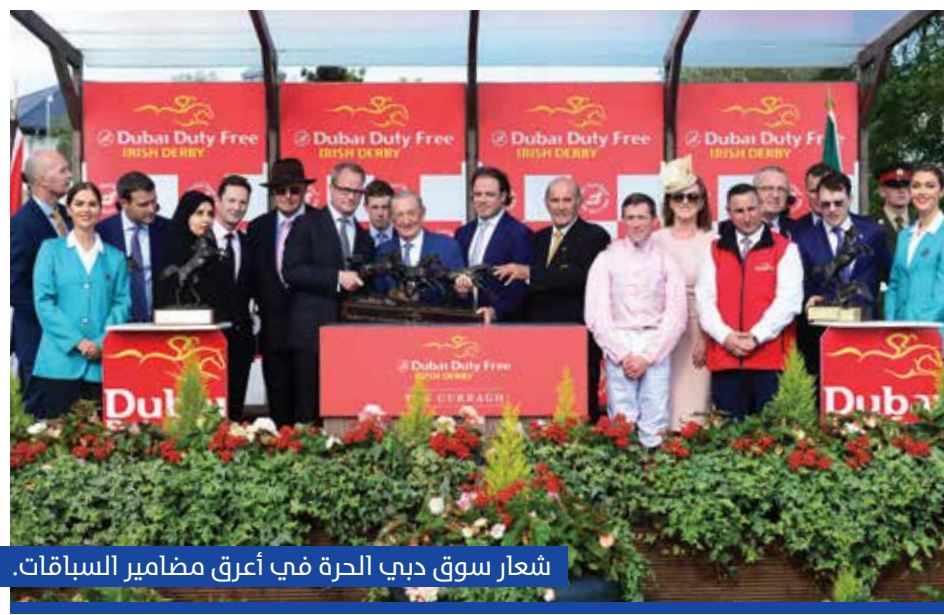
شعار سوق دبي الحرة في أعرق مضامير السباقات.

ما هو تأثير المهرجان والأحداث الرياضية على قطاع التجزئة بشكل عام وبشكل خاص مهرجان دبي للتسوق؟