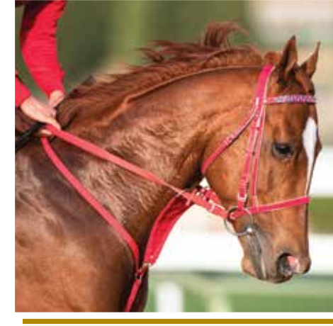
52 تدريب الحصان على السباق