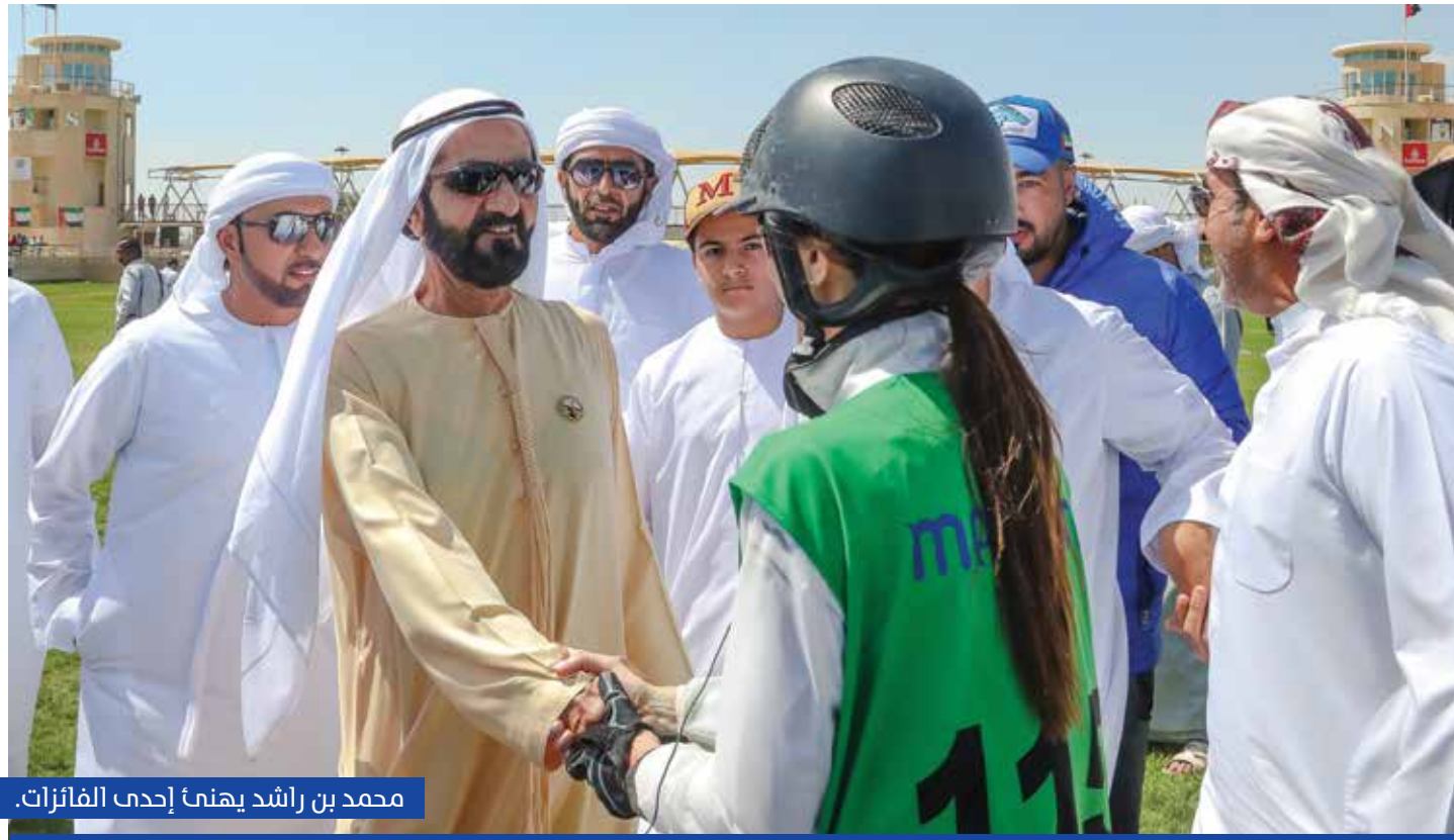
محمد بن راشد يهنئ إحدى الفائزات.

اليمامة للقدرة المخصص للأفراس، للعام الثالث على التوالي بعد ان حلق عبد الله علي العامري بلقب السباق، على صهوة الفرس «مزيونة» ضمن فعاليات اليوم الثالث للنسخة الثانية عشر لمهرجان سمو ولي