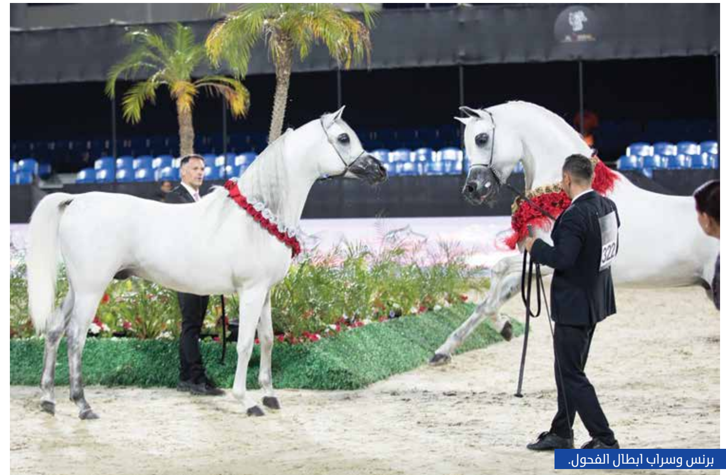
برنس وسراب أبطال الفحول.