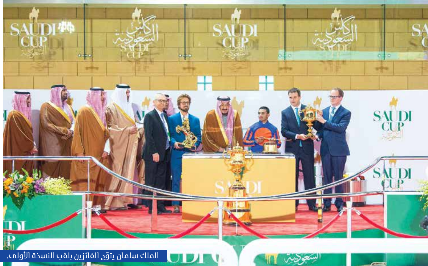
الملك سلمان يتوّج الفائزين بلقب النسخة الأولى.

الشريفين الرئيس الفخري لمجلس الفروسية، والدعم المباشر من ولي العهد الأمير محمد بن سلمان لقطاع الرياضة ورياضة الفروسية تحديداً، تعدّ دافعاً أساسياً لإنجاح مثل هذه البطولات التي أشاد بنجاحها الجميع.