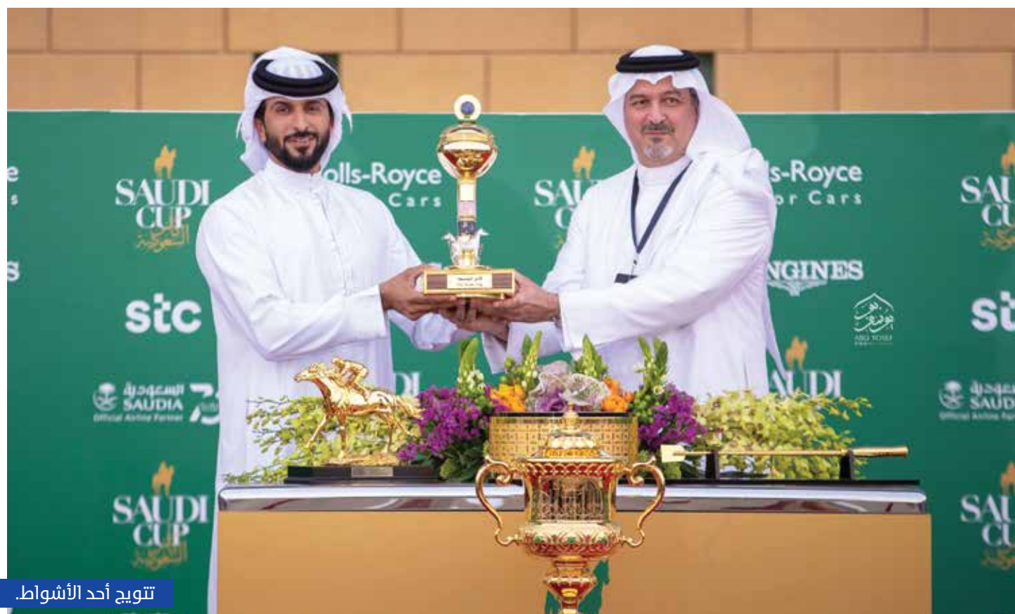
تتويج أحد الأبطال.