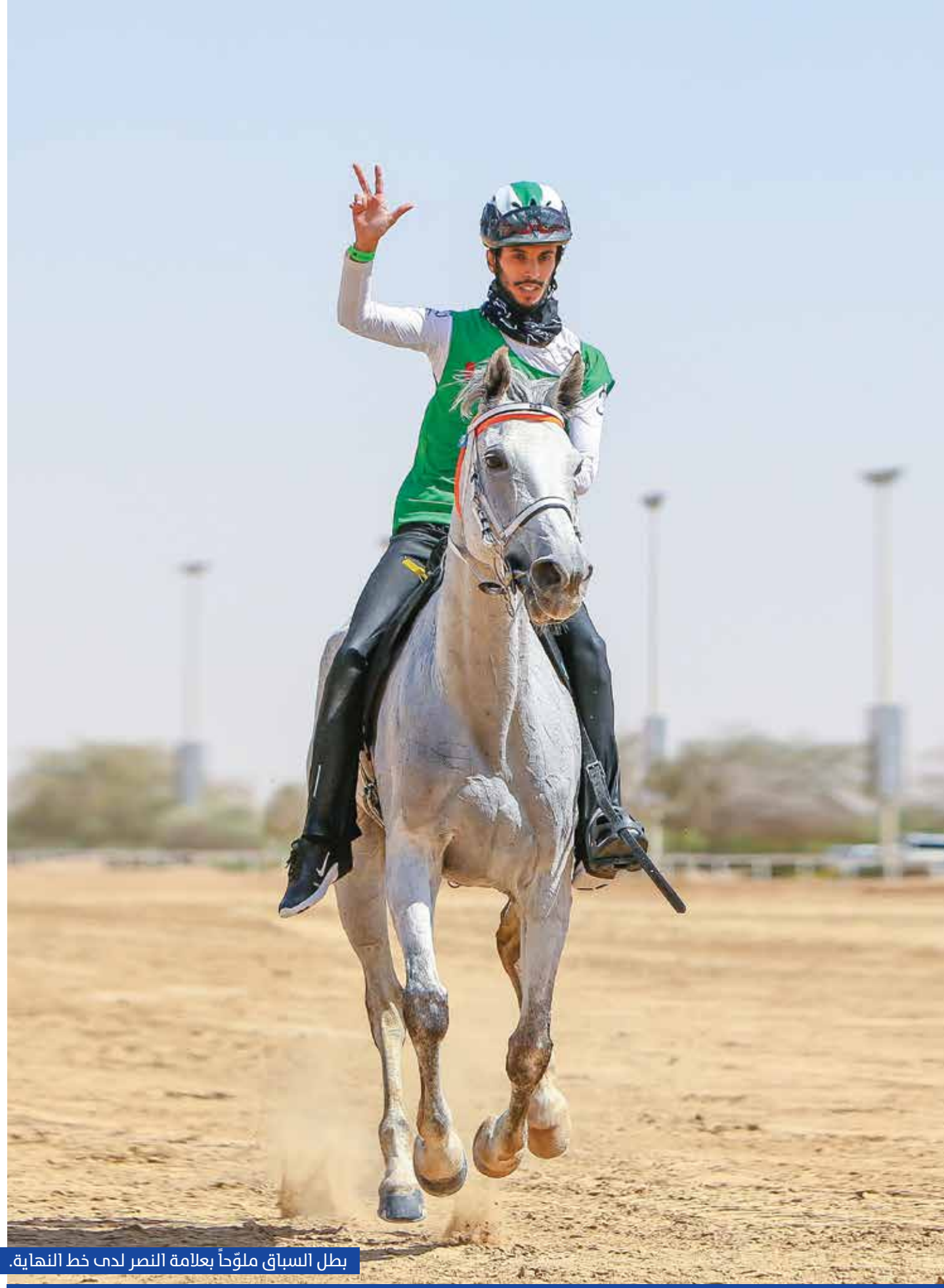
بطل السباق ملوّحاً بعلامة النصر لدى خط النهاية.