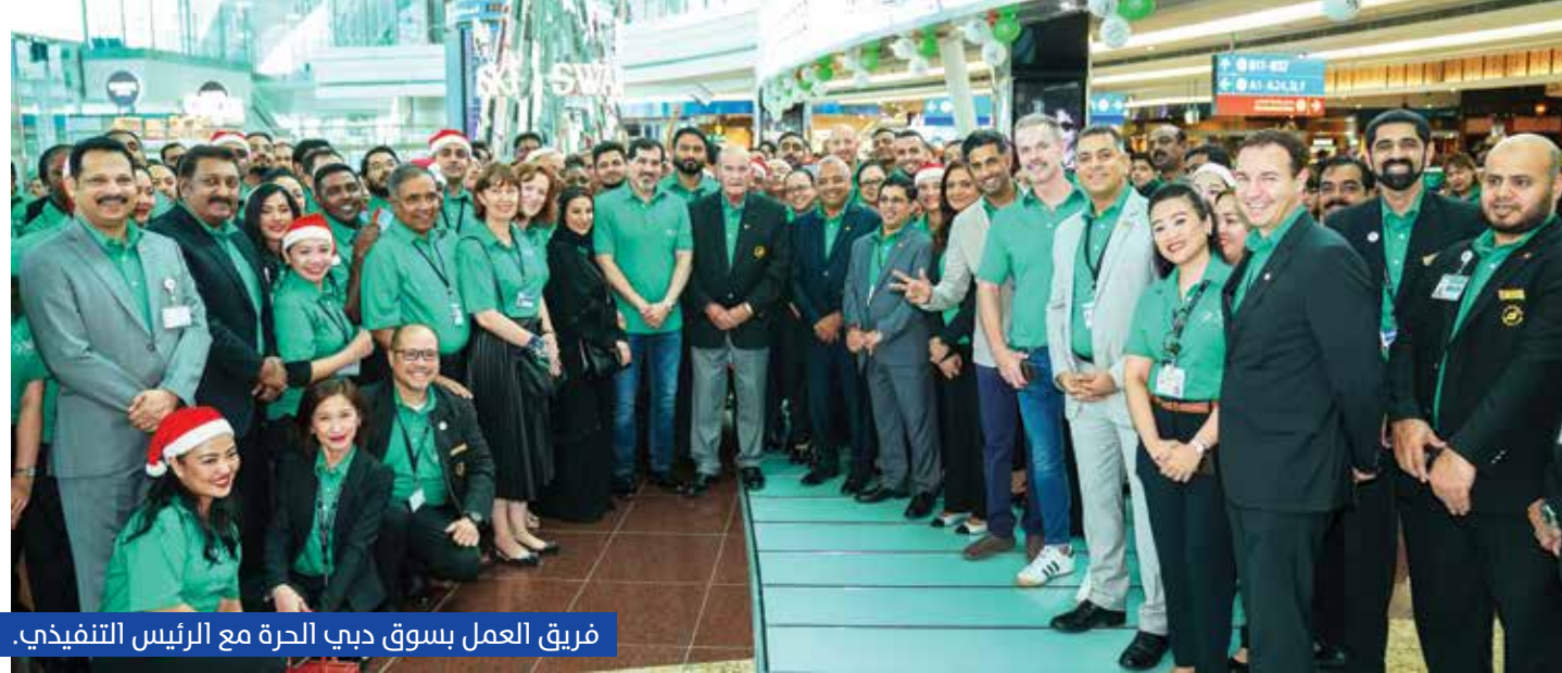
فريق العمل بسوق دبي الحرة مع الرئيس التنفيذي.

في بداية سوق دبي الحرة قبل أكثر من 36 سنة، كان هناك 100 موظف وبلغ حجم مبيعاتكم حوالي 20 مليون دولار أمريكي. كم عدد الموظفين الذين يعملون الآن وما تبقى من الجيل الأول المؤسس؟ لدينا الآن 6,100 موظف يعملون لدينا ومن بين 100 موظف من الجيل «المؤسس»، لا يزال لدينا 24 منهم في الخدمة، وهذا إنجاز رائع، ويشمل هذا بالطبع نائب