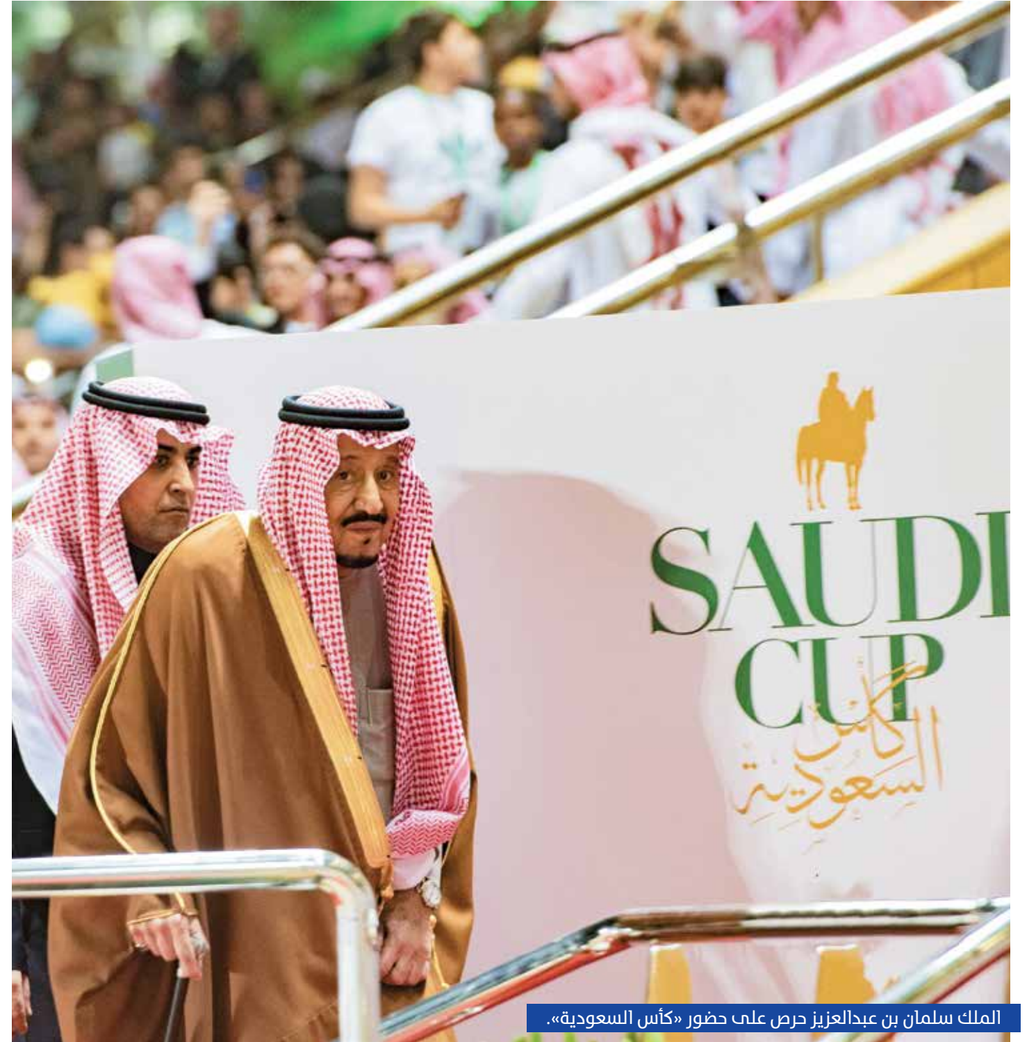
الملك سلمان بن عبدالعزيز حرص على حضور «كأس السعودية».

أرباع الطول عن الوصيف «ميدنايت بيسو». أحد أبرز ممثلي الإمارات في السباق، «بن بطل» بإشراف سعيد بن سرور وبقيادة ايسين ميرفي المركز الثالث في السباق، وحقق «ماكسيمام سيكيورتي» الفائز باللقب زمناً بلغ 1:50.58 دقيقة، بفارق ثلاثة