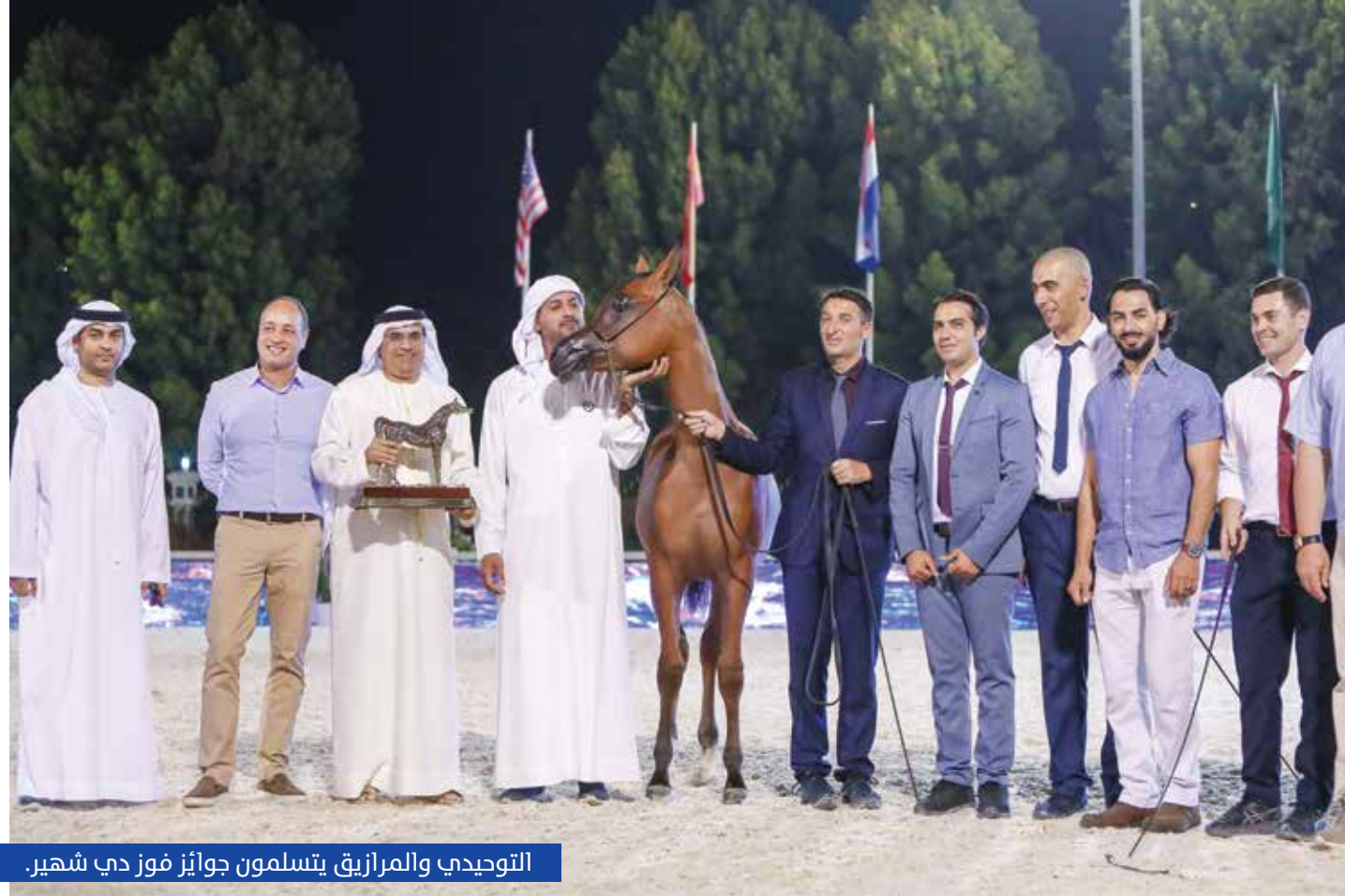
التوحيدي والمرابيق يتسلمون جوائز فوز دبي شهير.