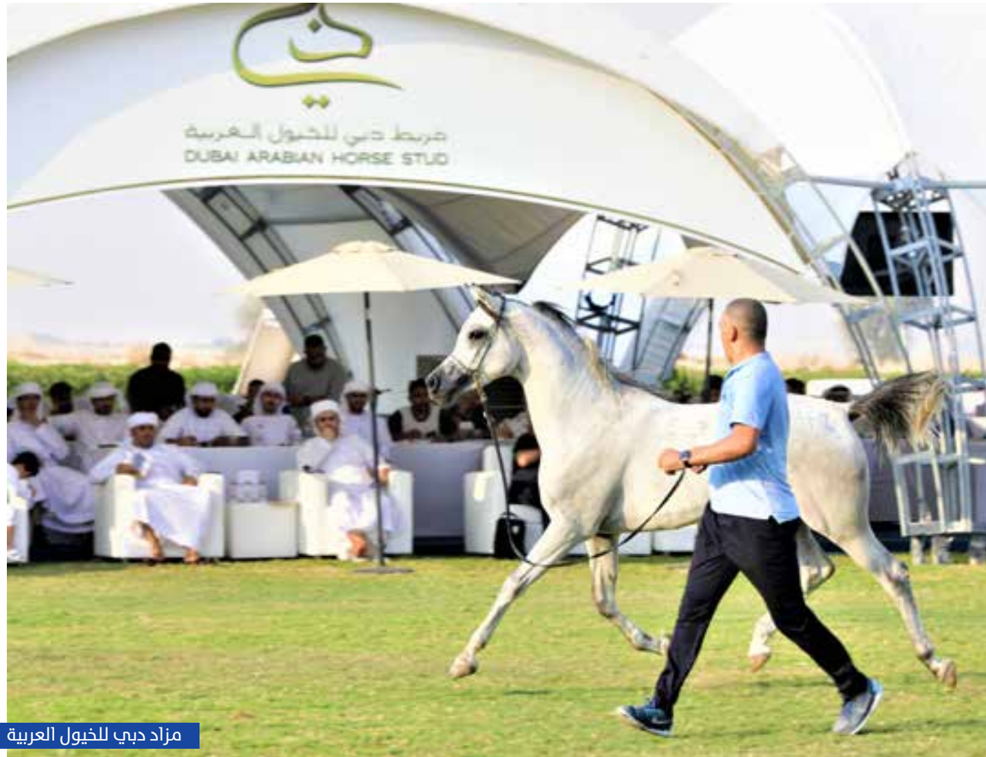
مزاد دبي للخيل العربية

الخيول عامة، والخيل العربية بوجه خاص. وتابع: «ما حققه المزاد من قيمة مالية يعتبر معدلاً عالياً جداً جعله من أقوى المزادات، بل أقواها على الإطلاق».