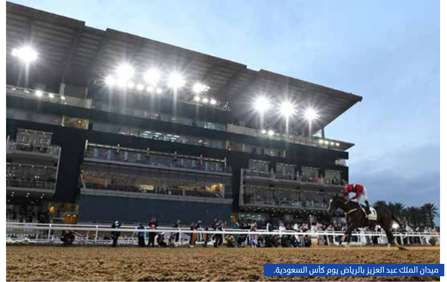
ميدان الملك عبد العزيز بالرياض يوم كأس السعودية.