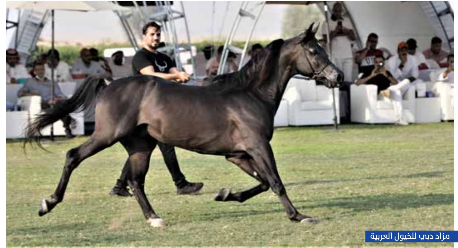
مزاد دبي للخيل العربية