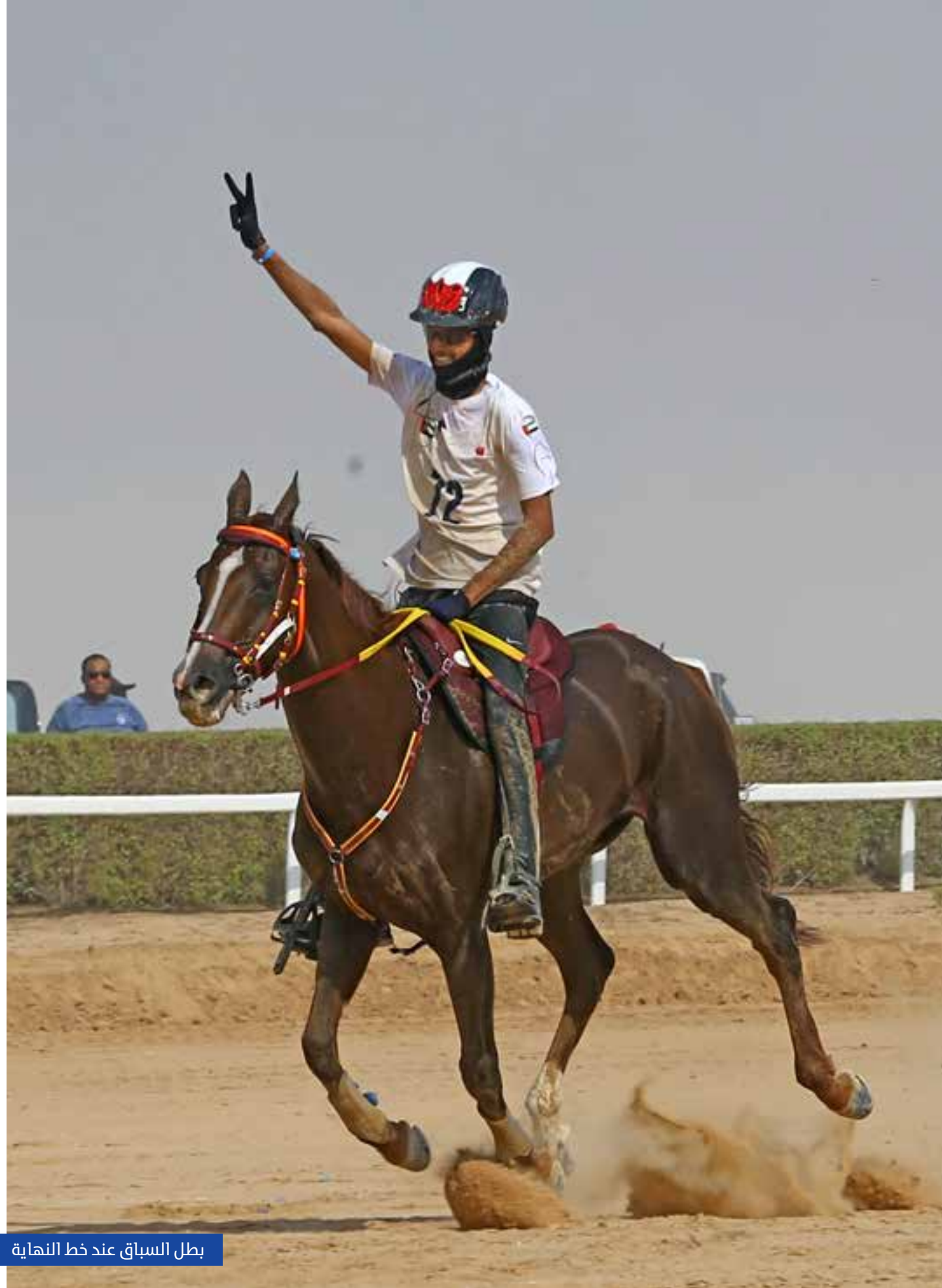
بطل السباق عند خط النهاية