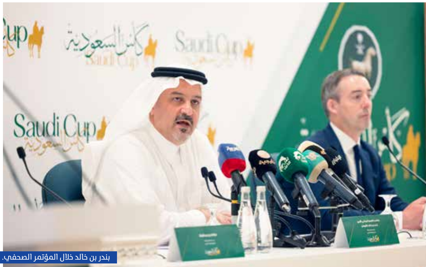
بندر بن خالد خلال المؤتمر الصحفي.