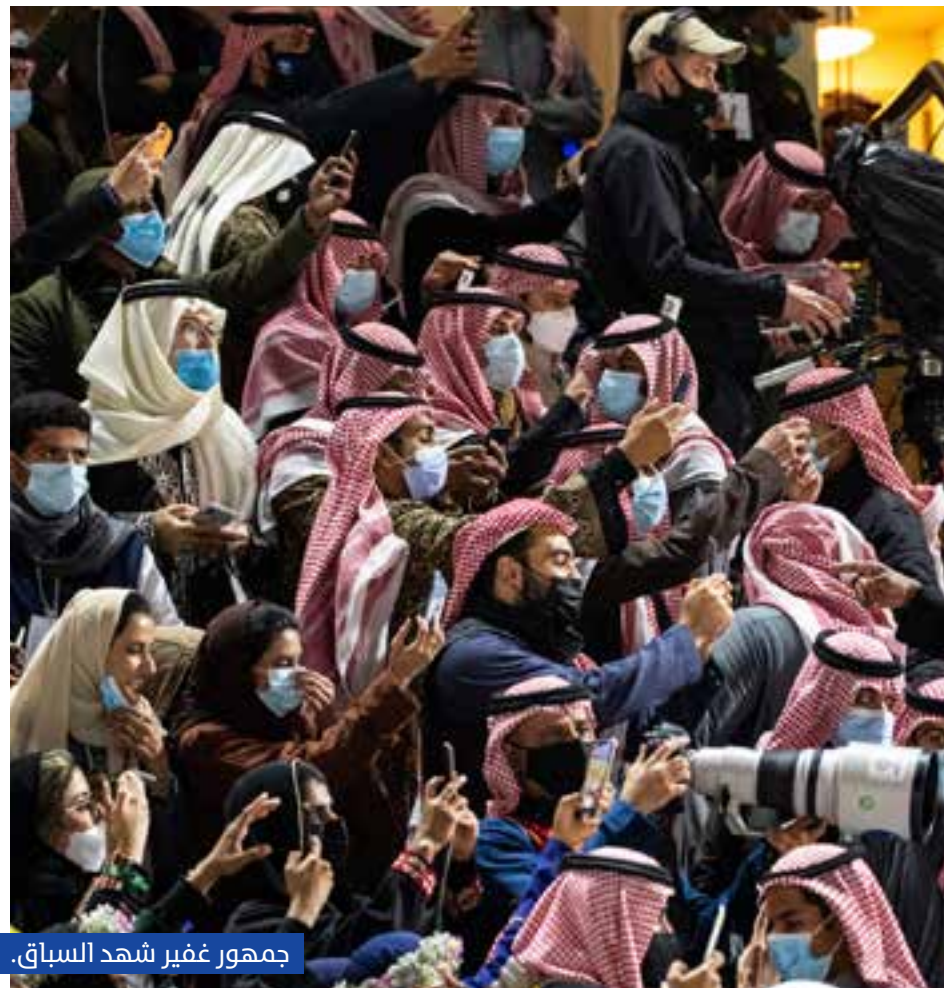
جمهور غفير شهد السباق.

التي تحظى بشغف كبير، حيث أطلقنا في عام 2020، أول نسخة من كأس السعودية في أول تجربة دولية لنا، وبعد أقل من ثلاث سنوات، دخلنا من ضمن دول المجموعة الأولى، ونتطلع الآن إلى استضافة السباق الأكثر قيمة في العالم "كأس السعودية"، بتصنيفه من أشواط الفئة الأولى، بالإضافة إلى خمسة سباقات صنفت من الفئة الثالثة".