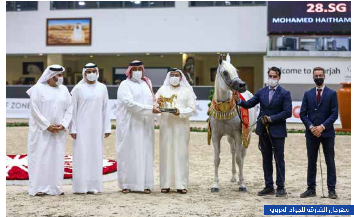
مهرجان الشارقة للجواد العربي