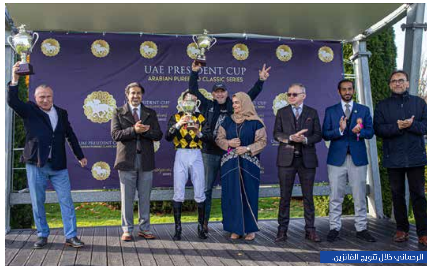
الرحماني خلال تتويج الفائزين.