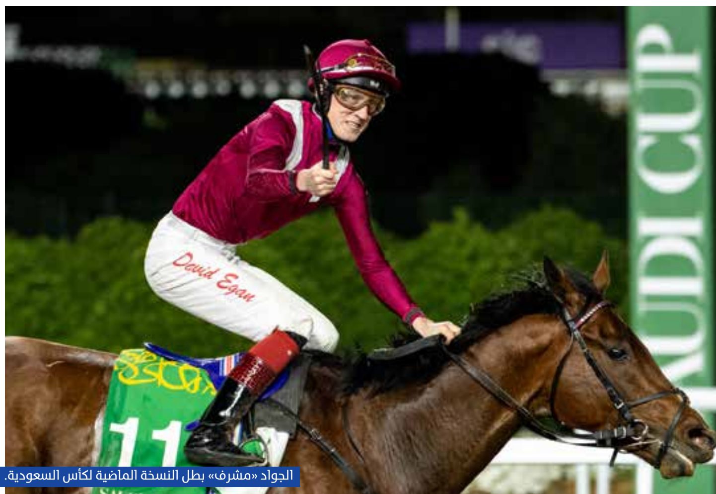
الجواد «مشرف» بطل النسخة الماضية لكأس السعودية.