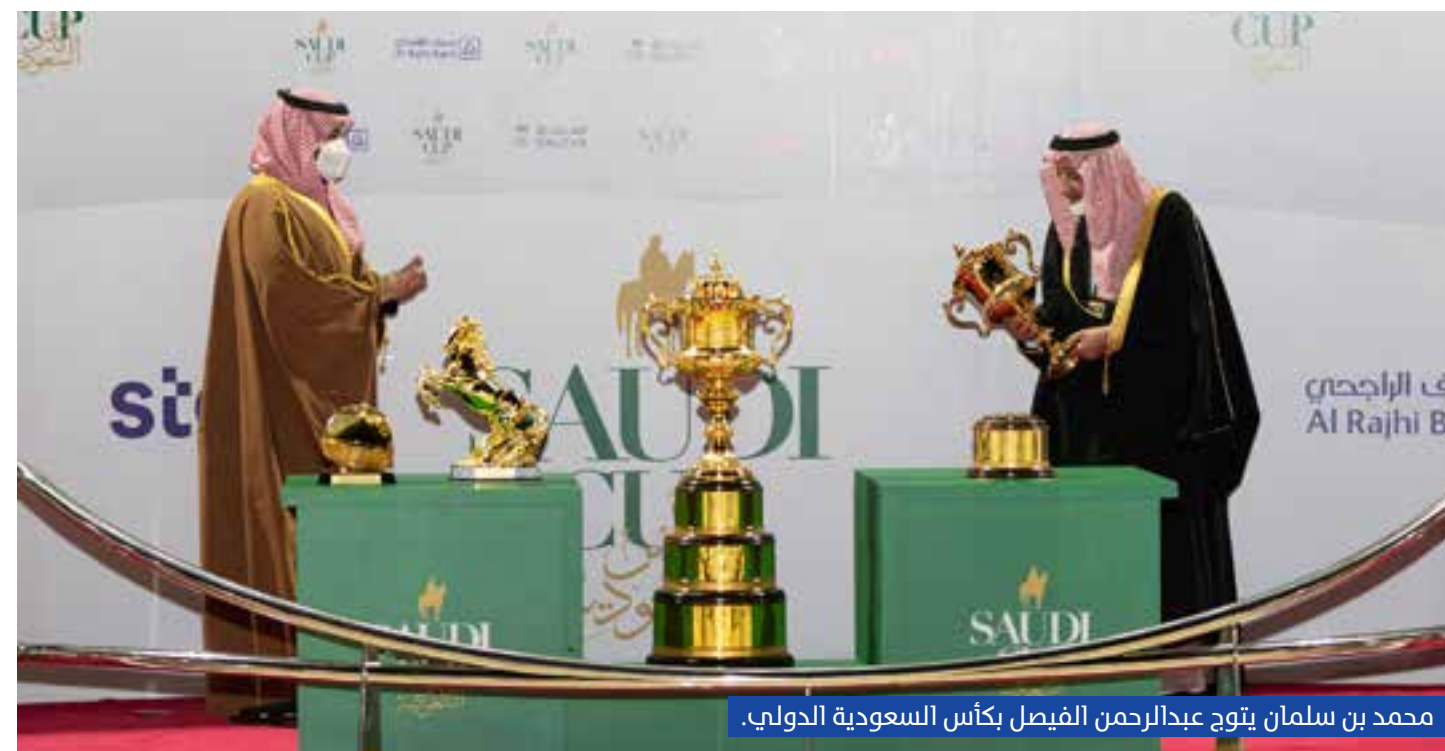
محمد بن سلمان يتوج عبدالرحمن الفيصل بكأس السعودية الدولي.

يحرص أن تواصل رياضة سباقات الخيل السعودية حضورها المتميز العالمي.