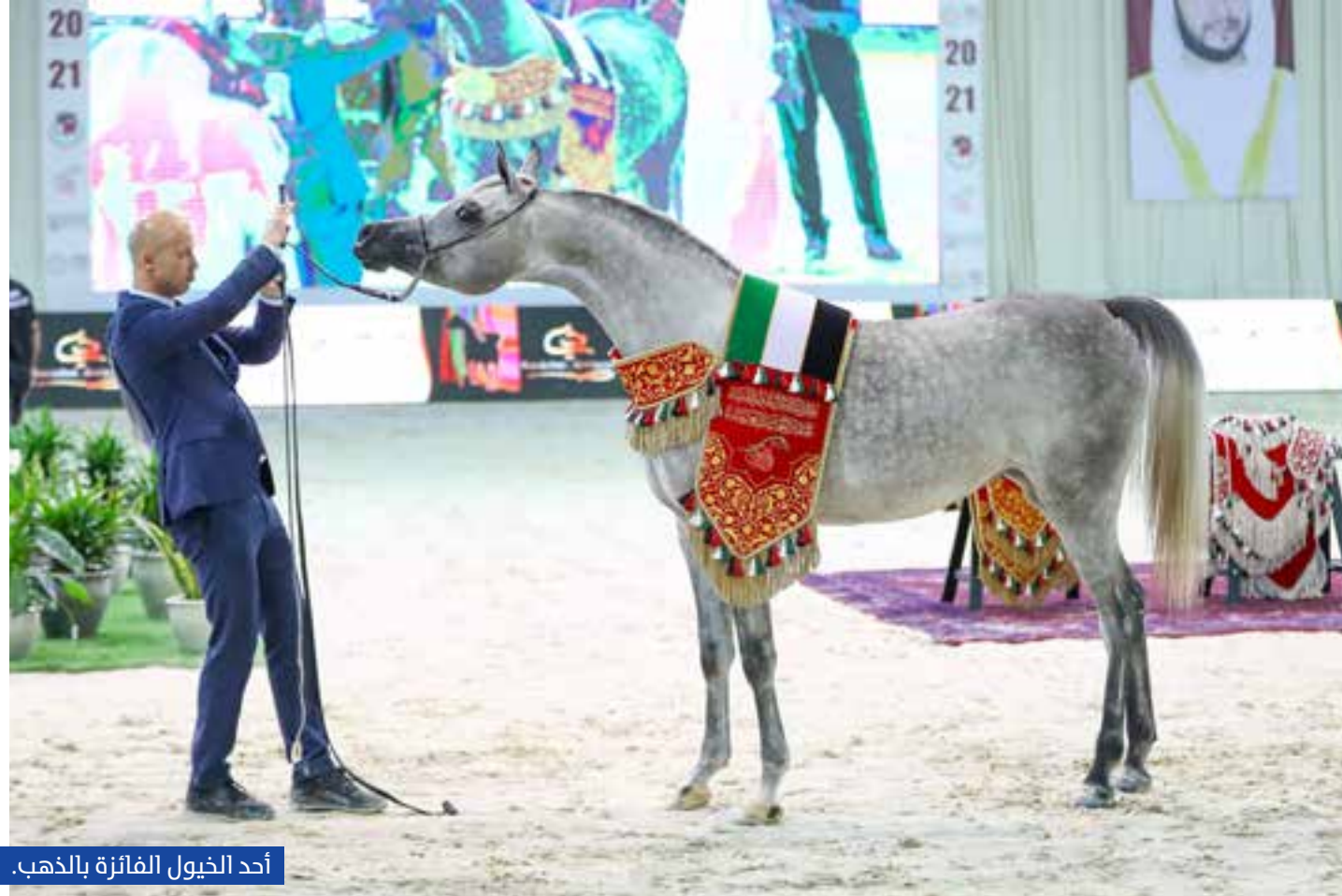
أحد الخيول الفائزة بالذهب.