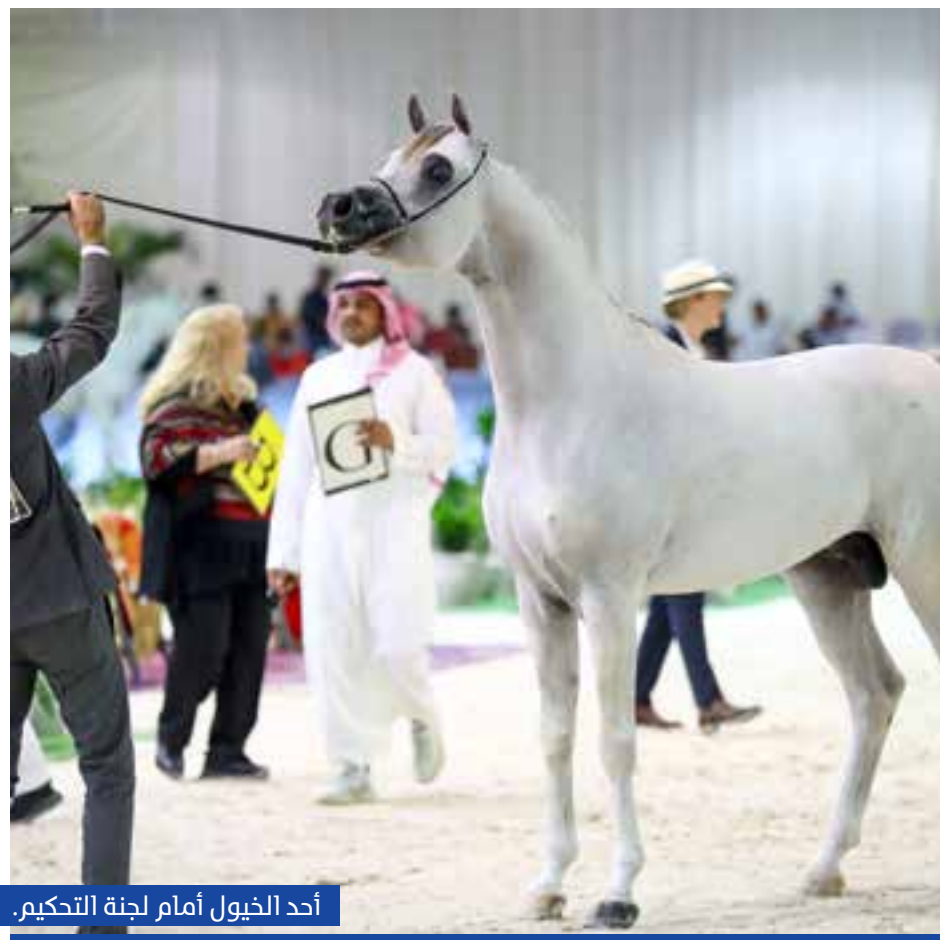
أحد الخيول أمام لجنة التحكيم.

ويشرف الشيخ زايد بن حمد آل نهيان نائب رئيس مجلس إدارة الجمعية و تم تخصيص جوائز للملاك والعارضين، وإضافة جائزة لأول مرة للسيدات من مالكات الخيل تشجيعاً لهن للاستمرار في هذا النشاط. حضور الايكاهو