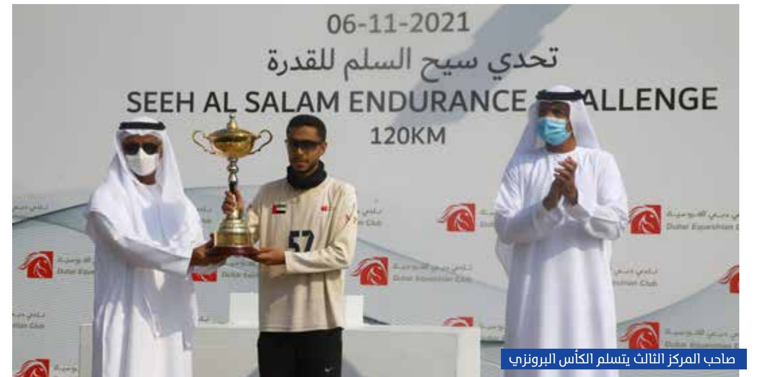
صاحب المركز الثالث يتسلم الكأس البرونزي