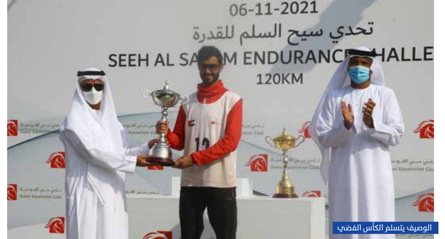
الوصيف يتسلم الكأس الفضي

قادت سمو الشيخة ميثاء بنت محمد بن راشد آل مكتوم، فريق غنتوت «أ» للتتويج بلقب كأس مهرجان «بينك بولو» الخيري للبولو بعد الفوز على غنتوت «ب» 8 - 6 ضمن المهرجان الذي نظمه نادي غنتوت لسباق الخيل والبولو برعاية سمو الشيخ فلاح بن زايد آل نهيان رئيس النادي، على ملاعبه يوم الجمعة 5 نوفمبر 2021 في افتتاح موسمه الجديد، والذي تضمن بجانب المباراة عدداً من الفقرات الترفيهية بمشاركة القيادة العامة لشرطة أبوظبي التي ضمت الفرقة الموسيقية ومديرية المرور والدوريات ووحدة الكلاب البوليسية التي استمتع بها الأطفال، كذلك فقرة إطلاق البالونات الوردية ومشاركة العديد من الفرق الاستعراضية التي استمتع بها الحضور.