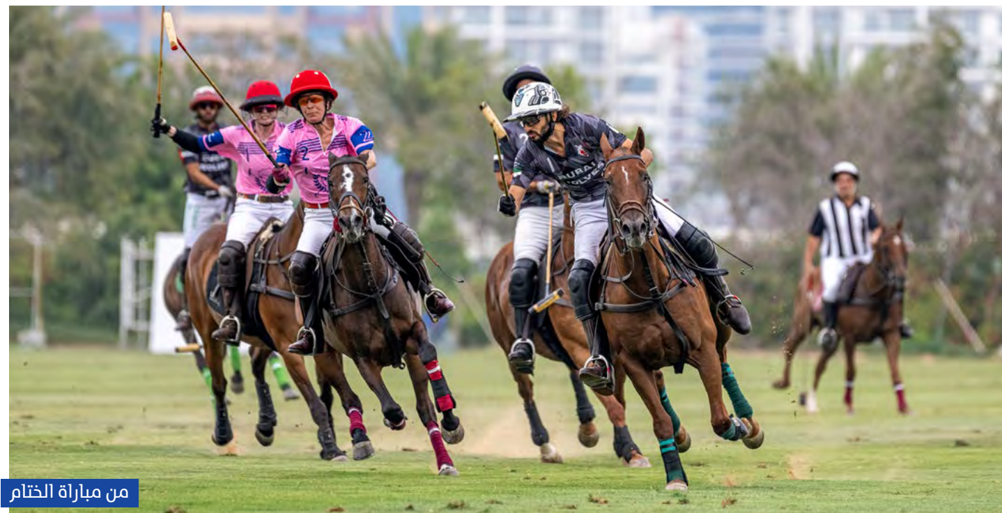
من مباراة الختام