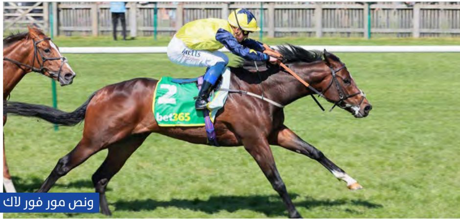
ونص مور فور لاك