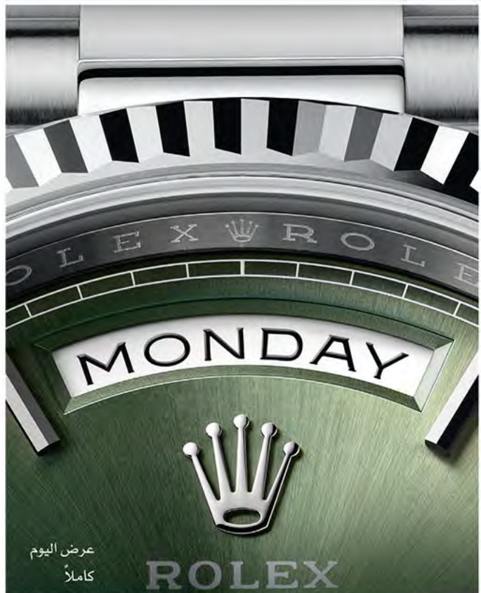
عرض اليوم كاملاً