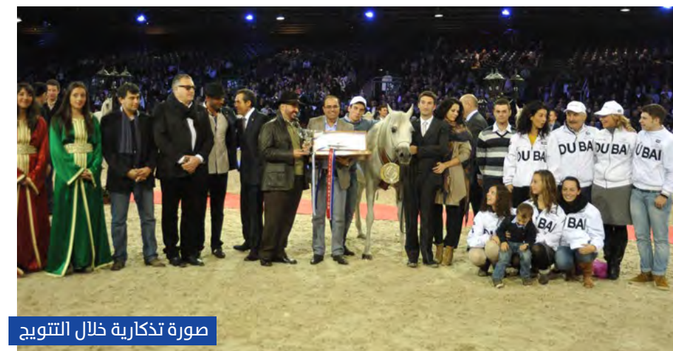
صورة تذكارية خلال التتويج

وضمن مهرجان الشارقة كلباء الرابع للجواد العربي، والذي يقتصر على تنافس المهور والمهرات، جدد مربط دبي عهده مع المركز الأول، وتمكن من إحراز 4 ألقاب توزعت بين لقبين ذهبيين، توشحت بأولهما المهرة دي