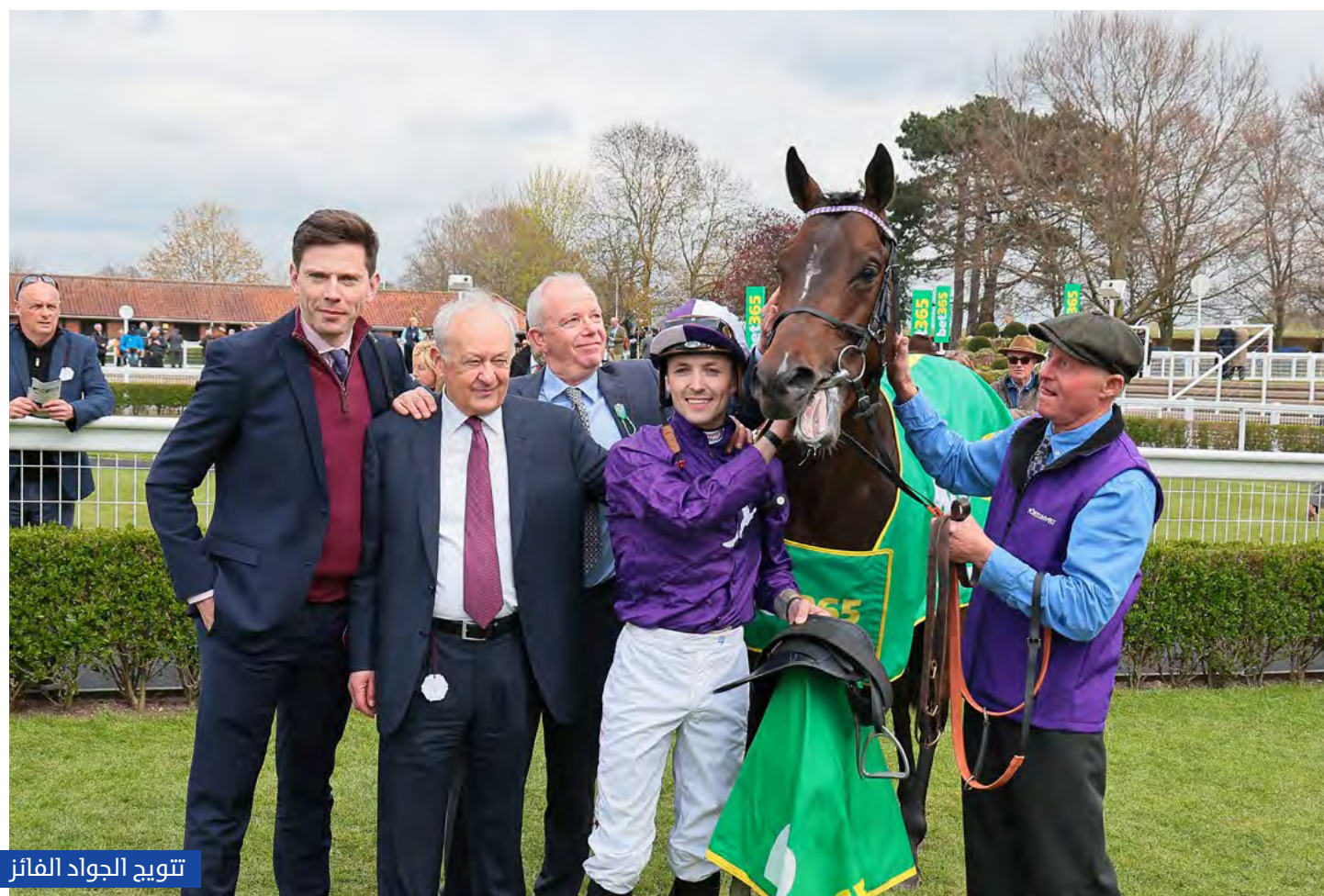
تتويج الجواد الفائز