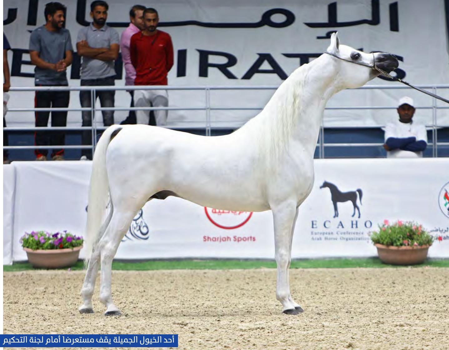
أحد الخيول الجميلة يقف مستعرضا أمام لجنة التحكيم