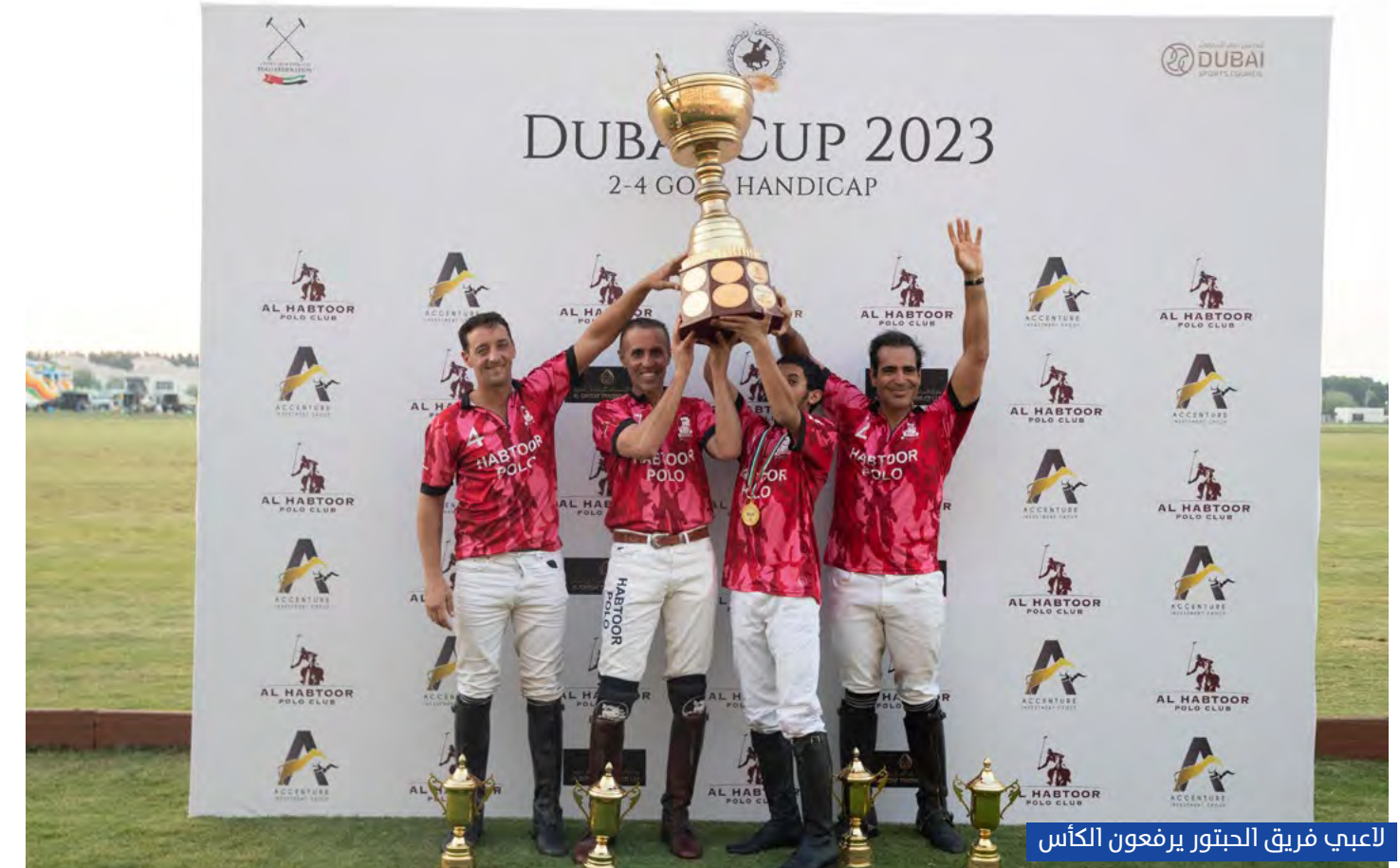
لاعب فريق الحبتور يرفعون الكأس