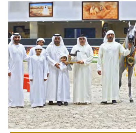
22 ثلاثية ذهبية لمربط دبي بمهرجان الشارقة الدولي للجواد العربي