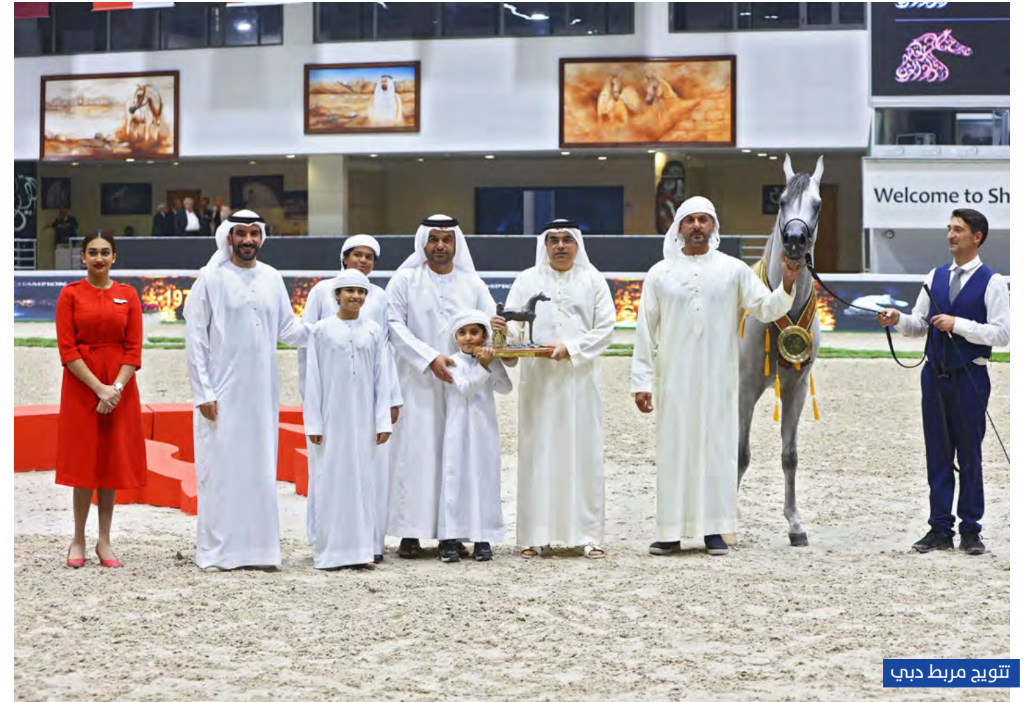
تتويج مربط دبي