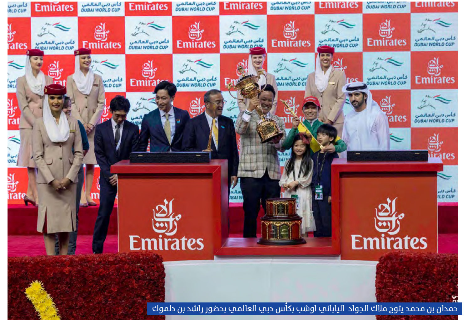
حمدان بن محمد يتوج ملك الجواد الياباني اوشبا بكأس دبي العالمي بحضور راشد بن دلموك

تابعت السباق، وحسم «أوشبا تيسورو» الصراع، الصدارة، إلا أنه لم يكن محظوظاً، فيما جاء في المركز الثالث «أميلم رود» للأمير سعود بن سلمان، و سجل البطل 2:03:26 دقيقة.