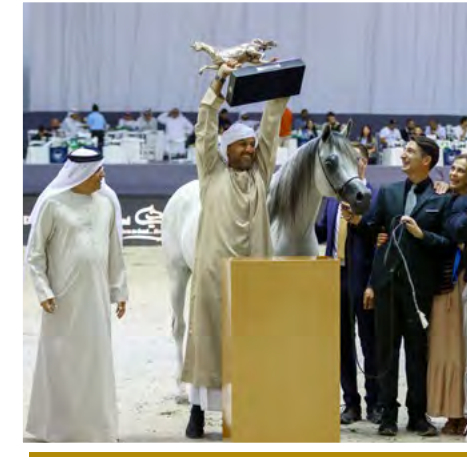
20 خيول مربط دبي تتصدر بطولة دبي الدولية للجواد العربي