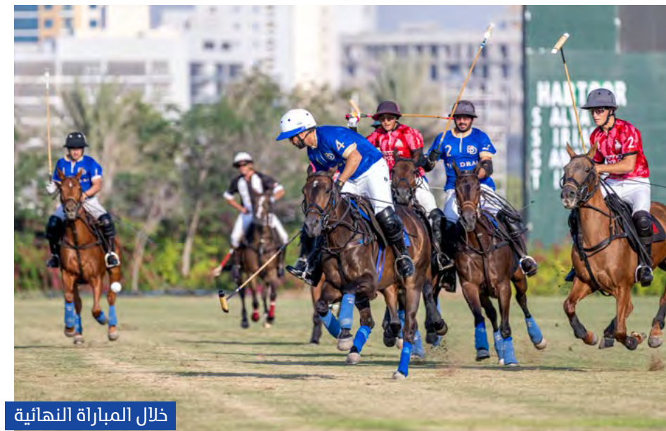
خلال المباراة النهائية

حفلت النسخة الأولى من بطولة كأس «شركاء رمضان 2023»، التي استضافتها ملاعب نادي ومنتجج الحبتور للبولو والفروسية، بمنافسات شيقة ومثيرة، وشارك في البطولة الرضائية التنشيطية أربعة فرق يمثل العنصر المواطن من الشباب معظم أعضاء الفرق الأربعة المشاركة في البطولة التي أقيمت بهانديكاب 8 جول لكل فريق وهي: النسور والأسود والصقور والنمور.