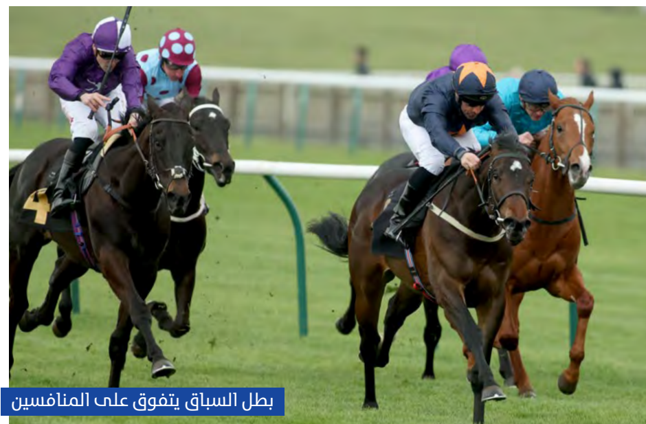
بطل السباق يتفوق على المنافسين

حققت خيول الإمارات ثلاثية خلال مهرجان كريفن، الذي أقيم على مضمار نيوماركت بإنجلترا في لافتر من 18-20 أبريل، توجّ الجواد «إندستركتابل» بلقب الشوط الرئيس كريفن ستيكس للفئة الثالثة لمسافة 1600 متر، الذي يعدّ السباق التحضيري لسباق 2000 جينيز الإنجليزي.