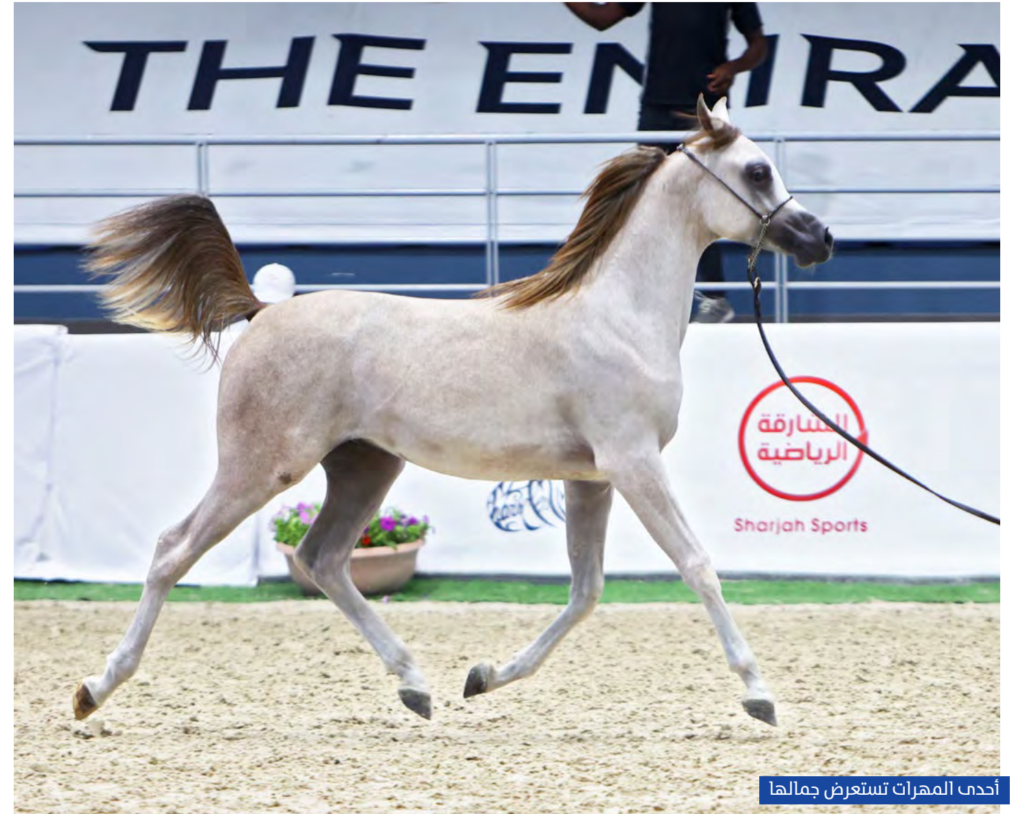
أحدث المهرات تستعرض جمالها