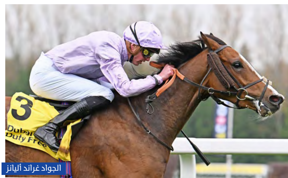
الجواد غراند أليانز

أخفق «ماجيك سنسيت»، الذي كان مرشحاً قوياً للفوز بشوط «سوق دبي الحرة» ستيكس للفئة الثالثة لمسافة 1.400 متر، في مقارعة المهرة «ريماركي» في أول مشاركة لها لهذا الموسم،