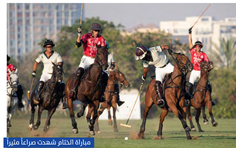
مباراة الختام شهدت صراعاً مثيراً