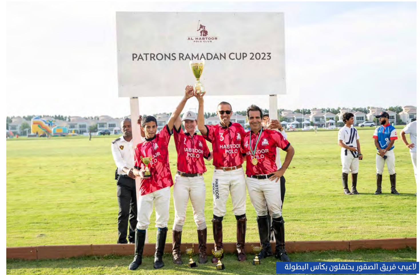
لاعبي فريق الصقور يحتفلون بكأس البطولة