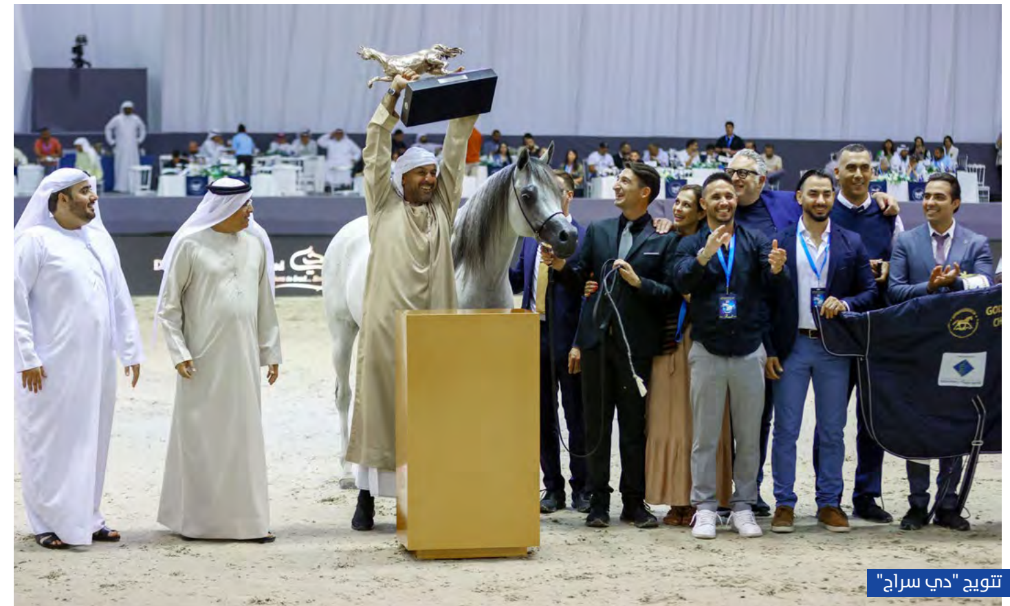
تتويج "دي سراج"

شهدت فعاليات النسخة الـ20 من بطولة دبي الدولية للجواد العربي، التي أقيمت خلال الفترة من 17-19 مارس 2023، بمركز دبي التجاري العالمي، مشاركة نخبة من أبرز الخيول التي تنحدر من أرقى سلالات الخيل في العالم، وأقيمت البطولة برعاية كريمة من صاحب السمو الشيخ محمد بن راشد آل مكتوم نائب رئيس الدولة رئيس مجلس الوزراء حاكم دبي "رعاه الله"، وبلغ عدد الجياد عدد المشاركة في البطولة بجميع فئاتها 151 جواداً، تنافست على إجمالي جوائز مالية بلغت 4 ملايين دولار.