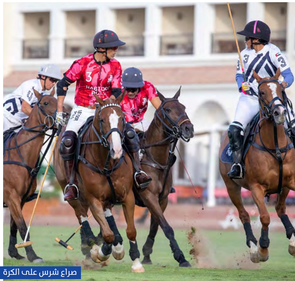
صراع شرس على الكرة

أكد محمد خلف الحبتور رئيس اتحاد الإمارات للبولو أن هذه البطولة تأتي تشيماً لجهود شركاء النجاح وفي مقدمتهم ملاك الفرق ورعاتها والذين أسهموا في إنجاح الموسم الحالي وعرفاناً بما قدموه من دعم مادي ومعنوي للبطولات ولأقرانهم من الشركاء واللاعبين. وأشار الحبتور إلى أن هذا الموسم والذي امتد على مدار 7 شهور شهد نشاطاً ملحوظاً من حيث الكم والنوع وعاشه عشاق هذه الرياضة بأجواء تنافسية