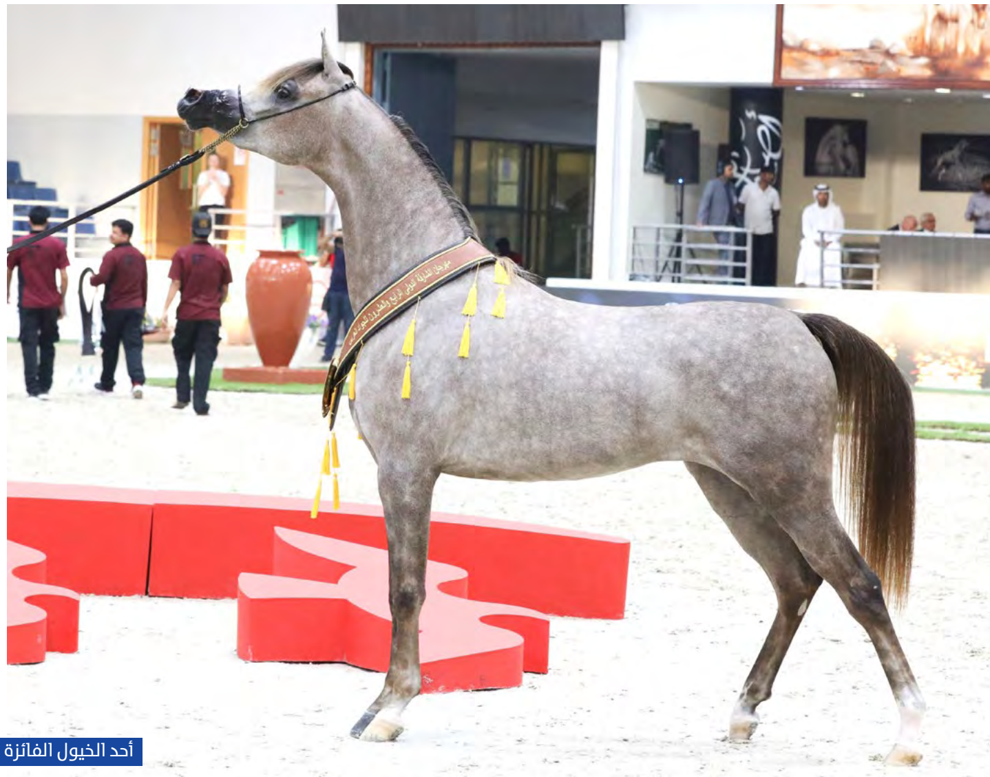
أحد الخيول الفائزة

نال مربط دبي عددا كبيرا من ألقاب الأفضلية العالمية؛ لقب أفضل مزرعة في العالم، ولقب أفضل مالك مربو ومنتج. كما نال لقب أفضل فحل منتج مع العالمي دي سراج ثم لقب أفضل فرس منتجة مع العالمية إف تي شيلا. ونالت المهرة دي نجلاء درع الأمل للخيول الإناث في البطولة. كما حاز مربط دبي لقب أفضل رأس بين