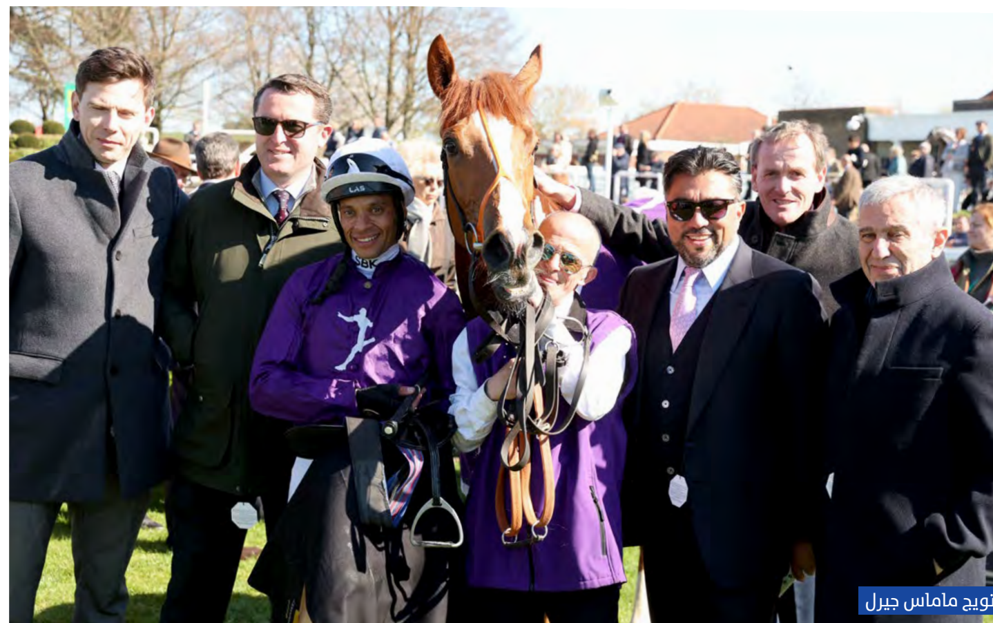
تتويج ماماس جيرل

أطوال عن "كتب" لشادويل بقيادة الفارس جيم كراولي، وإشراف المدرب وليام هاجس. وحل ثالثاً "نيو بيزنس" لسعيد سهيل، بقيادة الفارس أوشين ميرفي، وإشراف المدرب أندرو بالدينج.