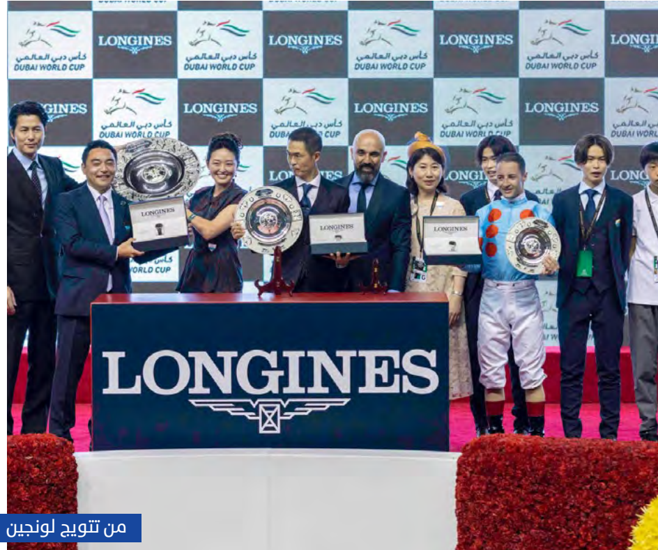
من تتويج لونغين

للسباق المسجل باسم «مشرف» والبالغ 2.26.65 دقيقة، بعد أن سجل زمنًا قدره 2.25.65 دقيقة، وبفارق 3 أطوال ونصف الطول «ويستوفر» لمزرعة جودمونت» بقيادة الفارس ريان مور، وإشراف المدرب رالف بيكيت. وجاء في المركز الثالث «زاجري» لهـ إكوري ألتيميا و جيرارد اوجستين - نورماند»، بقيادة الفارس كريستوف سوميلون، وإشراف المدرب يان باربيروت.