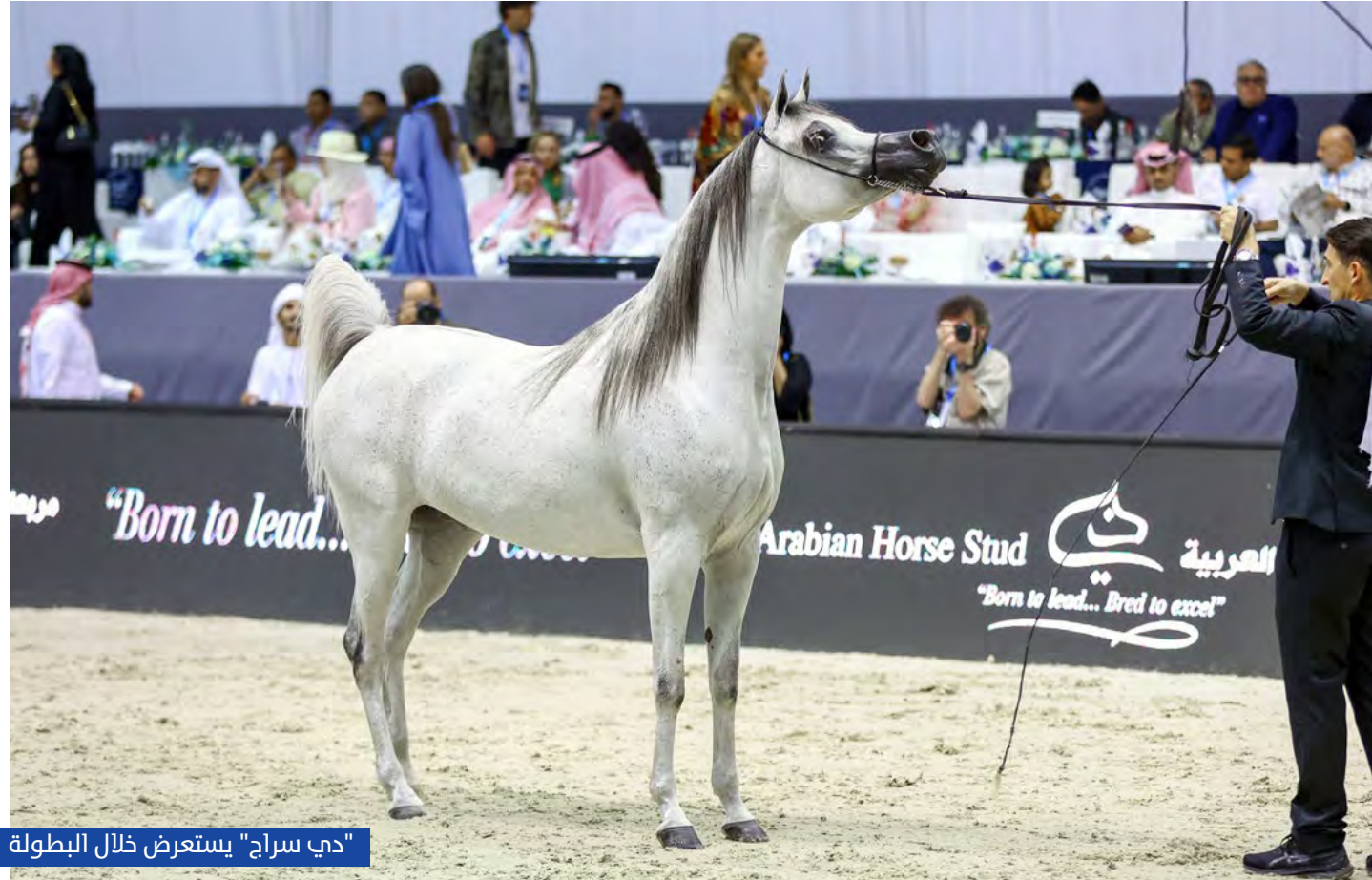
"دي سراج" يستعرض خلال البطولة

أما في بطولة الأفراس، فقد حققت الفرس "دي شيهانه" لمربط دبي للخيول العربية، المركز الأول والميدالية الذهبية، وحصدت جائزة مالية قدرها 275 ألف دولار، فيما حصلت الفرس "بسندرستيموشاييلو" لمربط عجمان، على الميدالية الفضية، وجائزة مالية قدرها 165 ألف دولار،