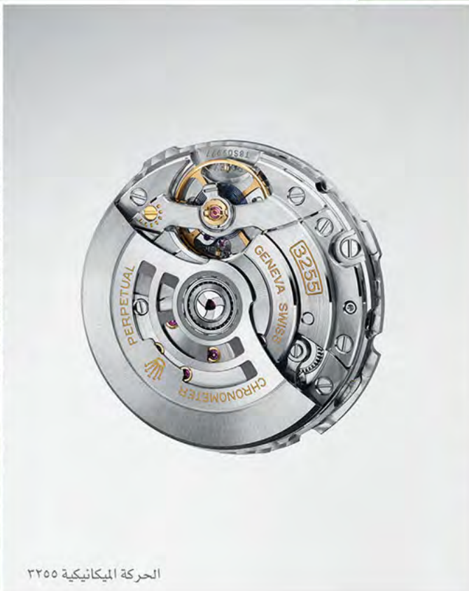
الحركة الميكانيكية ٣٢٥٥