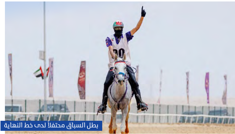
بطل السباق محتفلاً لدى خط النهاية

وحققت إسطبلات المغاوير، ثنائية في المهرجان أبو ظبي