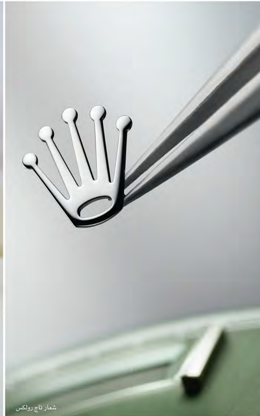
شعار تاج رولكس