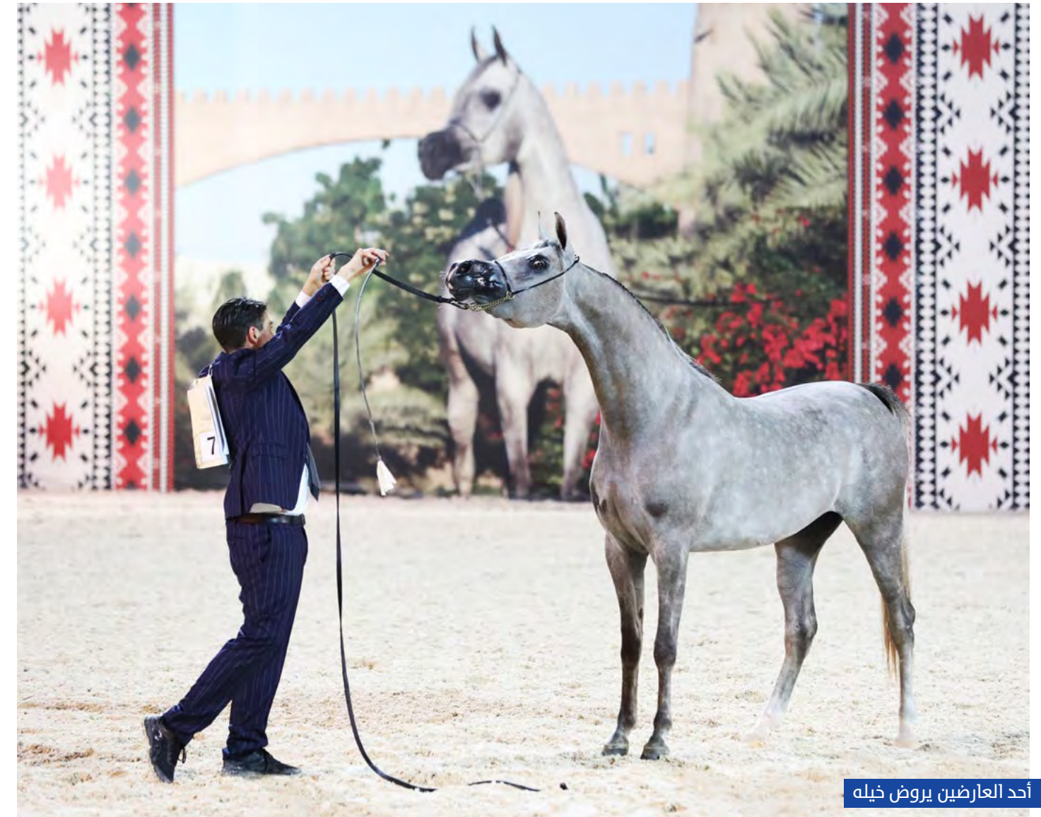
أحد العارضين يروض خيله

بالمملكة المغربية، احتل مربط دبي المركز الأول ولقب أعلى معدل في البطولة، ونال ذهبيتين مع المهرة دي نهب والمهر دي شرط. كما نال الفضة مع الفرس دي ريمة، ونال البرونز مع المهر "اس ام مشهور" المملوك للشيخ سعيد بن جمعة آل مكتوم.