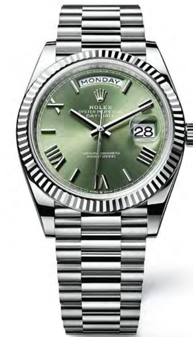
أويستر بريتشوال داي ديت ٤٠ من الذهب الأبيض عيار ١٨ قيراط