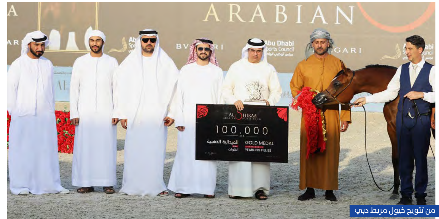
من تتويج خيول مربط دبي

في البطولات الأربع، كما أحرز فضية وبرونزيتين.