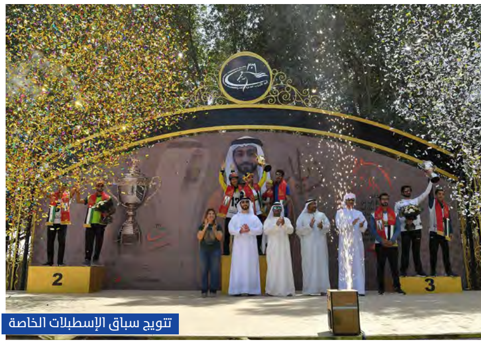
تتويج سباق الإسطبلات الخاصة