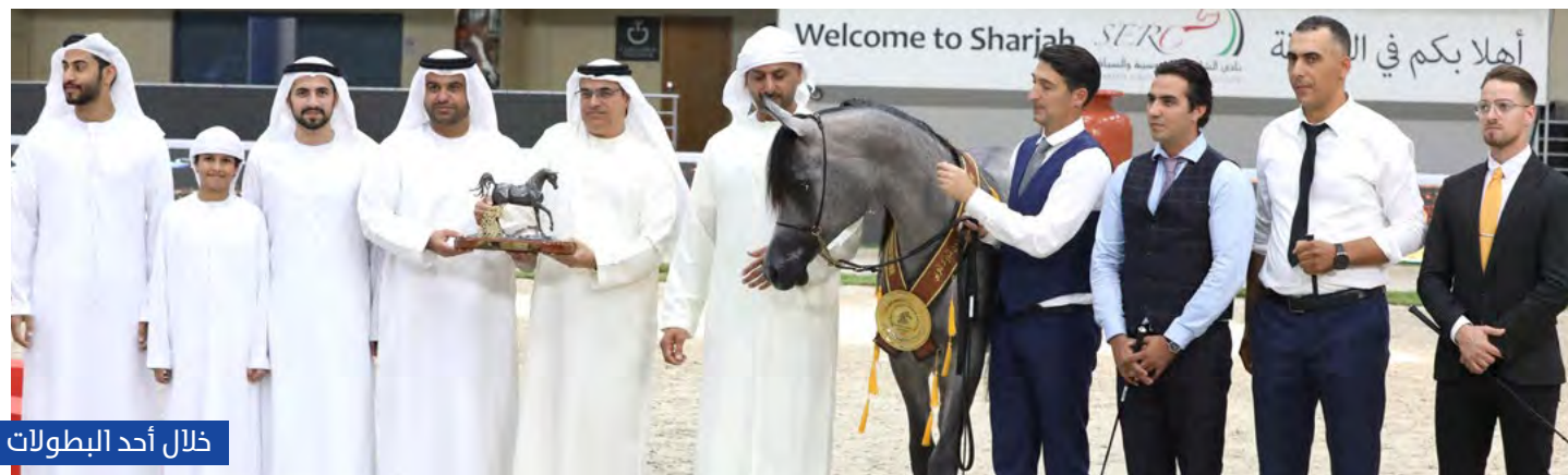
ذلال أحد البطولات

نال الذهب كل من المهرة دي أسرة والفرس دي شيهانة والمهر دي شهر والفحل العالمي دي سراج. ونال الفضة المهر دي فاهر. كما نال هاتريك برونزي أكمل الإنجاز القياسي في تاريخ البطولة، وذلك مع كل من المهر دي شرط والمهرة دي شيخة والمهرة دي رسيل.