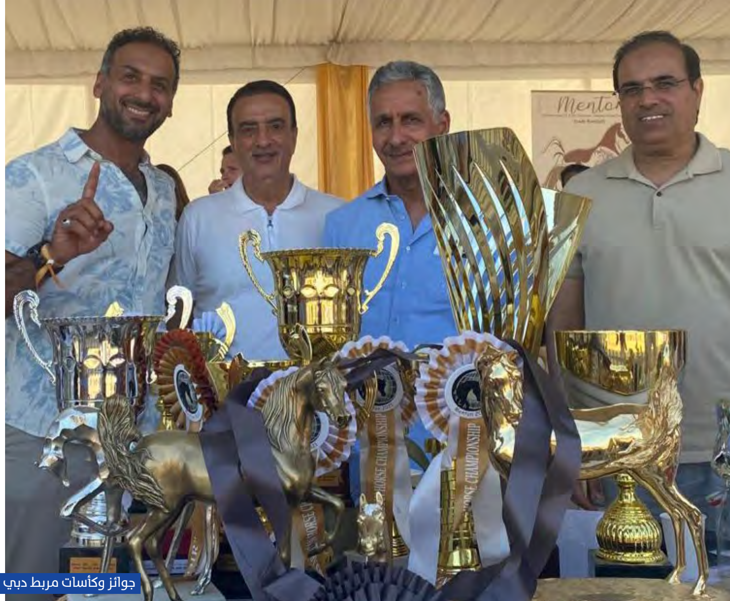
جوائز وكأسات مربط دبي