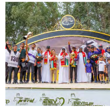
30 ثنائية لإسطلات المغاوير في مهرجان أبوظبي للقدرة