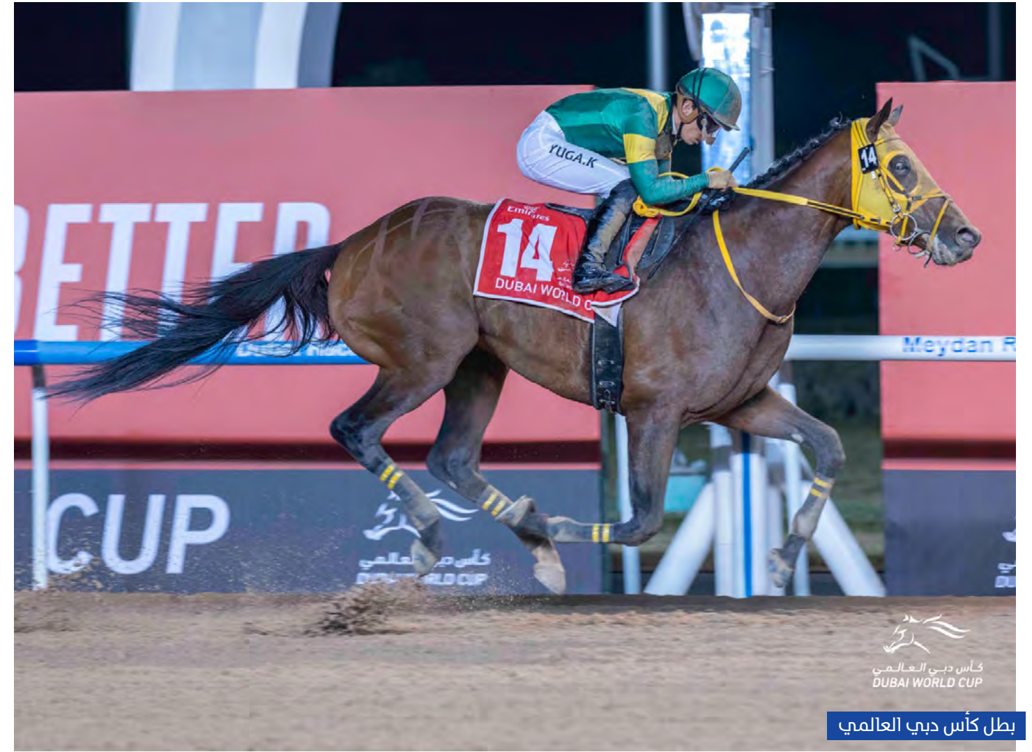
بطل كأس دبي العالمي

ليصبح بذلك أول بطل يصل إلى هذا الإنجاز الكبير، بقيادة الفارس فرانكي ديتوري وإشراف المدرب جون وتادي جوسدن، مسجلاً زمنًا قدره 1:47:39 دقيقة، وبفارق ثلاثة أرباع الطول عن «دانون بيلوجا» لهـ شركة دانوكس»، بقيادة الفارس جواو موريرا وإشراف المدرب نوري يوكي هوري. وجاء في المركز الثالث «فيشنس برايد» لجودلفين، بقيادة الفارس وليام بيوك وإشراف المدرب شارلي ألبلي.