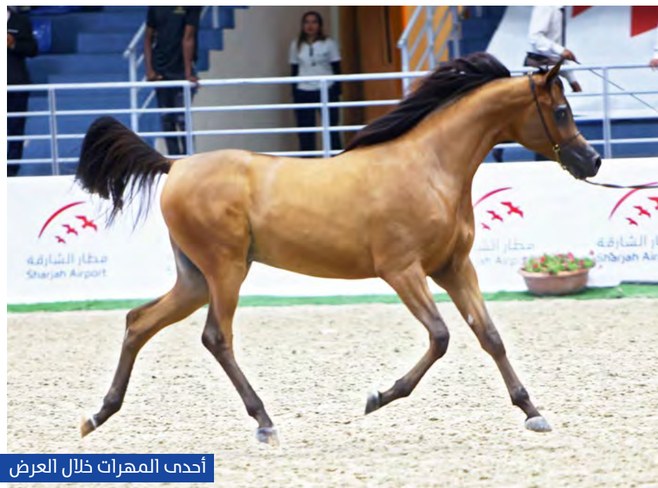
أحدث المهرات خلال العرض

دي فنانة" لمربط دبي، فيما حصلت على البرونز "جارين الزبير" لمربط الزبير.