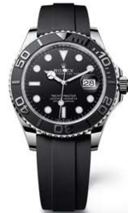
أويستر برينشوال يخت ماستر ٤٢ من الذهب الأبيض عيار ١٨ قيراط