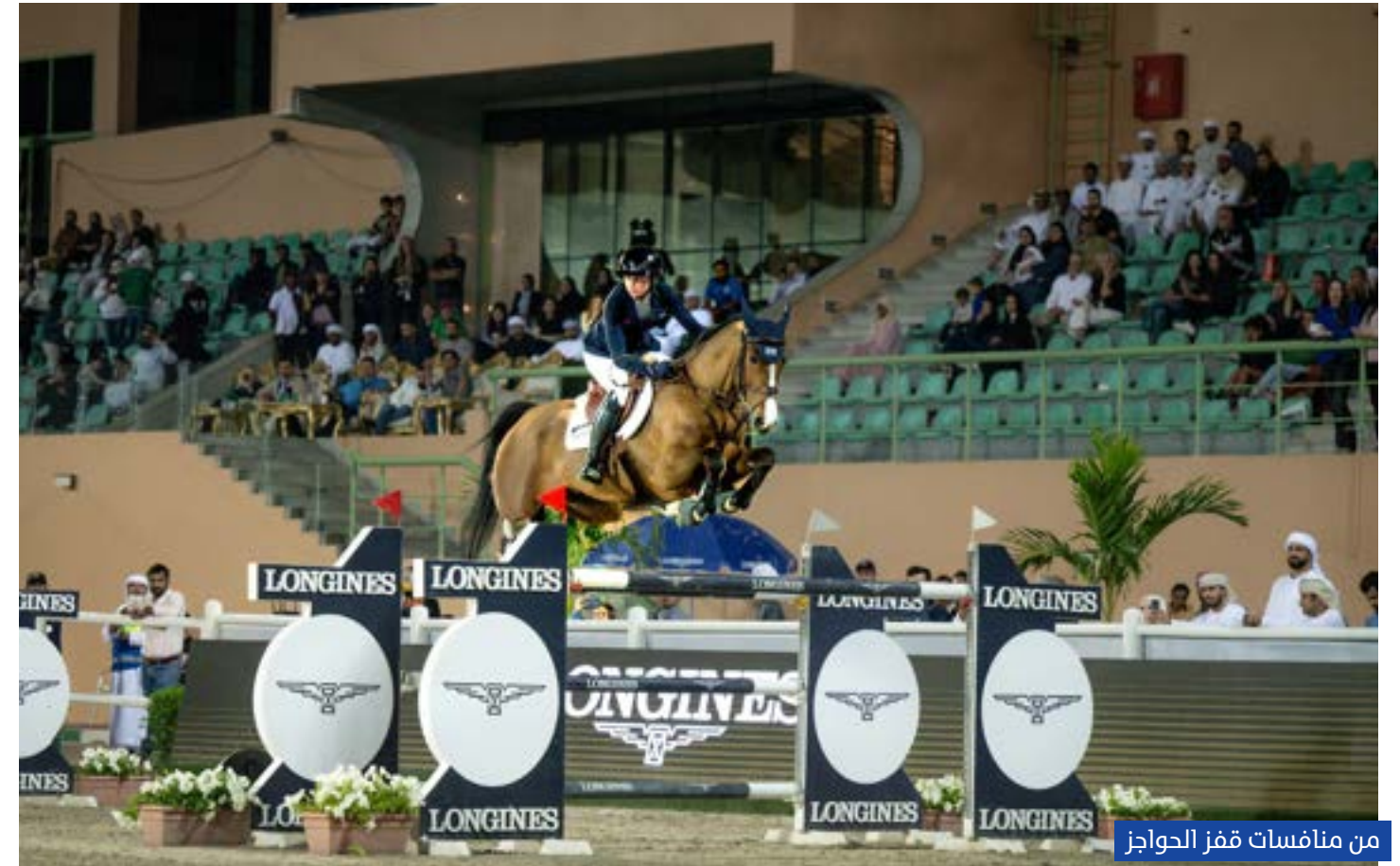
من منافسات قفز الحواجز

البطولات خلال تنظيمها نحو 6 سنوات سابقة بنادي الشارقة للفروسية، وفي الأكاديمية خلال العطلات الصيفية، بجانب الشغف الكبير بالمشاركة فيها من فئتي الذكور والإناث.