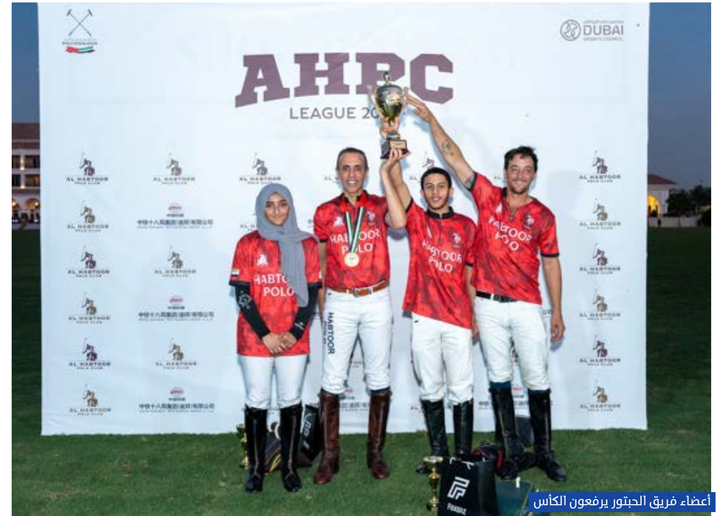
أعضاء فريق الحبتور يرفعون الكأس