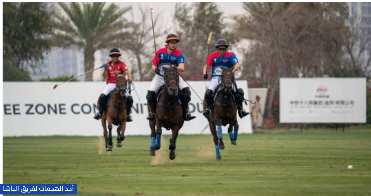
أحد الهجمات لفريق الباشا