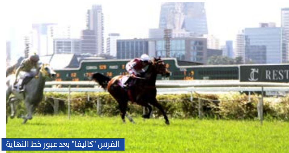
الفرس "كاليفا" بعد عبور خط النهاية

وانطلق "آر جي كاليفا" من البوابة العاشرة في السباق الذي أقيم على المضمار العشبى لمسافة 1200 متر بمشاركة 10 أمهار ومهترات في عمر 3 سنوات فما فوق. وهيمن "آر جي كاليفا" 5 سنوات على السباق وتقدم بثبات في جميع مراحل وصولاً إلى خط النهاية محققاً 1:22:44 دقيقة بفارق 0.75 طول، وسط منافسة قوية من أوليكا راش، الثاني في الترتيب بقيادة جبرائيل