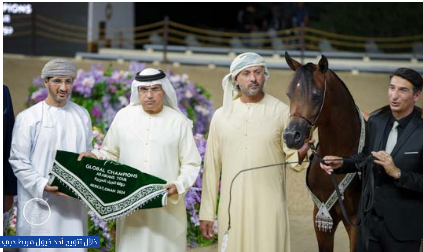
خلال تتويج أحد خيول مربط دبي

أما ثنائية مربط عجمان (ذهبية وفضية) فقد جاءت عن طريق الفرس الرائعة "ع ج كايا" التي توشحت بذهبية الأفراس، فيما حقق الفحل "ع ج كفو" اللقب البرونزي في بطولة الفحول.