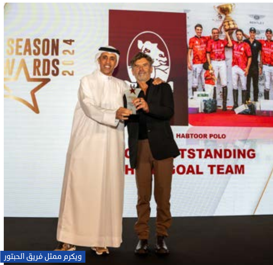
ويكرم ممثل فريق الحبتور

وقال الحبتور: «نتطلع إلى إيجاد قاعدة عريضة من