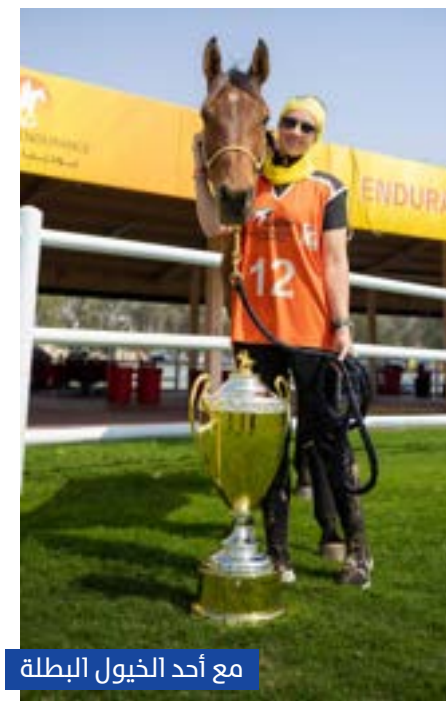
مع أحد الخيول البطلة

الفرصة لأقدم كل ما لدي من طاقة وجهد وتركيز في مجال القدرة التي تعتمد على فهم الفارس للخيل والتناغم معه ومن ثم تنفيذ تعليمات المدرّب خلال مجريات السباق"