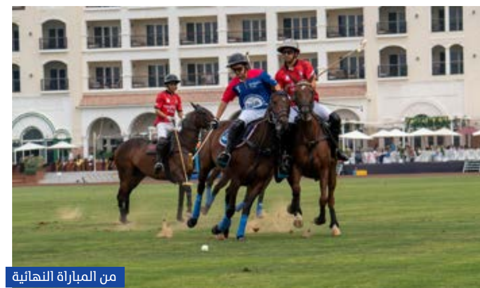
من المباراة النهائية

على الرغم من فارق الثلاثة أهداف بين الفريقين، لم يستسلم فريق الباشا وتمكن من تقليص الفارق ليبقي