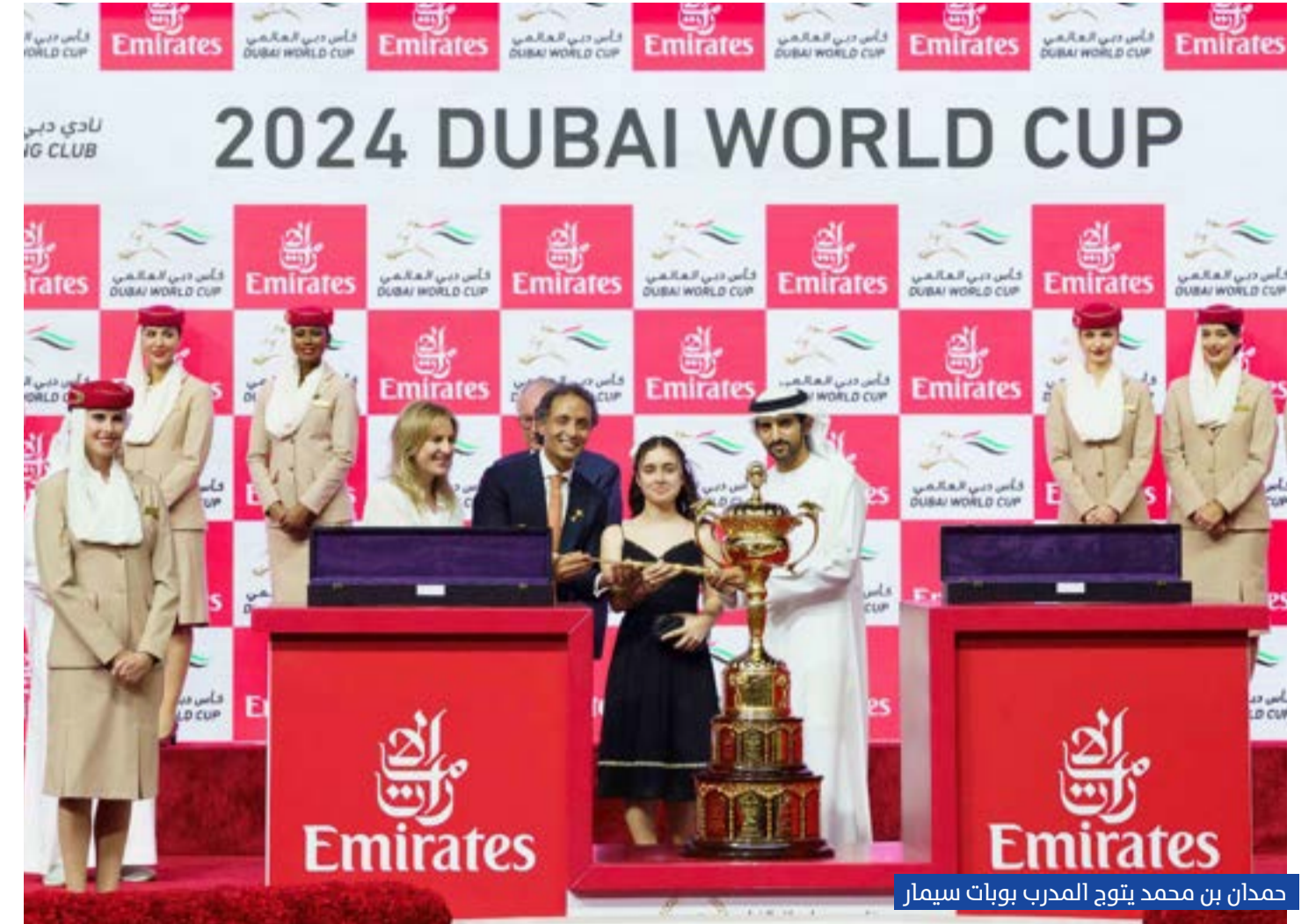
حمدان بن محمد يتوج المدرب بوبات سيمار

المدرّب شارلي أبلي، مسجلاً زمناً قدره 2:26.72 دقيقة وبفارق طولين عن «شهرار» لشركة صنداي للسباقات، بقيادة الفارس هيدياكي فوجيوارا. وجاءت في المركز الثالث «ليبيرتي بوجا كواجو وإشراف المدرب ميتسوماسا ناكوشيديا».