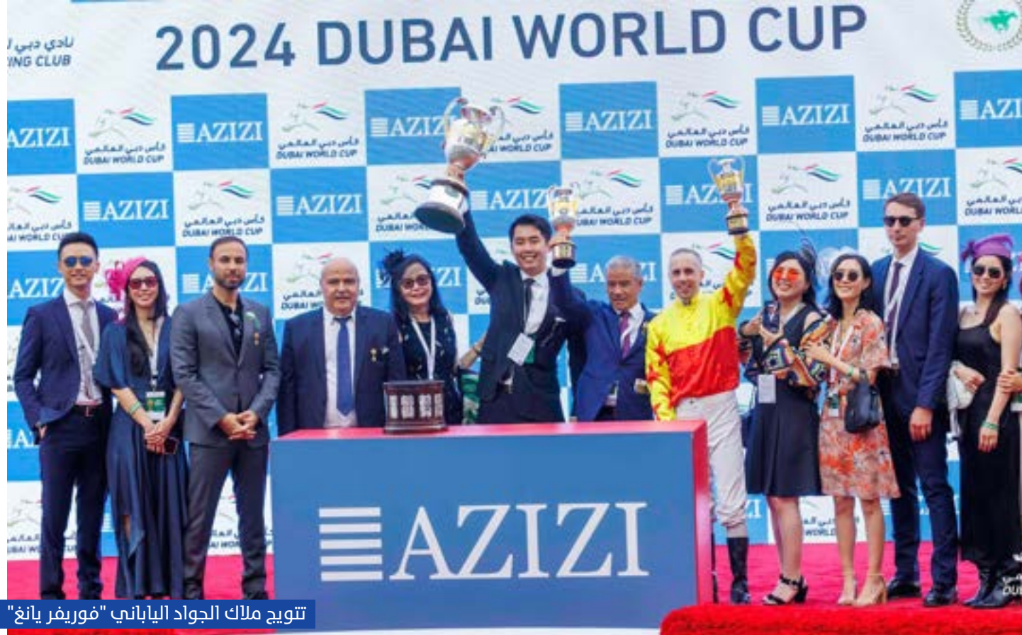
تتويج ملك الجواد الياباني "فوريفر يانغ"