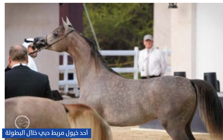
أحد خيول مربط دبي خلال البطولة

واستهلت حصيلة مربط دبي المهرة بعمر السنة "دي