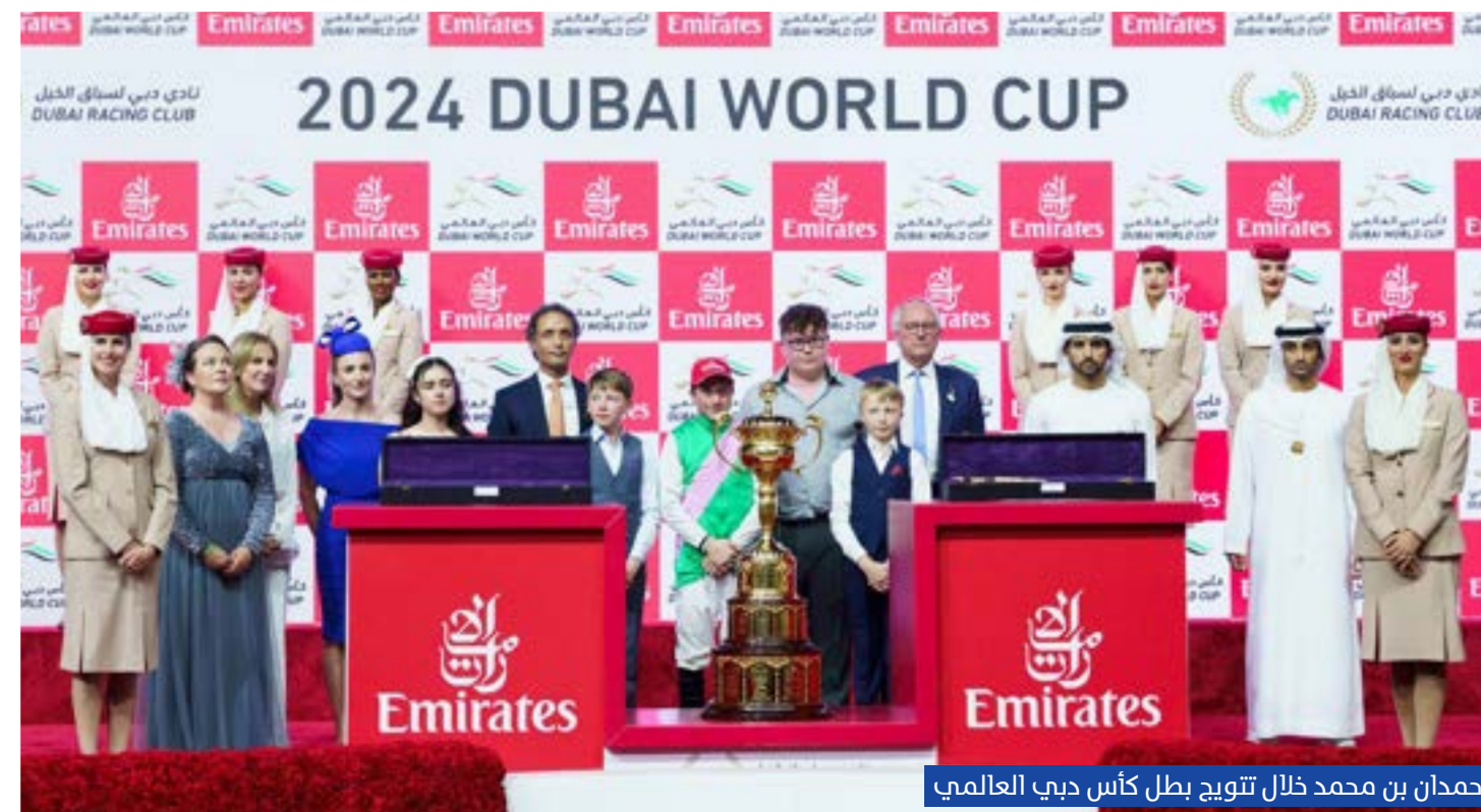
حمدان بن محمد خلال تتويج بطل كأس دبي العالمي

المملوك لشركة ريو توكوجي كنجي القابضة، بإشراف المدرب نوبورو تاكاجي وقيادة الفارس يوجا كوادا، في المركز الثاني، ليحصل على جائزة مالية قدرها 2.4 مليون دولار.