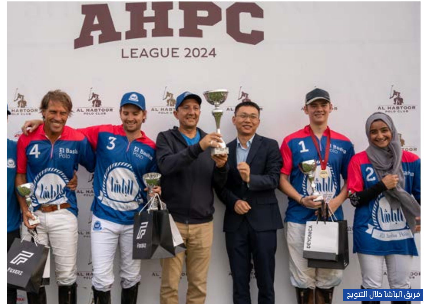
فريق الباشا خلال التتويج

على أماله قائمة خلال المباراة، بينما ركن فريق الحبتور، والأخيرة أضاف سانتوس أريارتي وخوستو كوينتو هدفين كانا كفيلاً لمعادلة النتيجة 4-4، ويبدأ التوتو