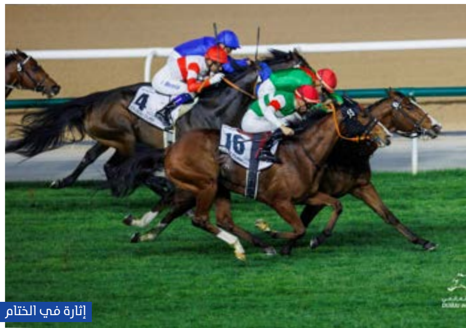
إثارة في الختام