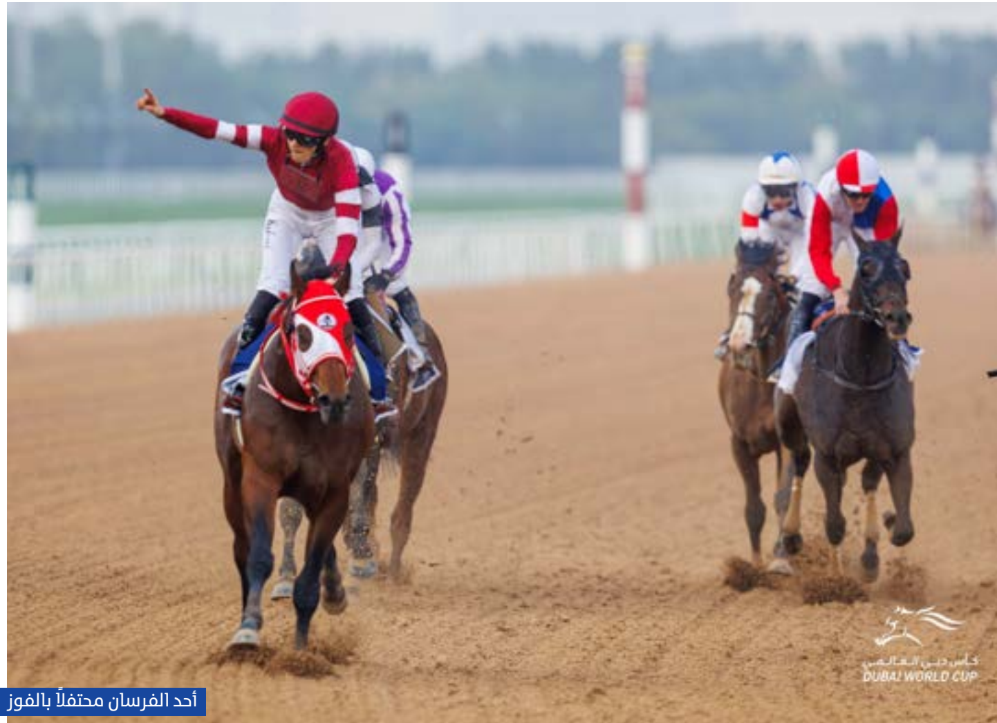
أحد الفرسان محتفلاً بالفوز