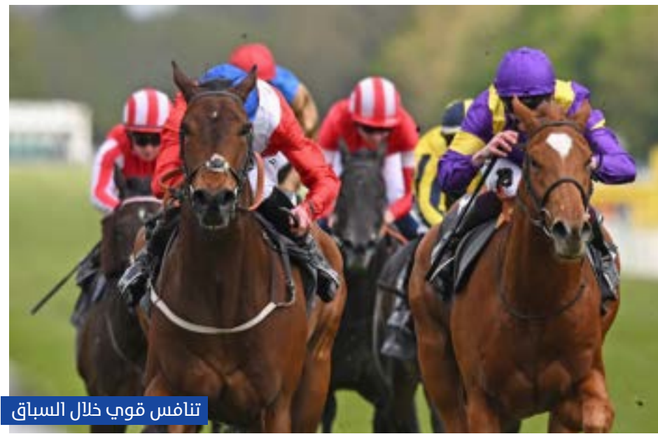
تنافس قوي خلال السباق

وقال وليام بيوك، الفارس البارز لدى اسطبلات جودلفين: "أتوقع منه الكثير في المستقبل، كانت هذه المشاركة هي الثانية له فقط، بعد ظهوره الأول على مضمار "ساوزويل" (حقق مركز الوصيف في سباق بست ريسينغ أودس)."