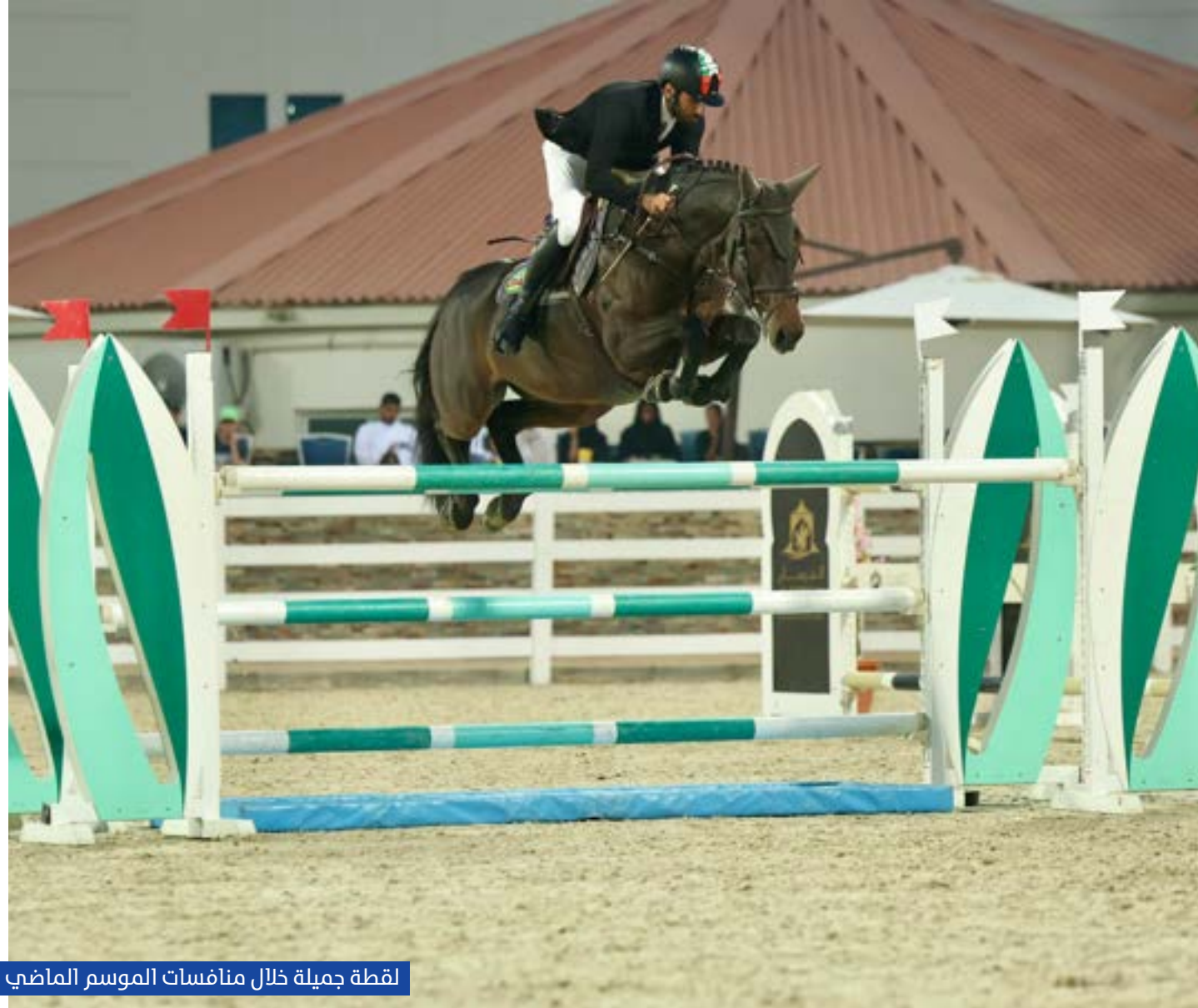
لقطة جميلة خلال منافسات الموسم الماضي