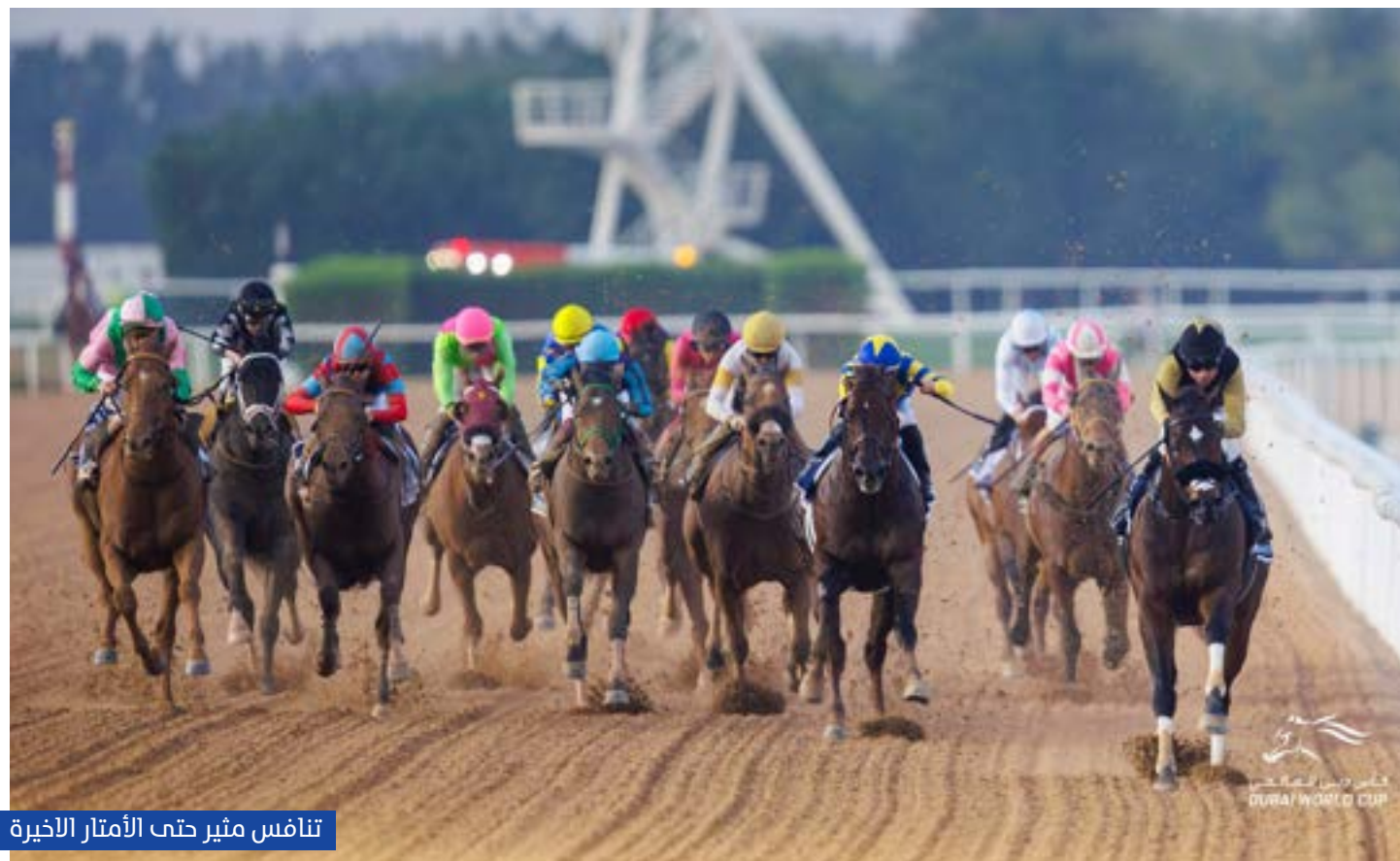
تتافس مثير حتى الأمتار الأخيرة