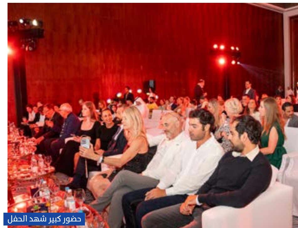
حضور كبير شهد الحفل

أقام نادي الحبتور للبولو والفروسية حفله السنوي الختامي للموسم "2023-2024"، بحضور محمد خلف الحبتور رئيس اتحاد البولو، رئيس اللجنة المنظمة لسلسلة بطولات كأس دبي الذهبية، ورجال أنشطة الموسم والفائزين بالبطولات والألقاب من ممارسي البولو والفروسية «قفز الحواجز والترويض ومدرسة ركوب الخيل»، وجاء الحفل معبراً عن المكاسب والنجاحات هذا الموسم.