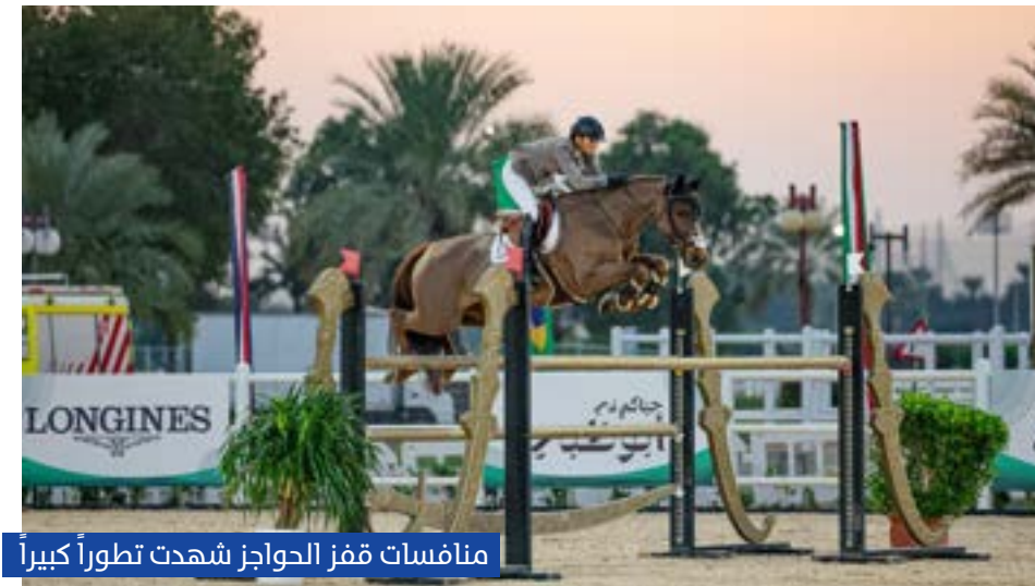
منافسات قفز الحواجز شهدت تطوراً كبيراً

كما قررت انطلاق أول فعالية لقفز الحواجز بالموسم الجديد في أكتوبر المقبل، وتنظيم 14 بطولة للقفز في