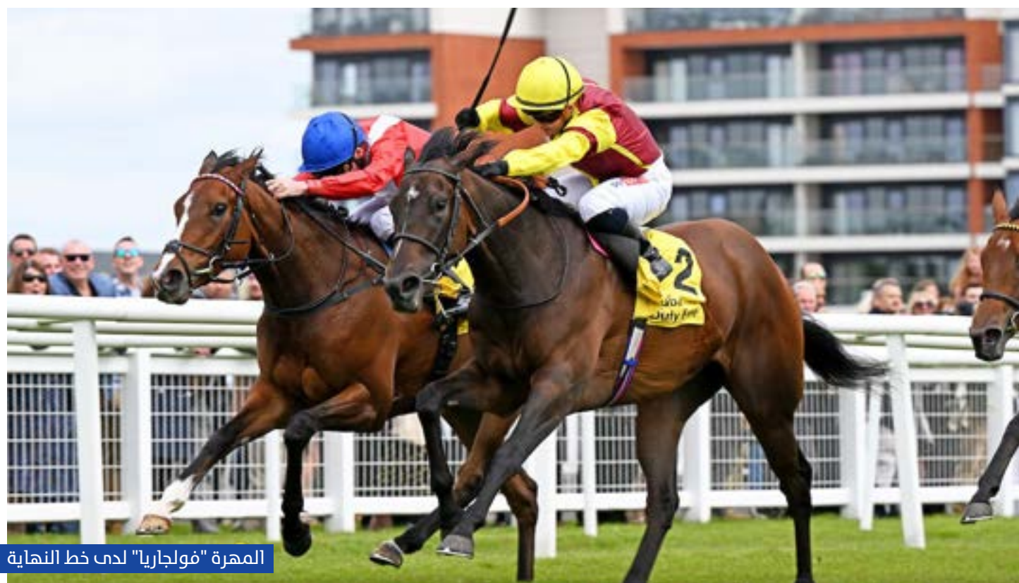
المهرة "فولجارجيا" لدى خط النهاية

ممتعة، تساعدنا على تعزيز انتشار علامتنا التجارية حول العالم. وسنمضي قدماً في دعم أهم الأحداث الرياضية هذا الموسم، والتي تسهم في ترسيخ مكانة سوق دبي الحرة كوجهة عالمية رائدة لتجزئة السفر.