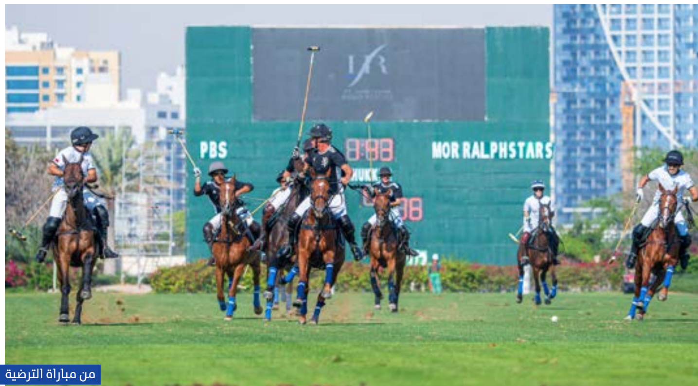
من مباراة الترضية