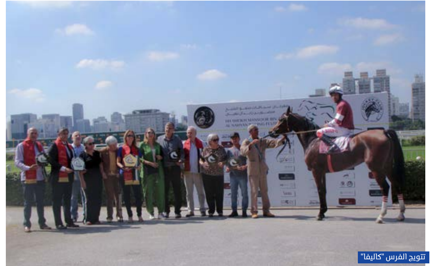
تتويج الفرس "كاليفا"