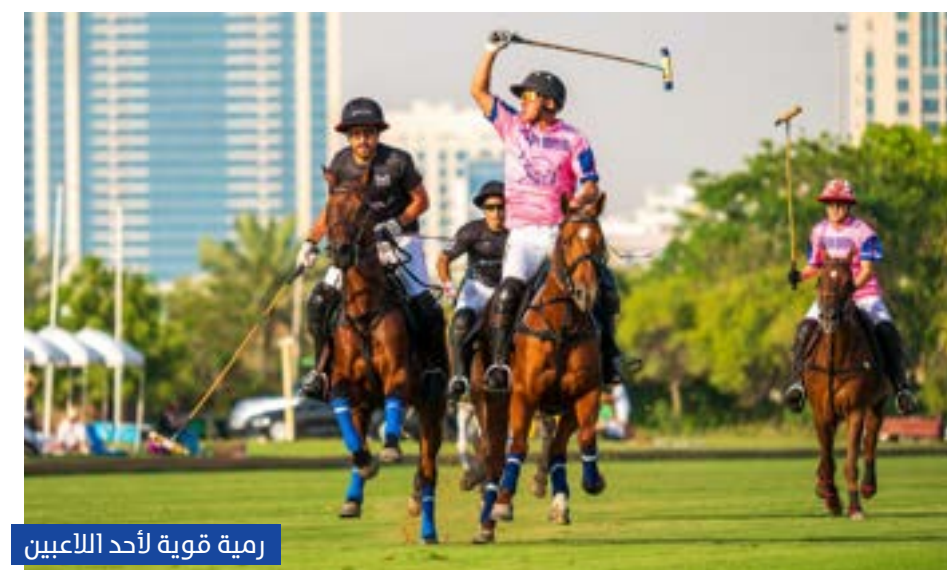
رمية قوية لأحد اللاعبين

انتزع فريق الحبتور لقب كأس «أبريل للبولو»، بعد فوزه على فريق ذئاب دبي به الهدف الذهبي، في المباراة النهائية التي جرت بملعب نادي الحبتور للبولو والفروسية، في ختام بطولات الموسم، وجاء النهائي قويا، بعدما انتهت المباراة بالتعادل 4-4، وخطف «الحبتور» اللقب في الشوط الإضافي به الهدف الذهبي، فيما فاز «مور رالف ستارز» بكأس الترضية، بعد تغلبه على «بي بي إس هيسك» 4-1.