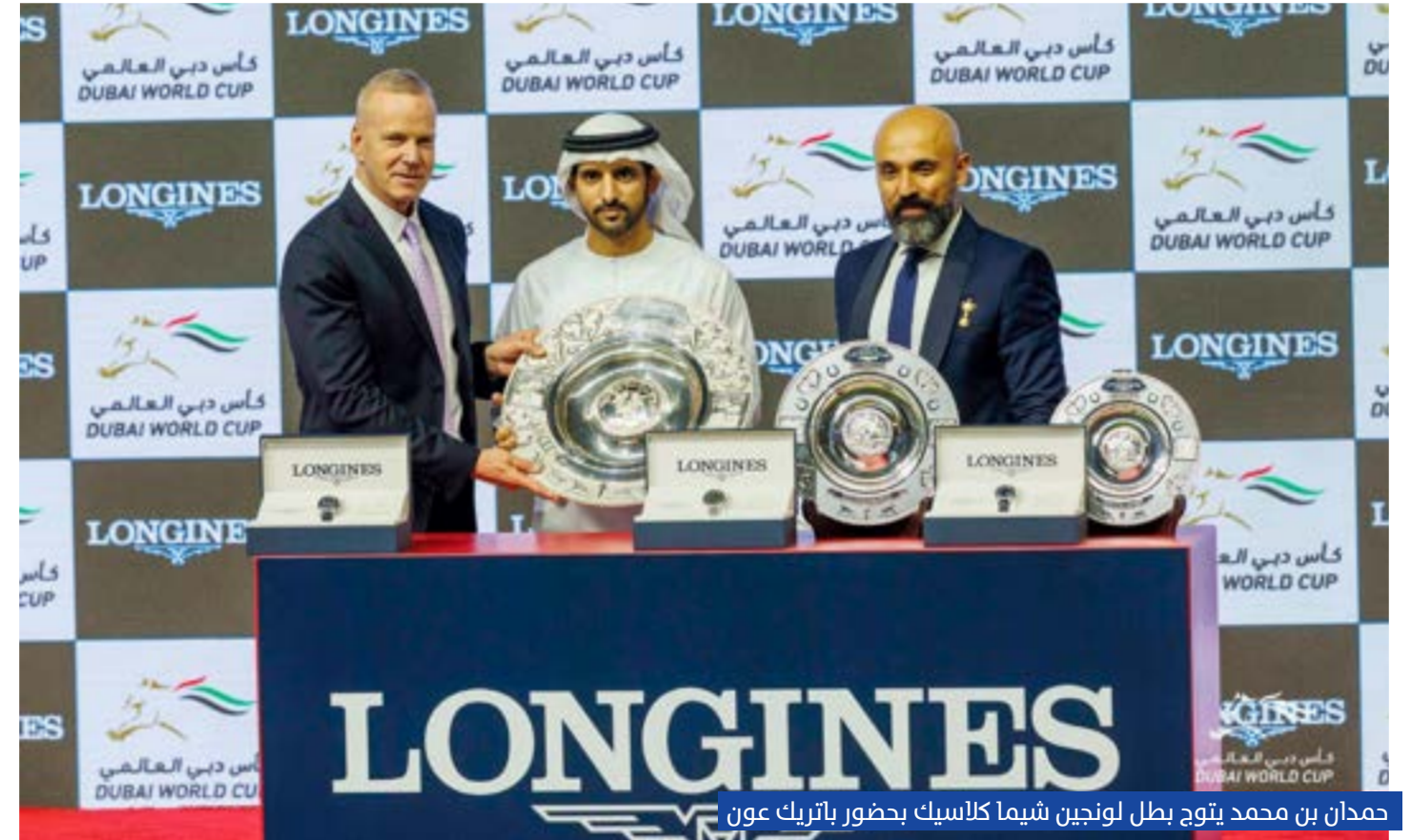
حمدان بن محمد يتوج بطل لونغين شيما كلاسيك بحضور باتريك عون

«دبي جولدن شاهين» لمسافة 1200 متر «الفئة الأولى» «رملي» برعاية «نخيل» البالغة قيمة جوائزه 2 مليون دولار، بقيادة الفارس تاغ أوشي وإشراف المدرب بويات سيمار، مسجلاً زمناً قدره 1:10.19 دقيقة ويفارق 6 أطوال ونصف الطول عن «دون فرانكي» لماكوتو هايانو، بقيادة الفارس كريستيان ديمورو، وإشراف المدرب تاكاشي سايتو، وحل في المركز الثالث «ناكاتومي» لفترياني هاي وقطر للسباقات، بقيادة الفارس جيمي سبنسر، وإشراف المدرب ويسلي وارد.