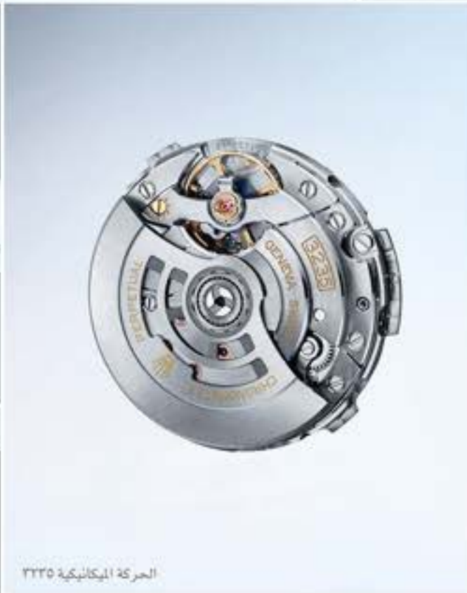
الحركة الميكانيكية ٣٢٣٥