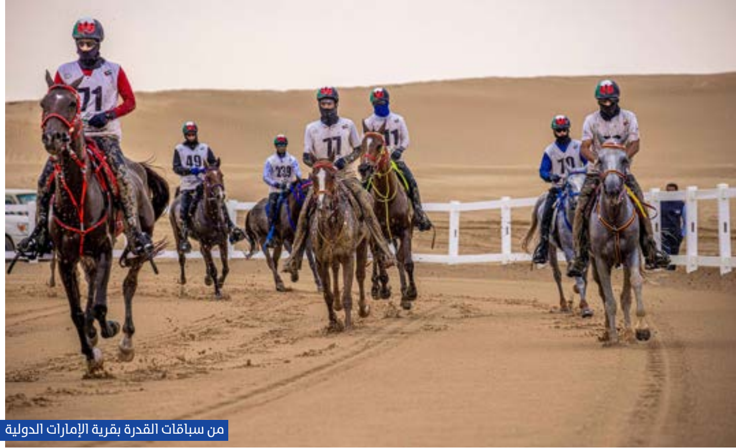
من سباقات القدرة بقرية الإمارات الدولية

وعلمياً، من خلال تقديم معلومات متكاملة عبر خبراء من أصحاب الخبرة الطويلة في تخصصاتهم لإثراء النقاشات وترسيخ المفاهيم الحديثة لصناعة الخيل.