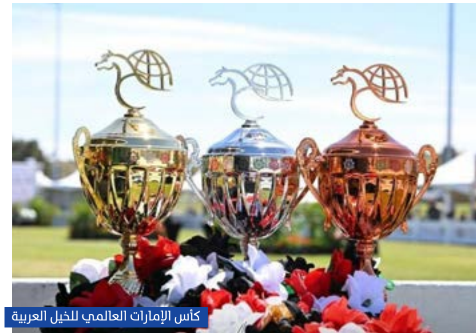
كأس الإمارات العالمي للخيل العربية

شهدت مدينة سكوتسدیل بولاية أريزونا الأميركية البطولة الثالثة لكأس الإمارات العالمي لجمال الخيل العربية، والتي أقيمت ضمن (كأس العالم للمربين) أعرق بطولات جمال الخيل العربية منذ العام 1955.