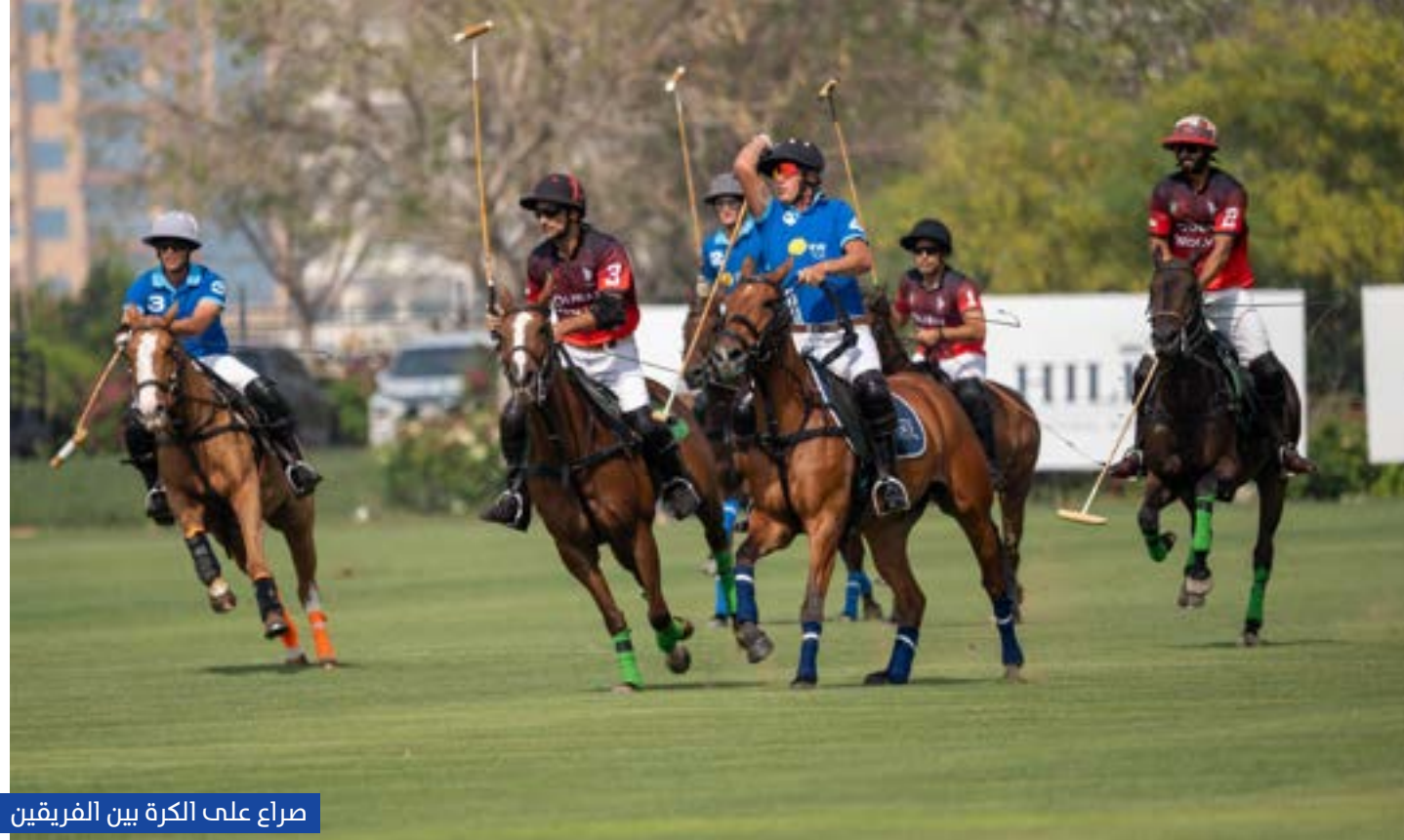
صراع على الكرة بين الفريقين

قدم هوانغ شيانين مدير المشروعات في شركة السكن الحديدية الصينية الجوائز للفرق وأصحاب الألقاب.