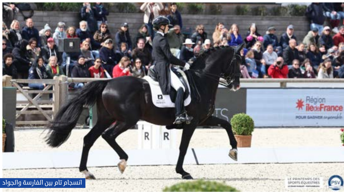
انسجام تام بين الفارسة والجواد