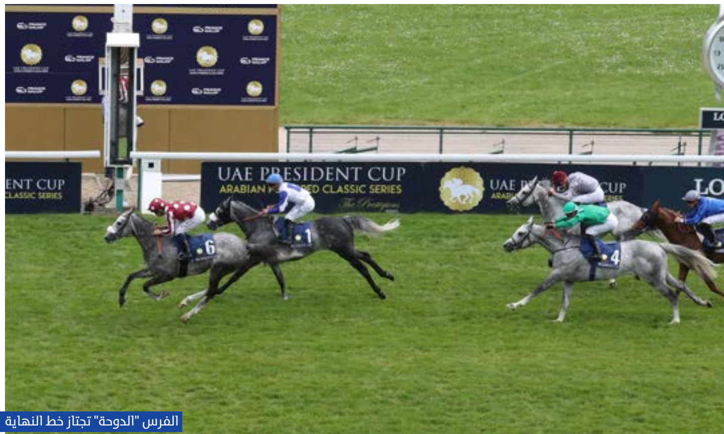
الفرس "الدوحة" تجتاز خط النهاية

قبل الهيئة العليا لسباقات الخيل الفرنسية ( فرانس جالوب)، ما يؤكد عمق علاقات الصداقة والشراكة بين الإمارات وفرنسا.