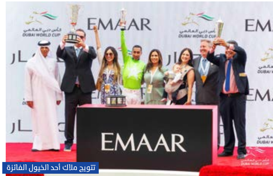
تتويج ملك أحد الخيول الفائزة