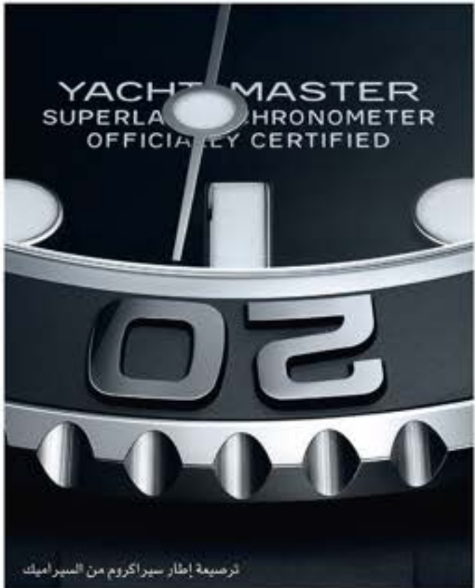
لرصيعة إطار سيراكروم من السيراميك