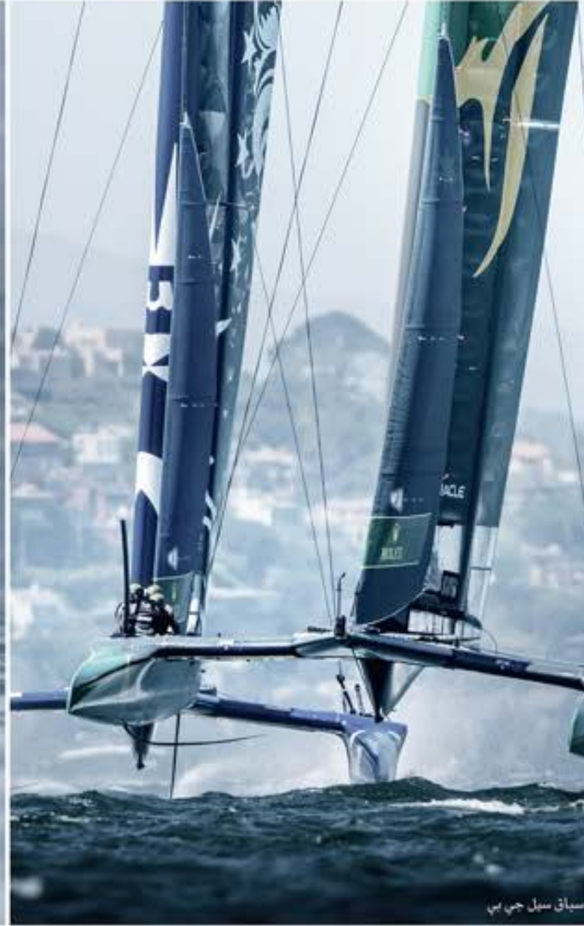
سباق سبيل جي بي