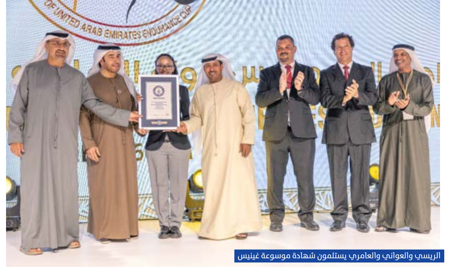
الرئيسي والعوامري يستلمون شهادة موسوعة غينيس

التدريب الطبي المستمر لرفع كفاءة مقدمي خدمات الرعاية البيطرية في كافة التخصصات والمجالات الطبية، بالتعاون مع المتخصصين في المجالات الطبية المختلفة من خلال وسائل مختلفة منها ورش عمل وندوات حضورية.