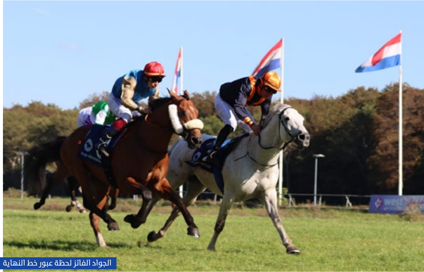
الجواد الفائز لحظة عبور خط النهاية