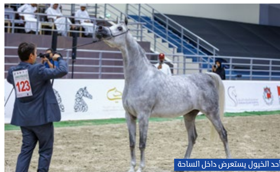
أحد الخيول يستعرض داخل الساحة

وقال التوحيدي: "من ناقل القول أن قضية الإنتاج المحلي في مشروع مربط دبي قضية جوهرية منذ الإشارة السامية لصاحب لفارس العرب والعالم صاحب السمو الشيخ محمد بن راشد آل مكتوم، بأن يكون الإنتاج المحلي للخيول العربية الأصيلة رهانا استراتيجيا، في الوقت الذي منح سموه هذه القضية كل الإمكانيات لتحقيق أهدافها النبيلة التي تحققت فعلا في موطنها. إنتاجنا المحلي كان تصورا طموحا ثم أصبح حقيقة عالمية".