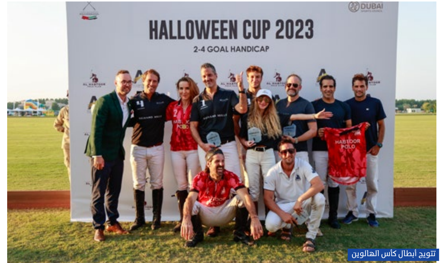
تتويج أبطال كأس الهالوين