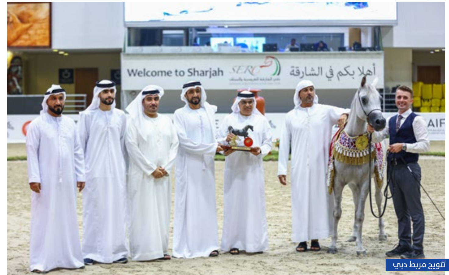
تتويج مربط دبي

عمر 2 و 3 سنوات، فيما نال المركز الثاني واللقب الفضي "الأريام برجس" لاسطبلات الأريام، وحل في المركز الثالث وحصل على البرونز "شعلان الزبير" للشيخ عبد الله بن محمد آل ثاني.