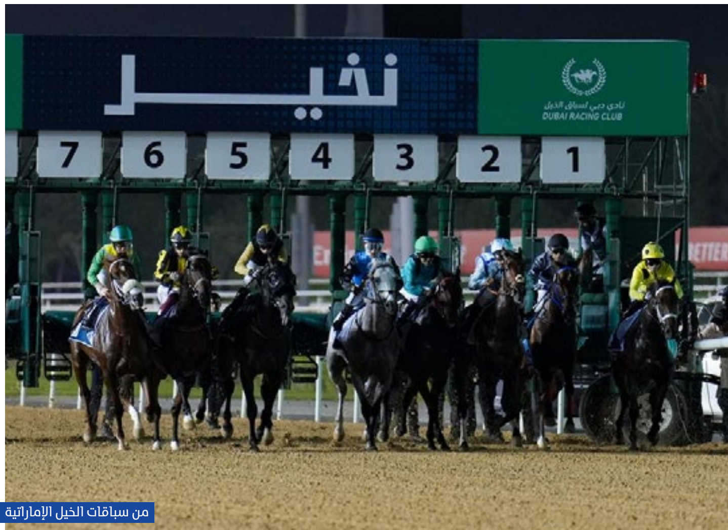
من سباقات الخيل الإماراتية

وأضاف: "شهد الموسم الماضي العديد من الإنجازات والمحطات المضيئة في جميع مضاميرنا الخمسة التي تكاملت معاً لتقدم لنا موسماً ناجحاً ومميزاً، شهدنا