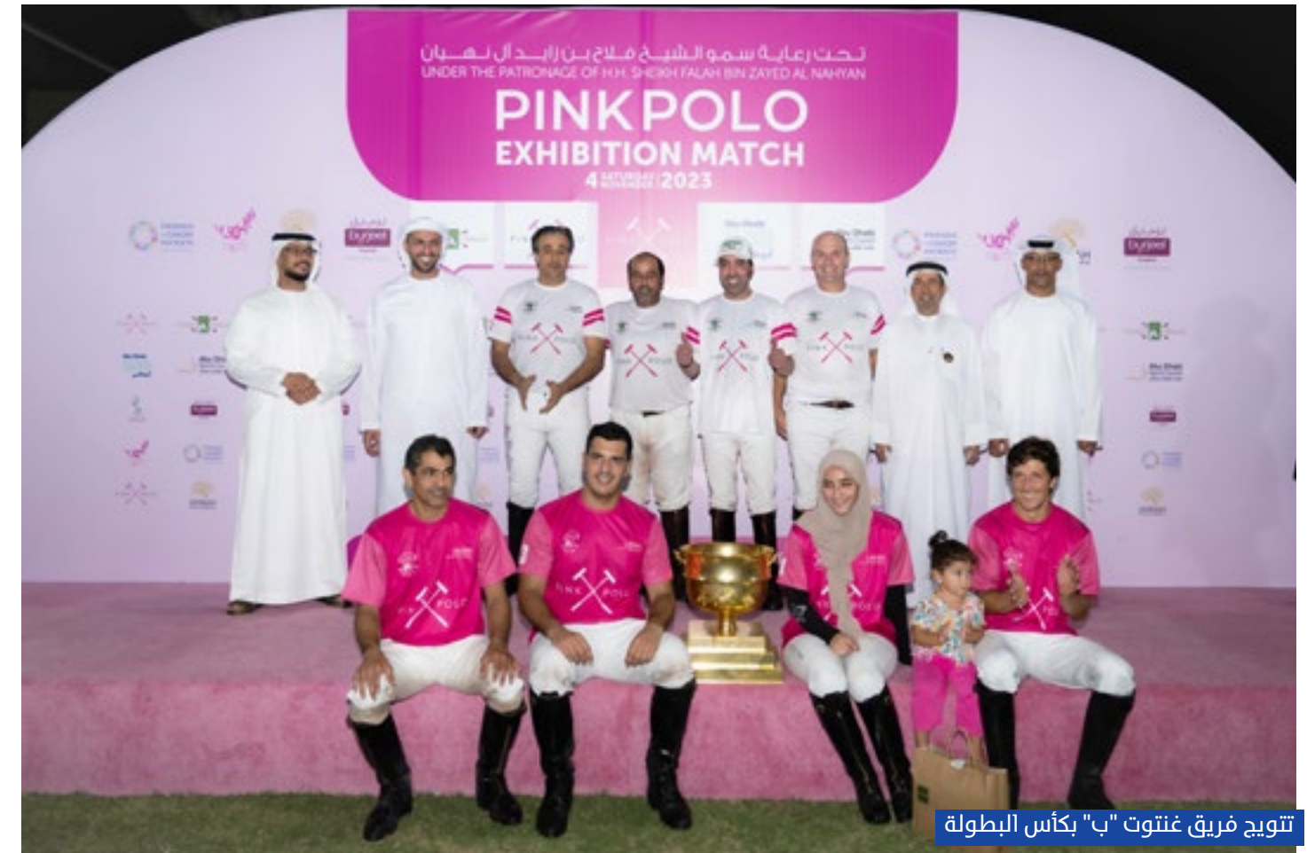
تتويج فريق غنتوت "ب" بكأس البطولة