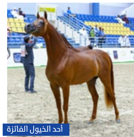
أحد الخيول الفائزة