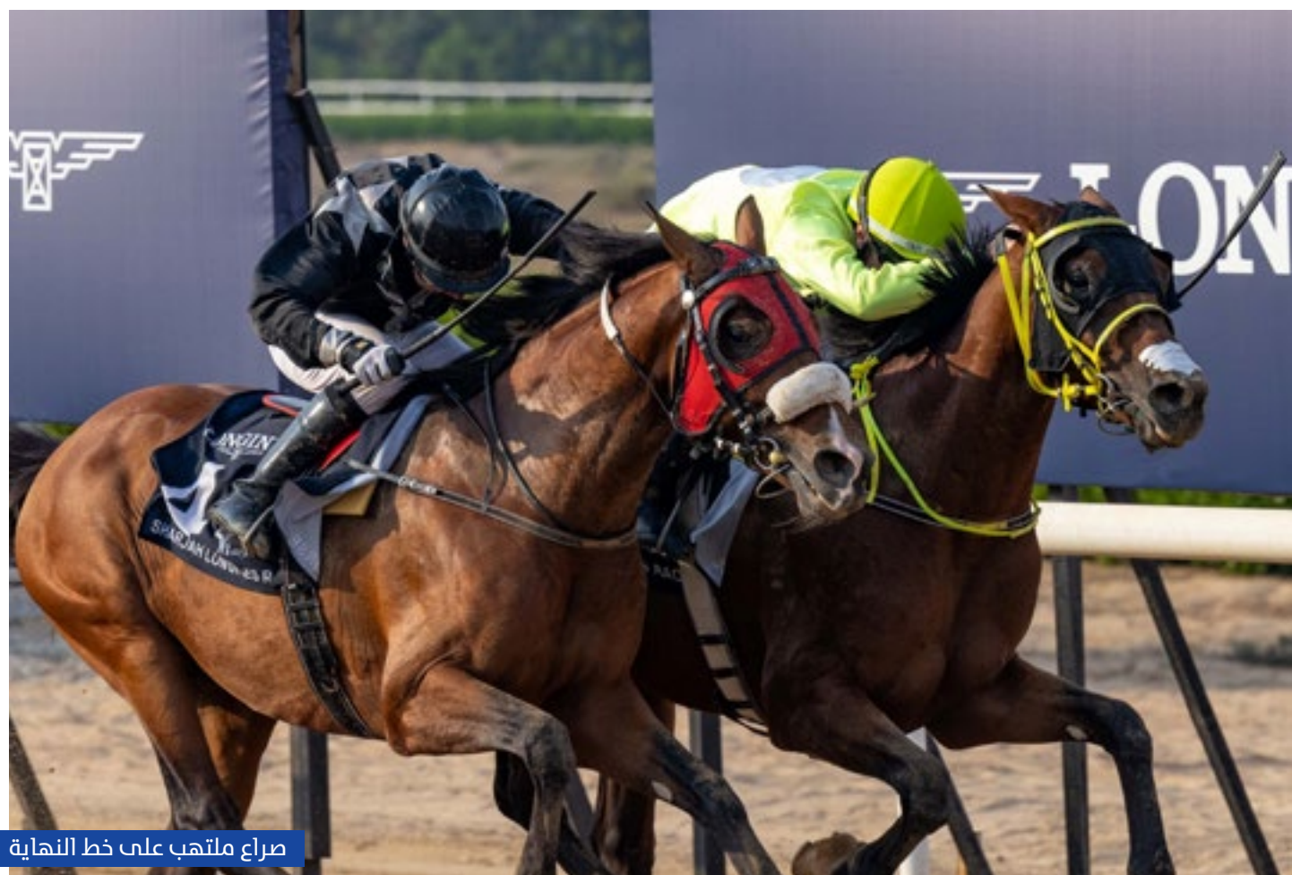
صراع ملتهب على خط النهاية

نجح الجواد «إيجابي» بإشراف دينس أوبراين، بقيادة سام هتشكوت، في انتزاع لقب كأس سمو الشيخ الدكتور سلطان بن خليفة آل نهيان، لمسافة 1700