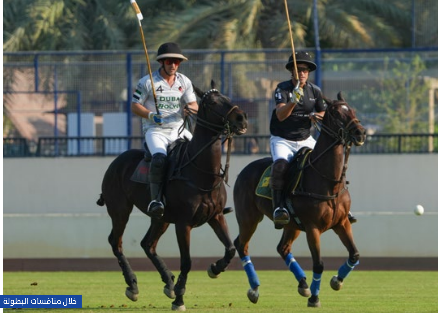
خلال منافسات البطولة