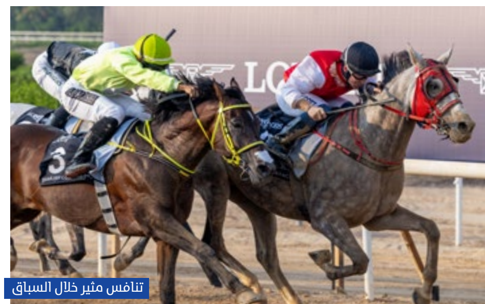
تنافس مثير خلال السباق

توجّ الجواد "إيجابي" لإسطبلات الأصائل، بكأس سمو الشيخ الدكتور سلطان بن خليفة آل نهيان، بفوزه بالمركز الأول في السباق الذي أقيم على مضمار الشارقة لونغين ونظمه نادي الشارقة للفروسية والسباق برعاية شركة لونغين الراعي الرسمي لموسم السباقات، وبدعم من مجلس الشارقة الرياضي ورعاية إعلامية لقناة الشارقة الرياضية، وبلغ مجموع جوائز المليون 250 ألف درهم، من ستة أشواط مثيرة خصصت جميعها للخيل العربية الأصيلة، عدا الشوط السادس الذي خصص للخيل المهجنة الأصيلة، وشارك 85 خيلاً في المنافسة، ويحتضن مضمار الإمارة الباسمة 6 سباقات خلال موسمها الجديد، الذي يختتم في 10 مارس 2024.