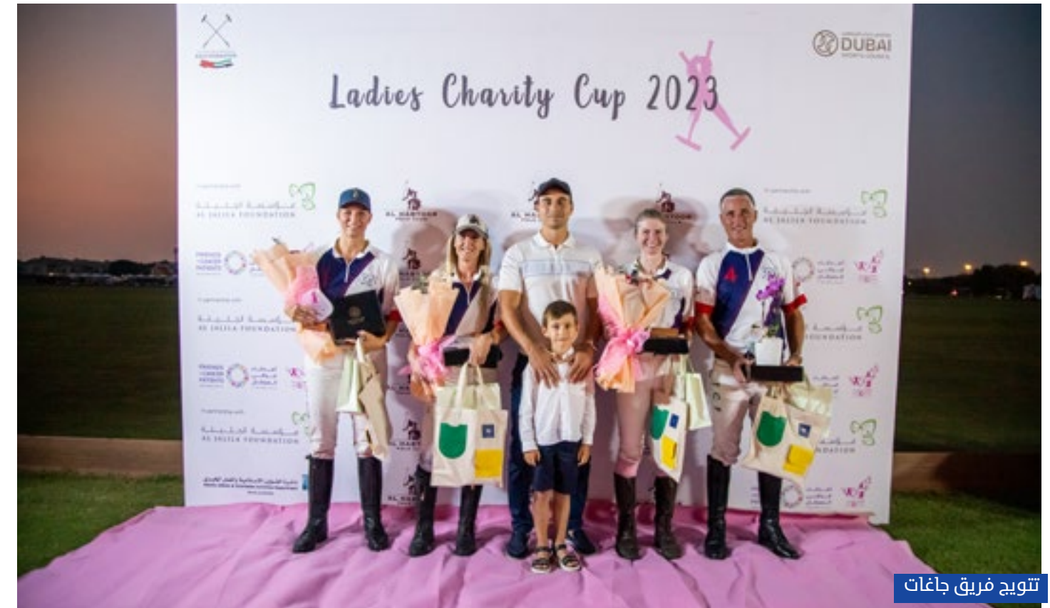
تتويج فريق جاغات