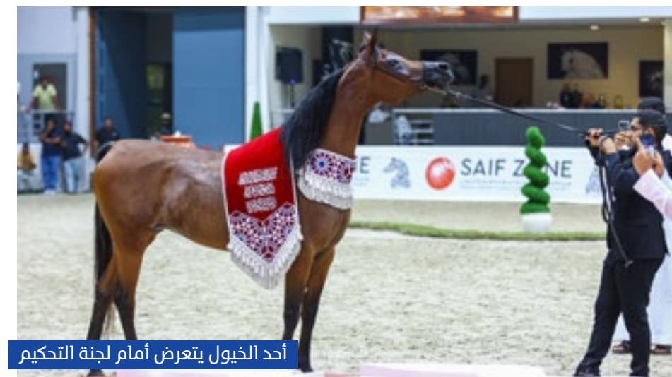
أحد الخيول يتعرض أمام لجنة التحكيم