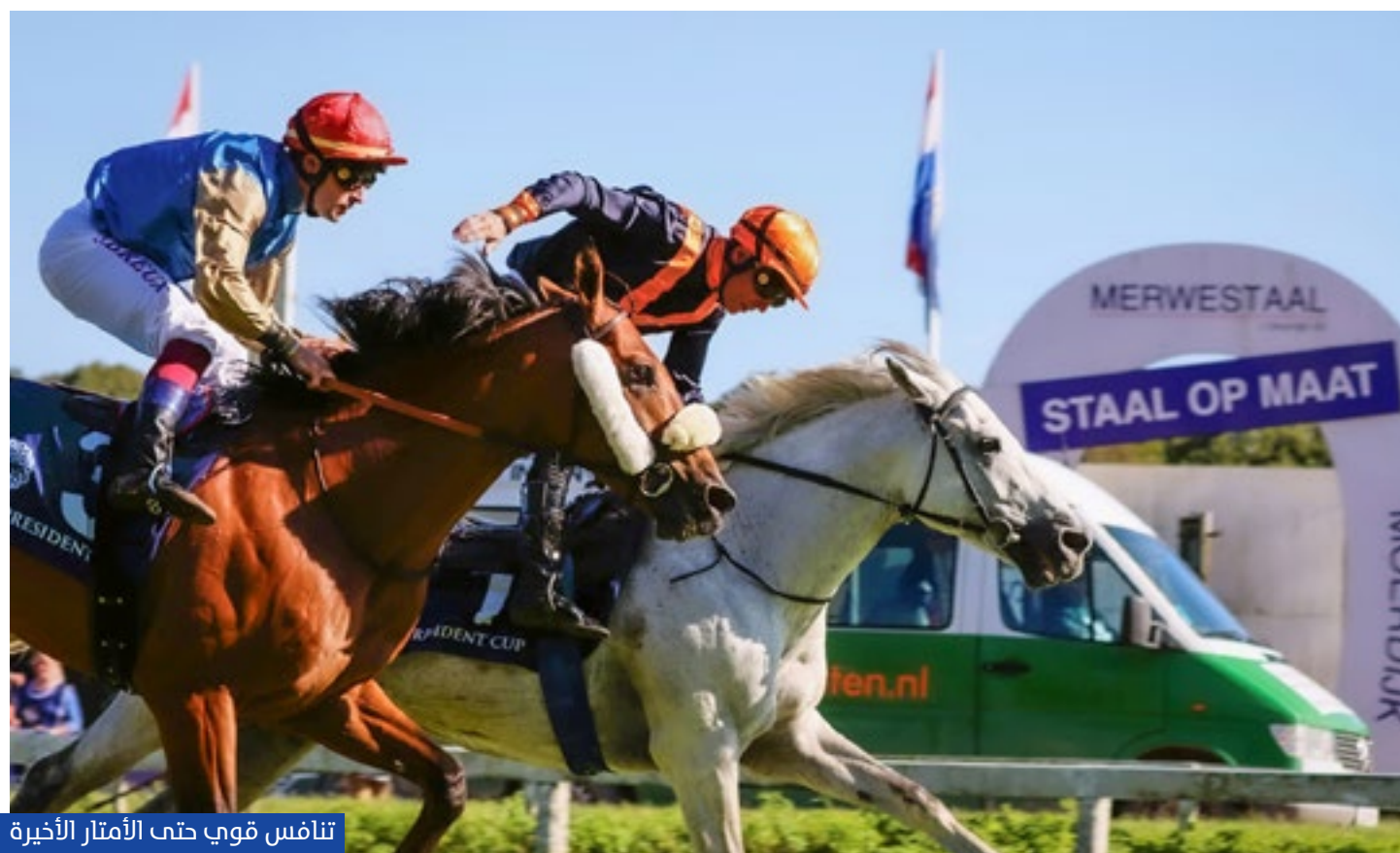
تنافس قوي حتى الأمتار الأخيرة