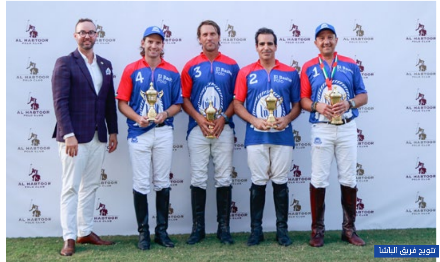
تتويج فريق الباشا

للجمهور بلغت 6 ألف درهم من خلال العثور على العملة الذهبية المتناثرة على أرضية الملعب، وحصل الفائزون على قسائم دخول لعروض لا بيرل، بالإضافة الى عدد من خدمات منتجج الحبتور للبولو ونادي الحبتور للبولو.