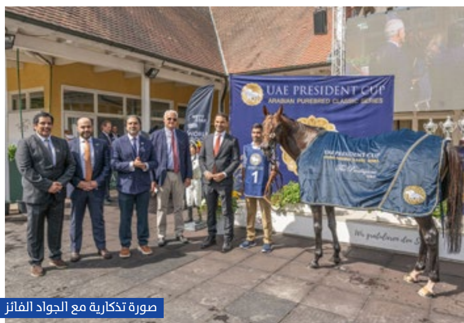
صورة تذكارية مع الجواد الفائز

وتابع: "سعداء بالأصداء الهولندية الواسعة التي حُظيت بها المحطة الختامية للجولات الأوروبية لسلسلة السباقات ومسيرتها الريادية الممتدة على مدار 30 عاماً تمثل دعماً كبيراً ومهماً لأسرة الخيل العربي في العالم وبالتحديد للملاك والمربين وتساهم في تقديم فرص الاعتناء بتربية ورعاية الخيل العربي ورفع معدلات الإنتاج، ما يترجم هدفها ورسالتها الرائدة، مضيفاً: "شهدنا في كافة المحطات تنافساً كبيراً ومشاركة مميزة من نخبة مرابط الخيل العربي في القارة الأوروبية، ما يؤكد على مكانة الحدث وقيمه التاريخية والعالمية في مسيرة سباقات الخيل العربي".