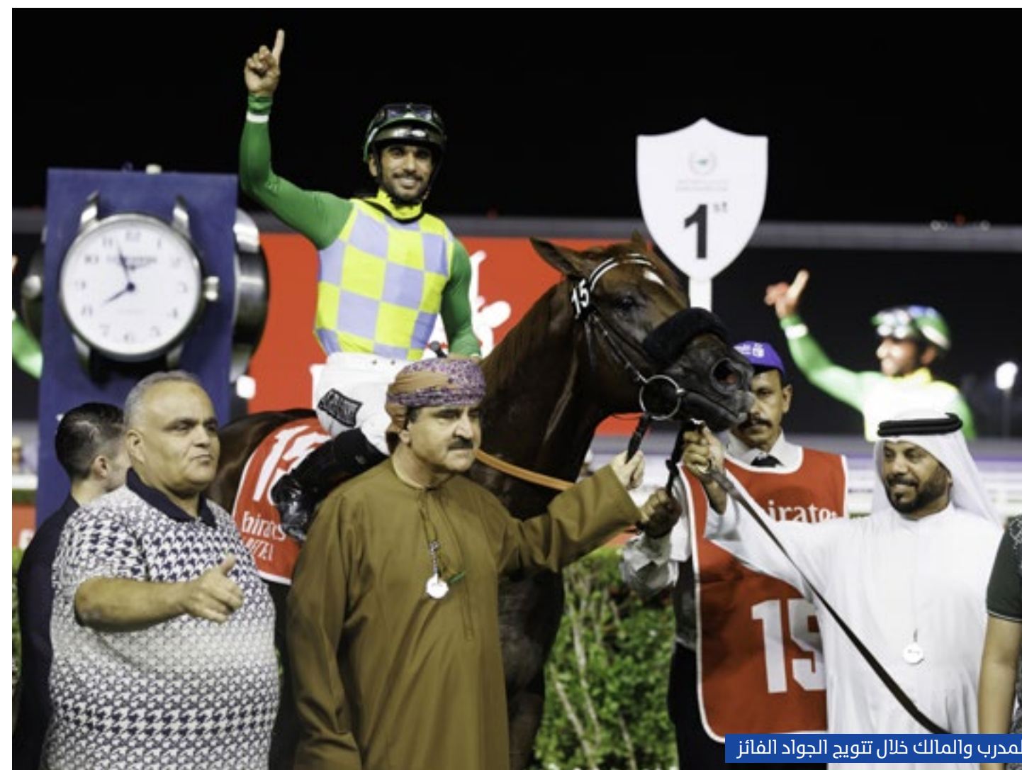
المدرّب والمالك ذلال تتويج الجواد الفائز

العظب عضو مجلس الإدارة المدير التنفيذي لنادي دبي لسباق الخيل.