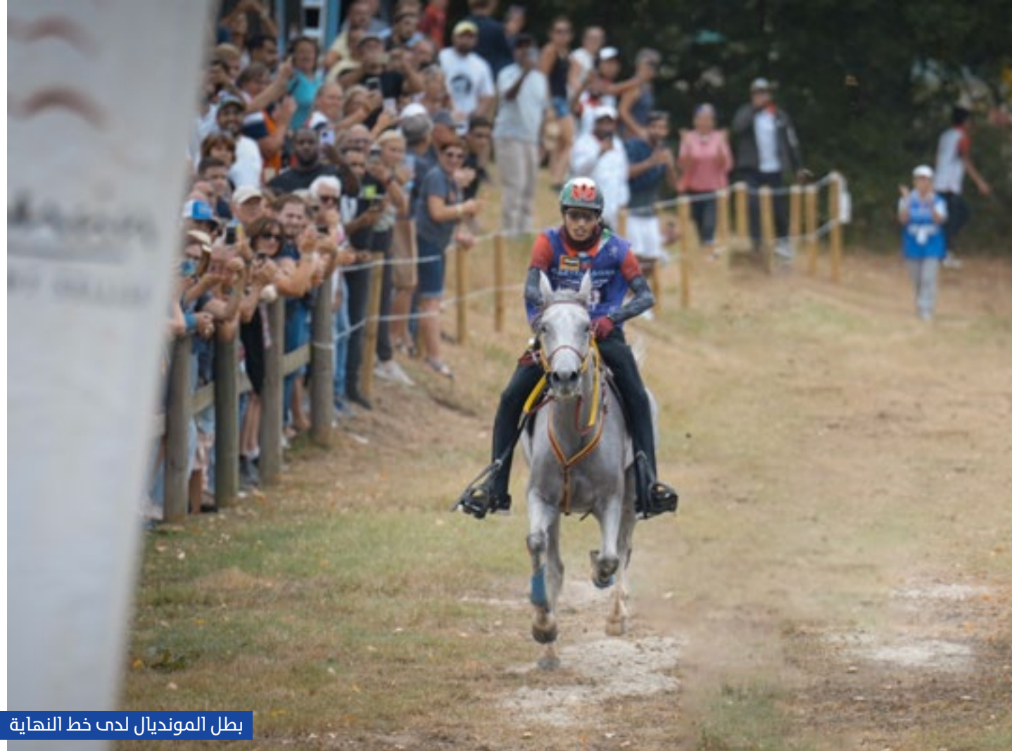
بطل المونديال لدخول خط النهاية