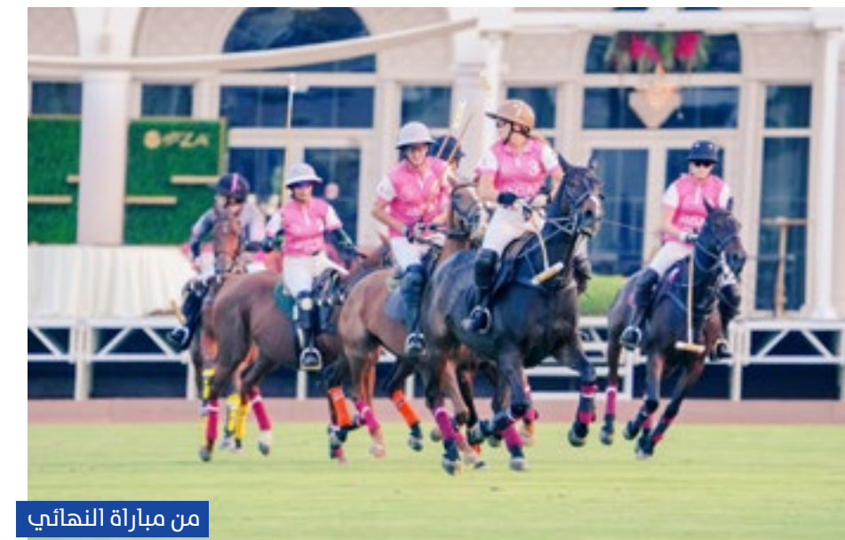
من مباراة النهائي

قامت إدارة نادي الخبيرة للبولو بفتح الأبواب أمام الجمهور لحضور الفعالية الأولى هذا الموسم، والاستمتاع بفقرات اليوم الخيري، منها البحث عن العملة الذهبية في أرضية الملعب بين شوطي المباراة، وتتوالى فقرات الحفل التي تتضمن تسليم الكأس وجائزة أفضل زي نسائي وجائزة "روز بينك"، وحرص حملة مشاعر الخير على المشاركة في المزاد الخيري في ختام المهرجان الوردي.