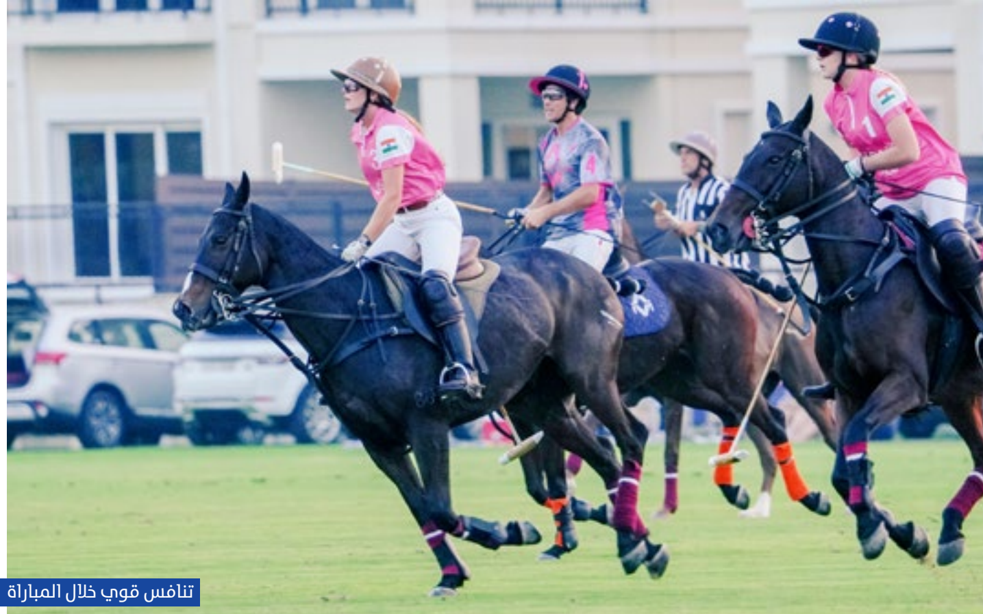
تنافس قوي خلال المباراة

شارك فيها لاعبون محليون ومحترفون من المواطنين والمقيمين . وأضاف : ان المشاركة الواسعة في اليوم الوردي تتلج الصدور وتجسد القيم النبيلة التي تعلمها ابناء الامارات من الاباء الموسسين . وجدد الخبير تهانیه القلبية الى اندية البولو بالدولة والمنطقة بمناسبة انطلاقه الموسم الجديد مؤكدا انه على ثقة نوعية كما وكيفا.