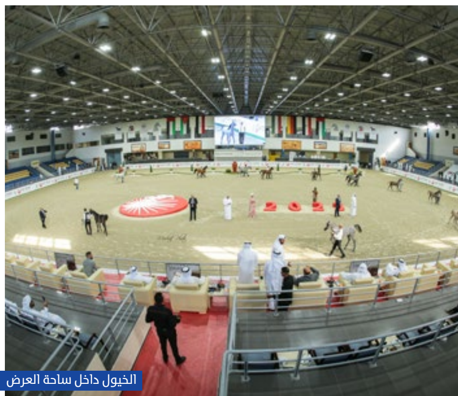
الخيول داخل ساحة العرض