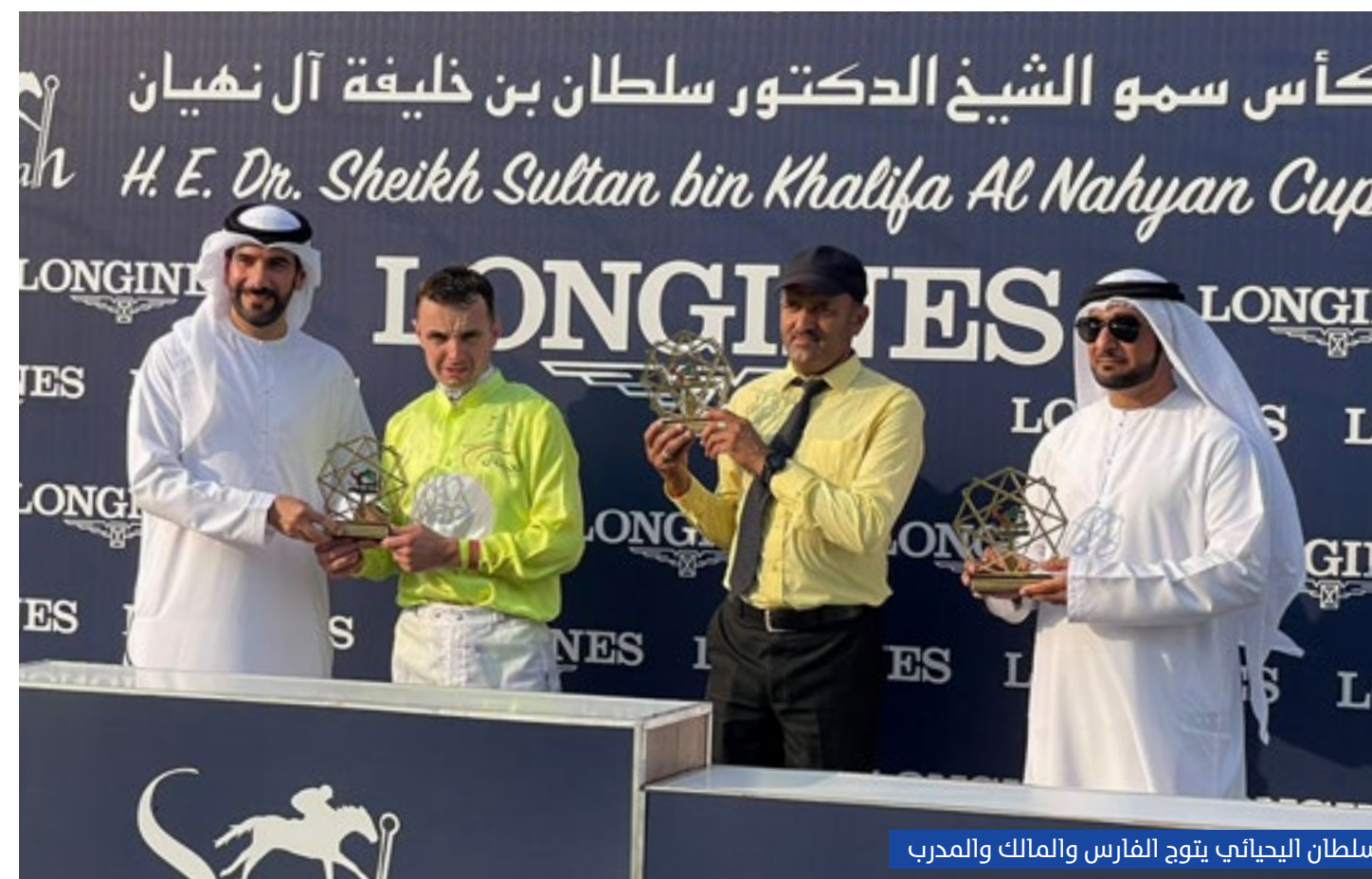
سلطان اليجابي يتوج الفارس والمالك والمدرّب

توجّ الجواد "إيجابي" لإسطبلات الأصائل، بكأس سمو الشيخ الدكتور سلطان بن خليفة آل نهيان، بفوزه بالمركز الأول في السباق الذي أقيم على مضمار الشارقة لونغين ونظمه نادي الشارقة للفروسية والسباق برعاية شركة لونغين الراعي الرسمي لموسم السباقات، وبدعم من مجلس الشارقة الرياضي ورعاية إعلامية لقناة الشارقة الرياضية، وبلغ مجموع جوائز المليون 250 ألف درهم، من ستة أشواط مثيرة خصصت جميعها للخيل العربية الأصيلة، عدا الشوط السادس الذي خصص للخيل المهجنة الأصيلة، وشارك 85 خيلاً في المنافسة، ويحتضن مضمار الإمارة الباسمة 6 سباقات خلال موسمها الجديد، الذي يختتم في 10 مارس 2024.