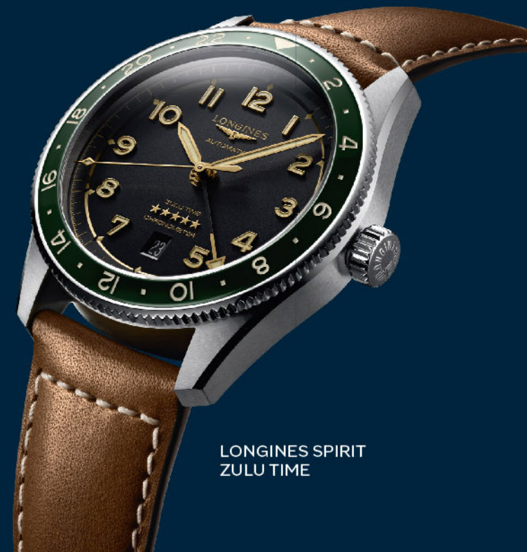
LONGINES SPIRIT ZULU TIME