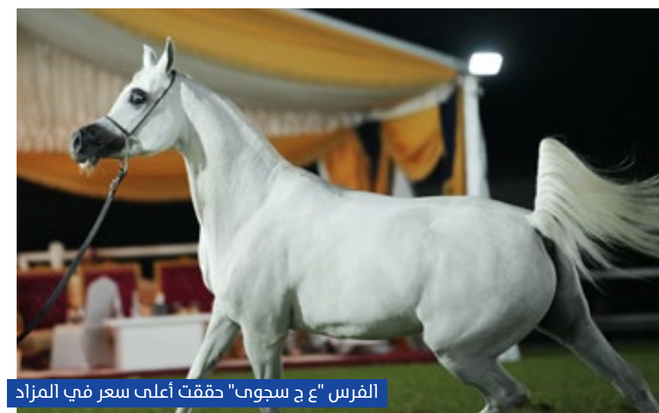
الفرس "ع ج سجوی" حققت أعلى سعر في المزاد

حققت نسخة 2023 لمزااد عجمان للخيول العربية، الذي نظّمته جمعية الإمارات للخيول العربية، نجاحاً تاريخياً بتسجيل أحد أعلى المبيعات في العالم، وبلغت 20 مليوناً و662 ألف درهم، وبلغ عدد الخيول المباعة 85 خيلاً من 89 خيلاً تم عرضها خلال المزاد.