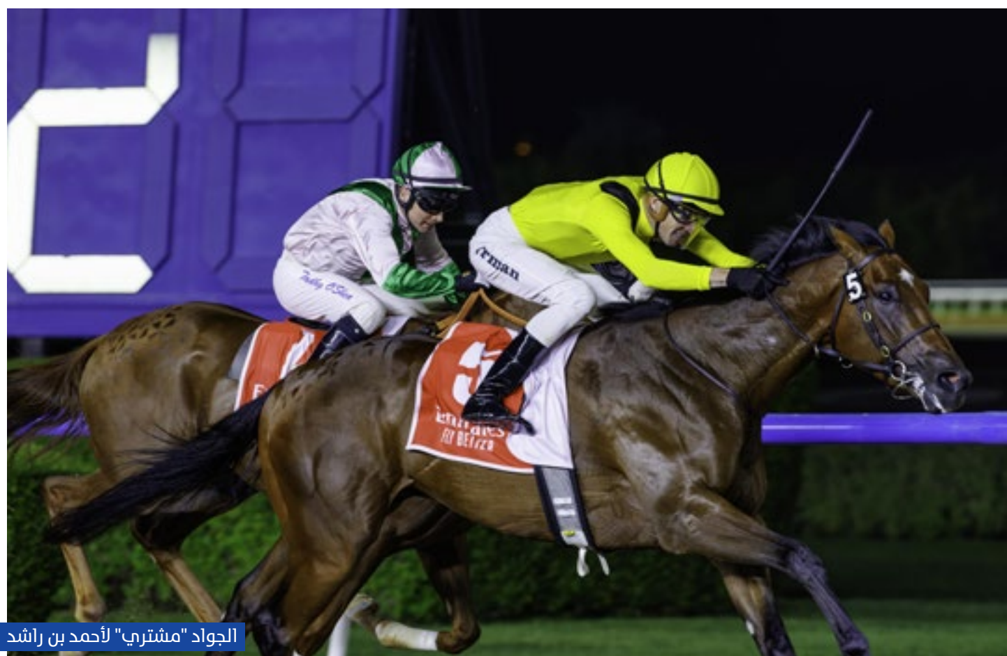
الجواد «مشتري» لأحمد بن راشد