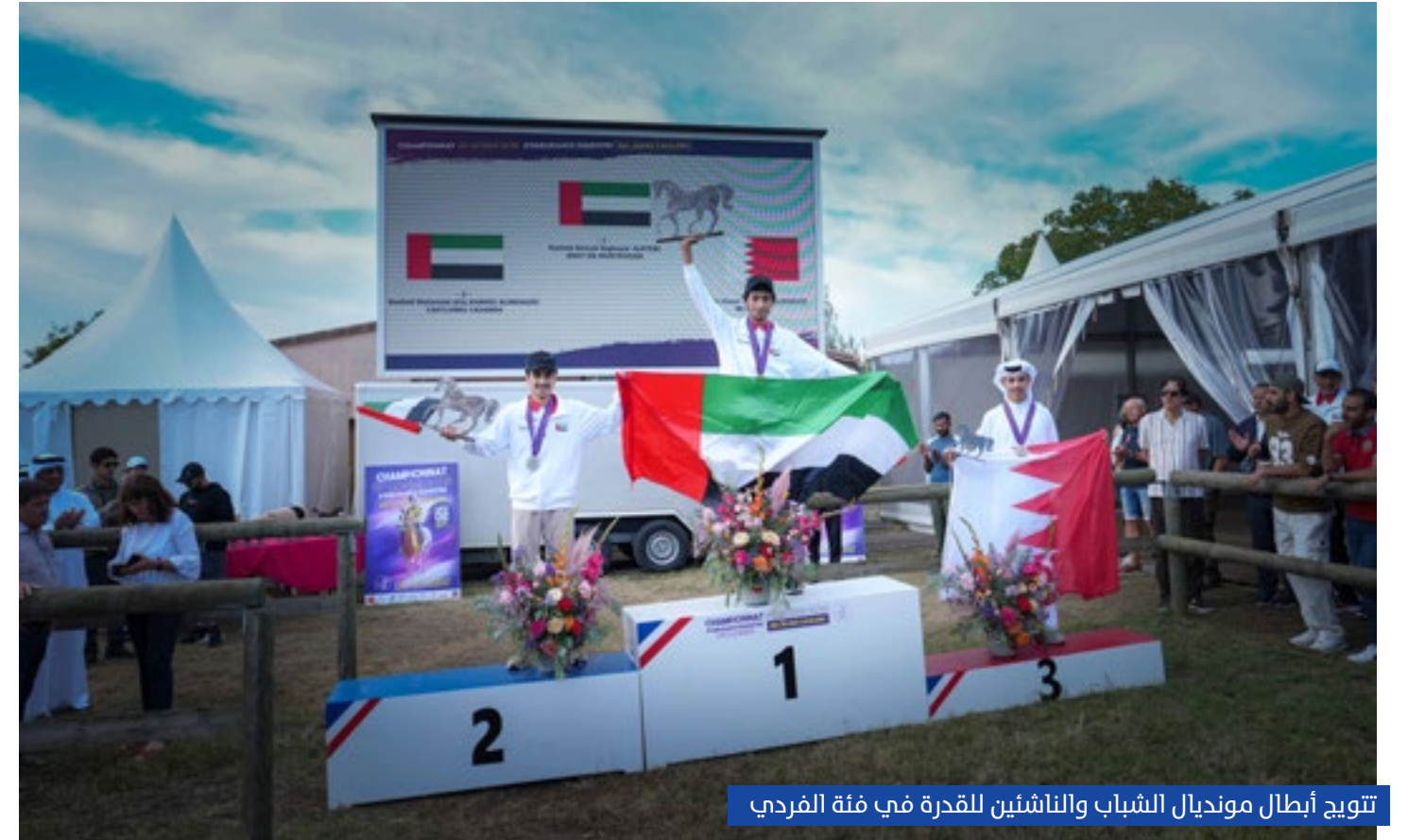
تتويج أبطال مونديال الشباب والناشئين للقدرة في فئة الفردي