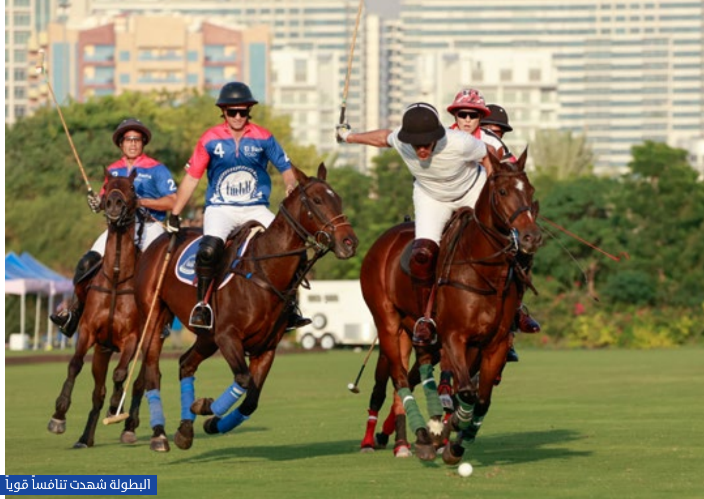
البطولة شهدت تنافساً قوياً