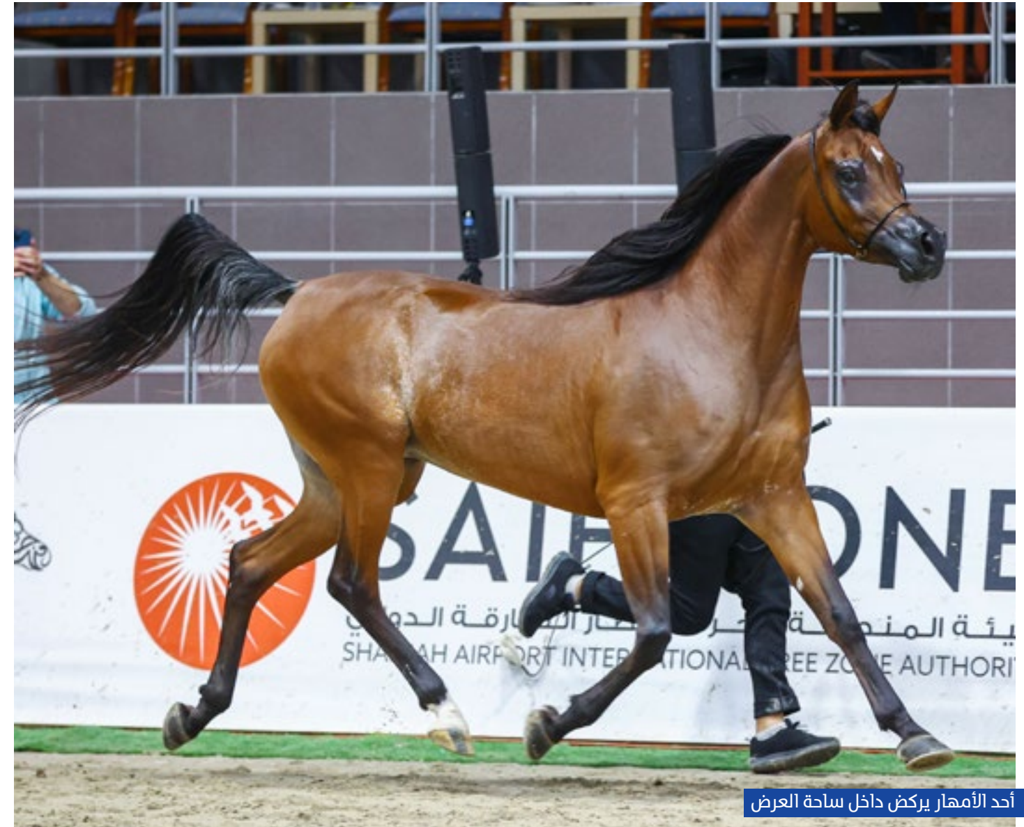
أحد الأمهار يركض داخل ساحة العرض