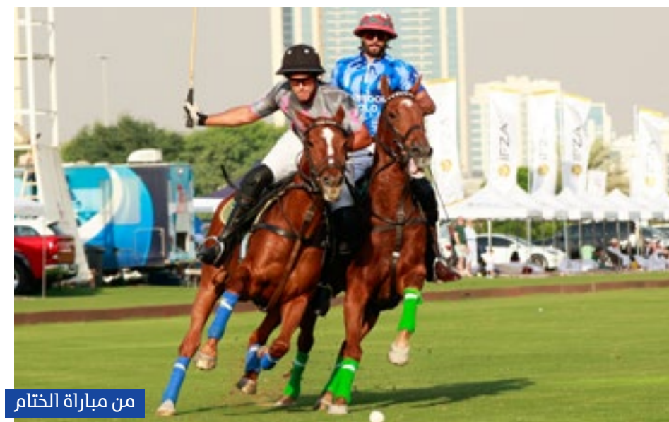
من مباراة الختام

توج فريق الباشا للبولو بلقب كأس بطولة باترونس للبولو، بعد على فوزه على فريق الفيصل في المباراة النهائية للبطولة التي ضمت كل من فريق الحبتور، ايه ام، هيسكيث، وديي وولفز، واستضافتها ميادين منتجج الحبتور للبولو بدبي.