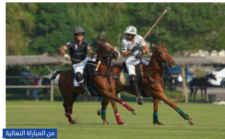
من المباراة النهائية

توج فريق الفيصل السعودي بطلاً لبطولة الهالوين 2023 للبولو التي أقيمت على ملاعب نادي ومنتجع الحبتور للبولو والفروسية على مدار يومين بهانديكاب 4 جول، وشارك فيها 3 فرق؛ هي: الفيصل والحبتور والذئاب مهرة؛ حيث لعب كل فريق 4 مباريات فيما بينهم "ذهاب وعودة".