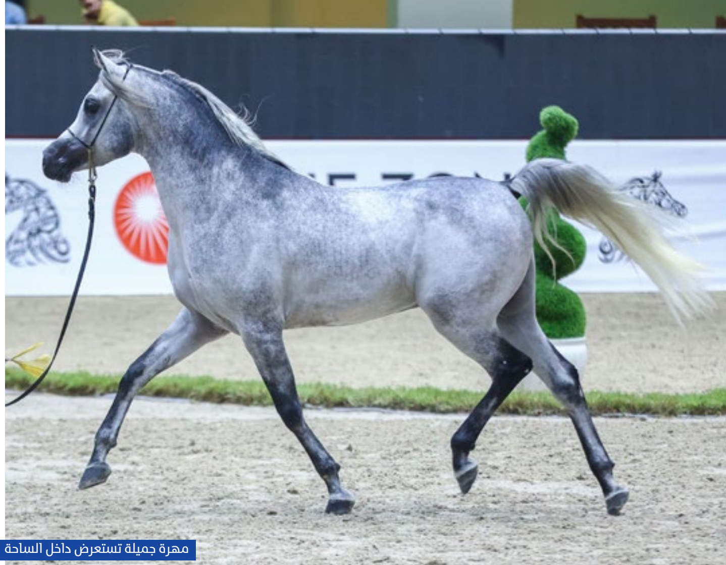
مهرة جميلة تستعرض داخل الساحة