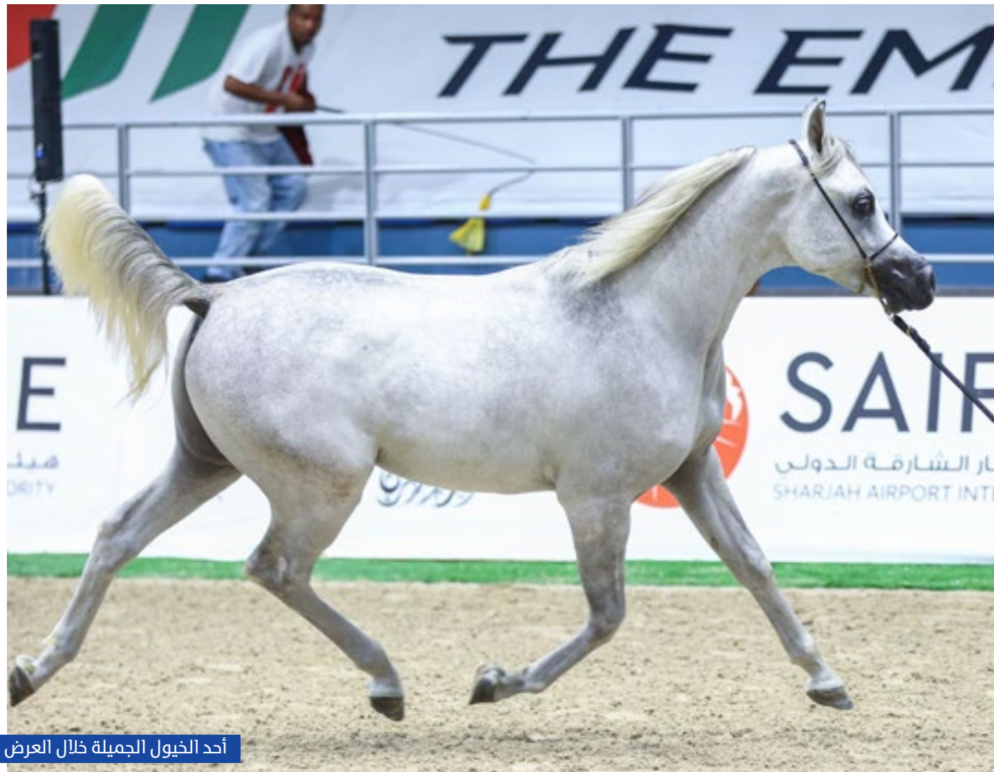
أحد الخيول الجميلة خلال العرض