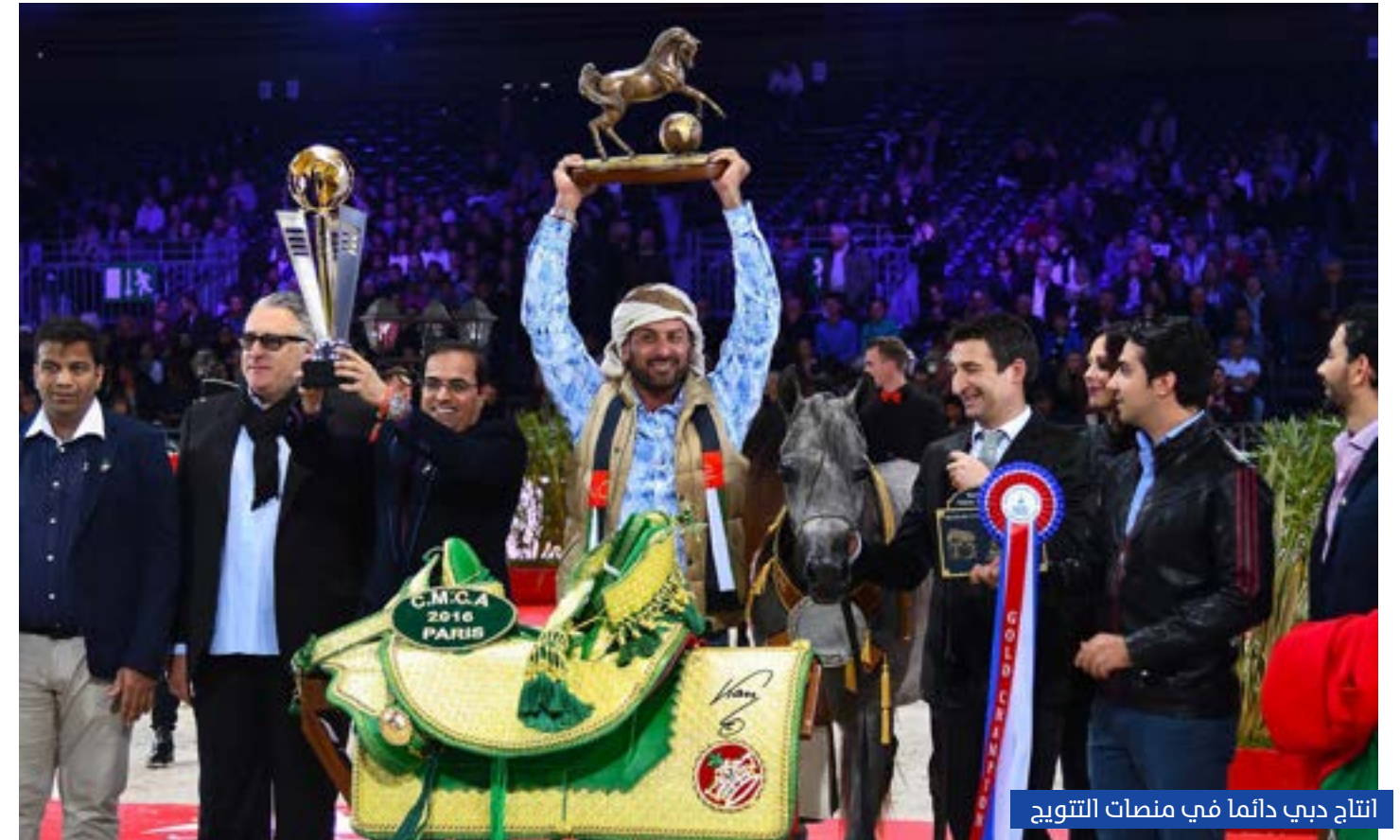
إنتاج دبي دائماً في منصات التتويج

وأكد أن هذه المكرمة تمثل امتداداً لنهج سموه في دعم قطاع الخيل العربية، مشيراً إلى أن نجاح أي مربط لا يكتمل إلا بانعكاس أثره الإيجابي على عموم الملاك والمربين، بما يسهم في بناء قاعدة إنتاجية وطنية قوية ومستدامة.