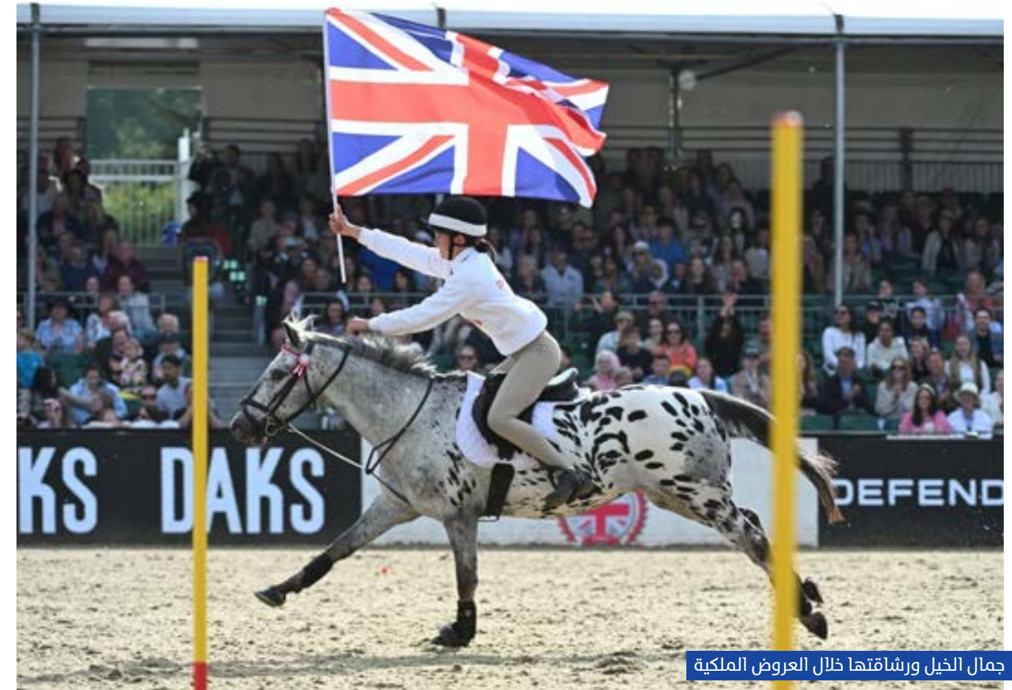
جمال الخيل ورشاقته خلال العروض الملكية

السبت، حيث يلتقي منتخب أذربيجان مع فريق من نادي الحرس للبولو، في مواجهة تعكس سرعة وإثارة اللعبة أمام خلفية تاريخية مميزة لقلعة وندسور.