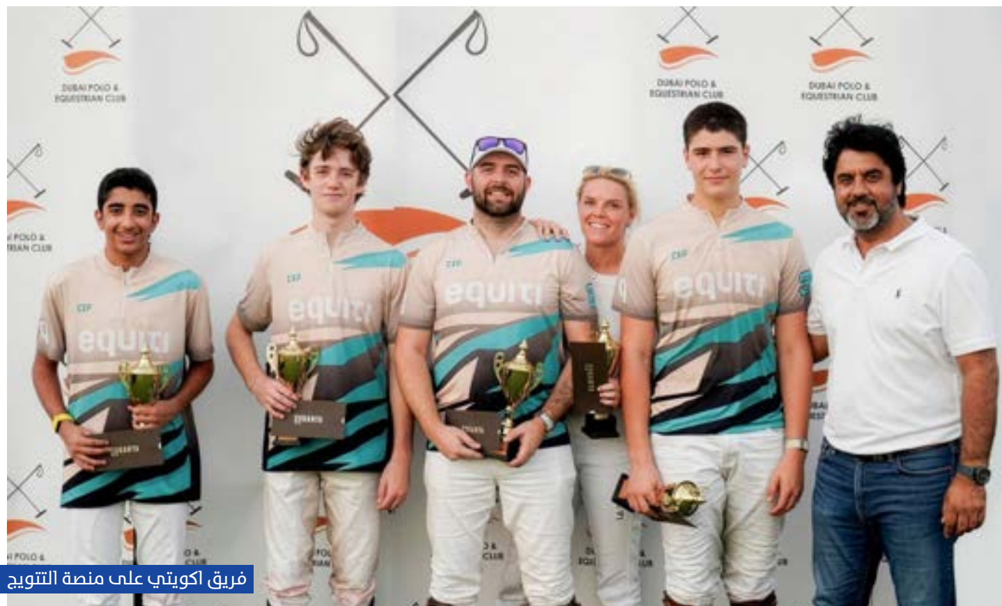
فريق إكوي تي على منصة التتويج

وجاءت المباراة النهائية مسك ختام الموسم زاخر بالمنافسات، حيث حفلت باللحظات المثيرة والمهارات الفنية العالية، في تأكيد جديد على المستوى المتطور الذي وصلت إليه بطولات البولو الإماراتية، سواء من حيث التنظيم أو جودة الفرق واللاعبين