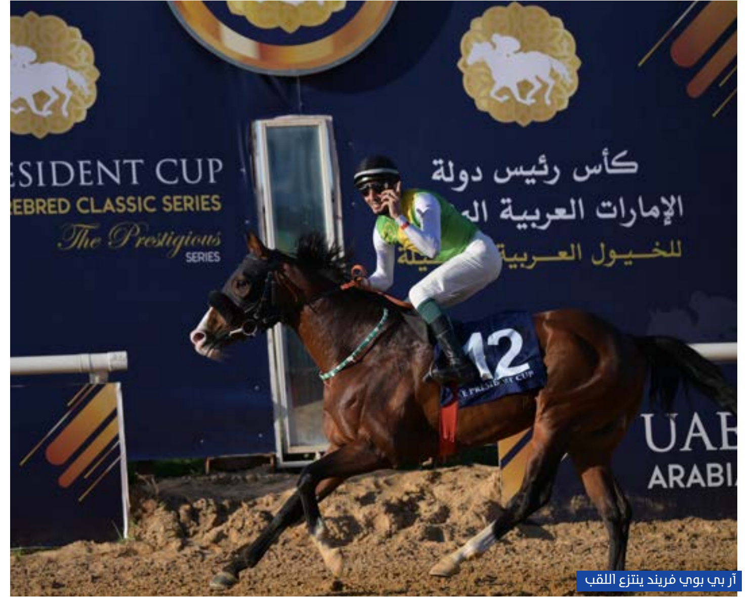
آر بي بوي فريند ينتزع اللقب