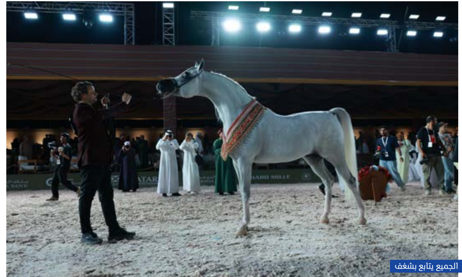
الجميع يتابع بشغف