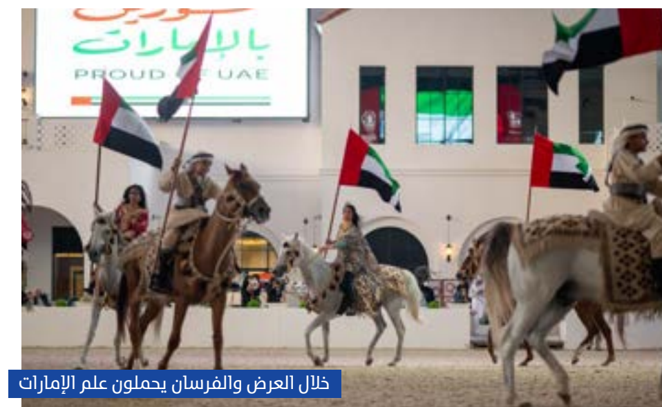
خلال العرض والفرسان يحملون علم الإمارات

وأقيم الحدث في أجواء الهواء الطلق بساحة الخيل، إلى جانب مقاهٍ مختارة ومنصات مؤقتة لأسلوب الحياة، حيث سلط الضوء على التقاء التراث الإماراتي بالتجارب المجتمعية المعاصرة.