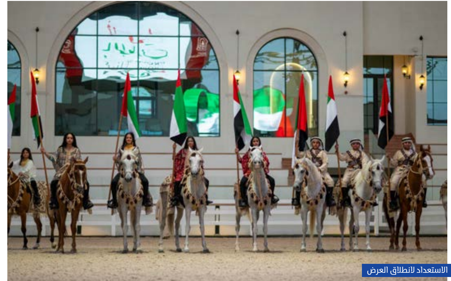
الاستعداد لانطلاق العرض

ضمن نادي أبوظبي للفروسية يهدف إلى الارتقاء بقطاع الفروسية والاحتفاء بآرثه العريق في إطار حضري معاصر، وقد تم إطلاقه في ديسمبر 2025.