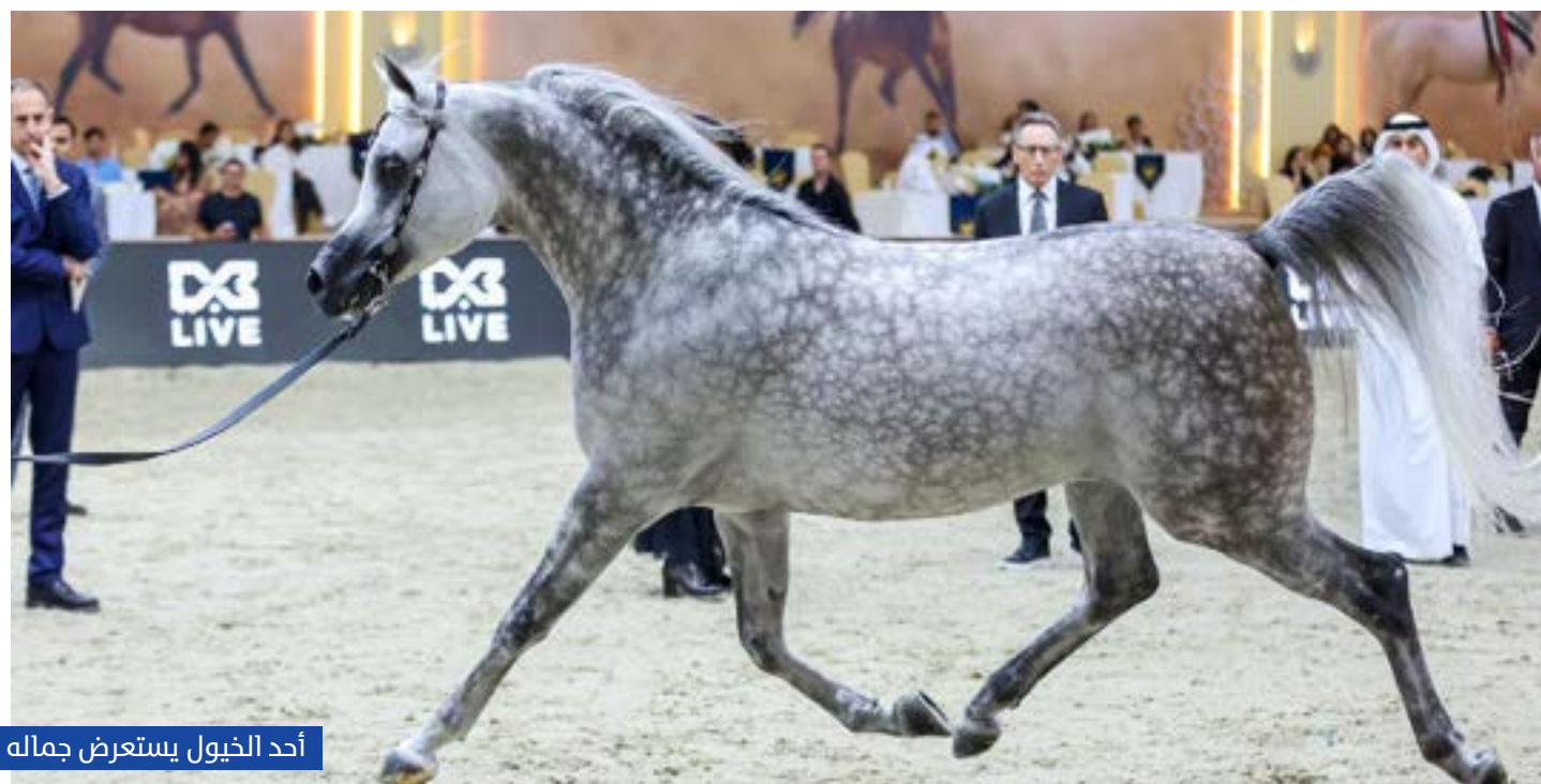
أحد الخيول يستعرض جماله