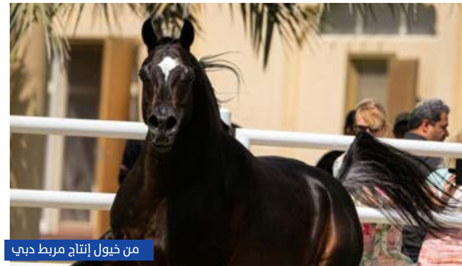
من خيول إنتاج مربط دبي

تواصل مكرمة فارس العرب، صاحب السمو الشيخ محمد بن راشد آل مكتوم، نائب رئيس الدولة رئيس مجلس الوزراء حاكم دبي، دعمها المتجدد للمرابط الوطنية وملاك الخيل العربية الأصيلة في دولة الإمارات، في إطار رؤية تستهدف الارتقاء بجودة الإنتاج وتعزيز تنافسية الخيل الإماراتي على المستويين الإقليمي والدولي.