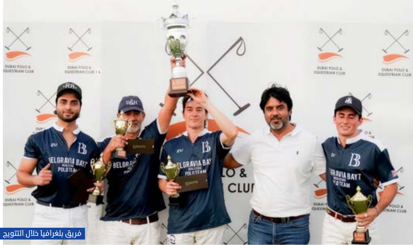
فريق بلغرافيا خلال التتويج

جمعت نخبة اللاعبين والفرق، مستفيداً من بنيته كواحد من أقوى وأثرى مواسم البولو في المنطقة، بفضل تنوع البطولات، وقوة المنافسة، والحضور الدولي المتزايد، إلى جانب الدعم الكبير الذي تحظى به الرياضة من الأندية والمؤسسات الرياضية في الدولة، ما جعل الإمارات محطة رئيسية على خريطة البولو العالمية. كما يؤكد موسم البولو الإماراتي عاماً بعد آخر مكانته