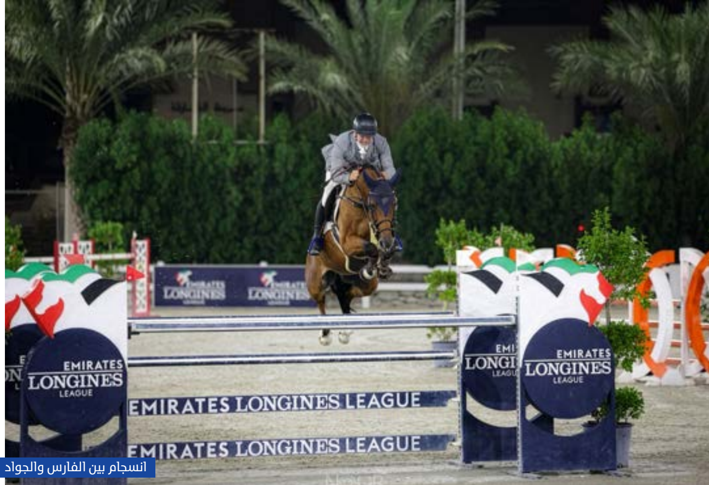
انسجام بين الفارس والجواد

وفي لقاء فرسان المستوى الاول في منافسة المرحلتين