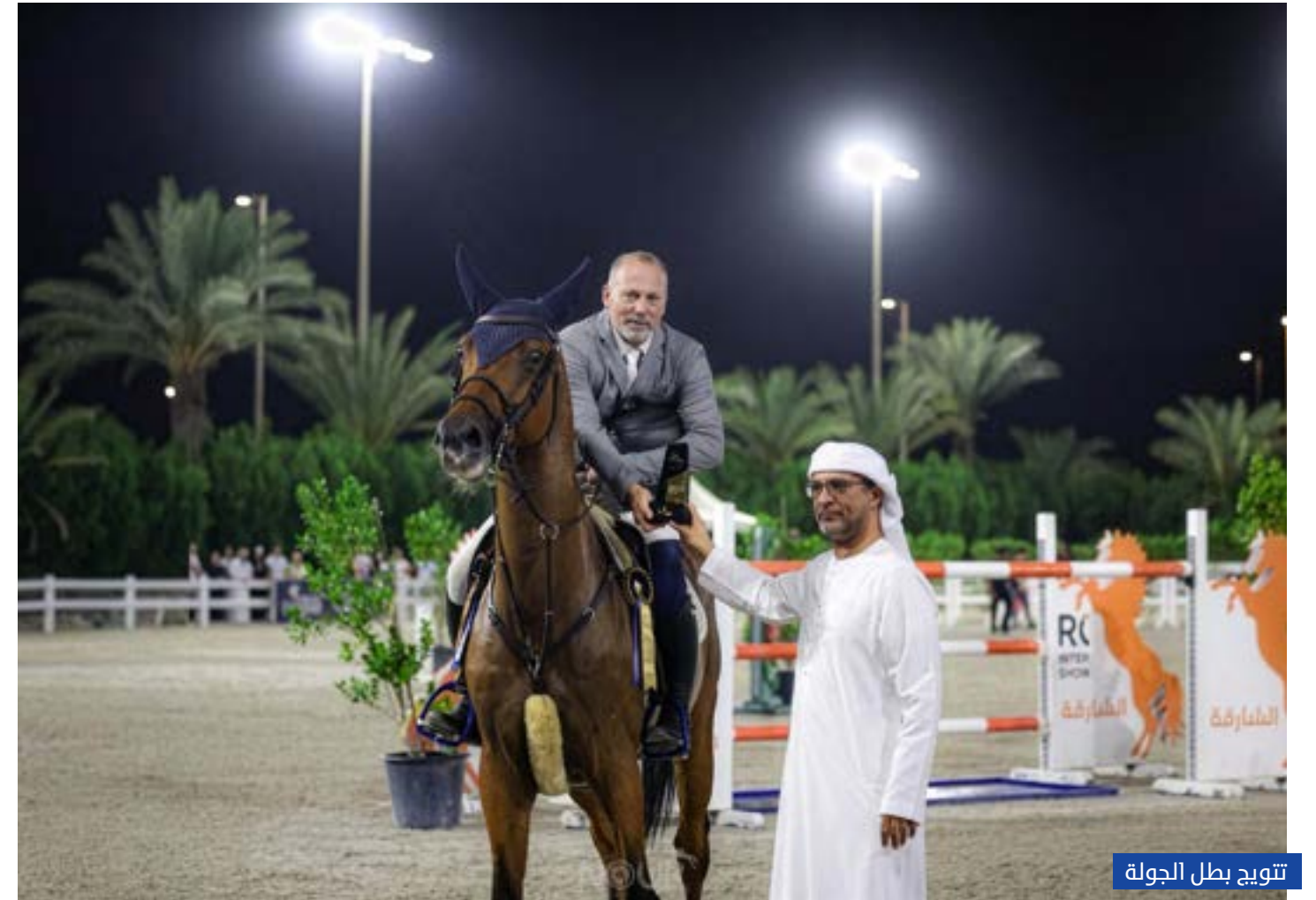
تتويج بطل الجولة

سيطر فرسان قفز الحواجز بنادي الشارقة للفروسية على المراكز الأربعة الأولى، في منافسة الجولة الواحدة مع جولة للتمايز، والتي صمم مسارها بحواجز بلغ ارتفاعها 145 سم، في ختام برنامج منافسات وبطولات الشارقة للفروسية بالموسم الحالي، وأقيمت المنافسات يوم 25 و 26 أبريل 2026 على ميادين القفز الداخلية المغطاة والخارجية بمركز الشارقة للفروسية ضمن دوري الإمارات لونغين لقفز الحواجز في نسخته الـ14، بإشراف اتحاد الإمارات للفروسية والسباق، وبرعاية لونغين راعية الدوري، واشتملت على 12 منافسة تضمنت 20 شوطاً لمشاركة الفرسان من جميع الفئات، في آخر المنافسات .