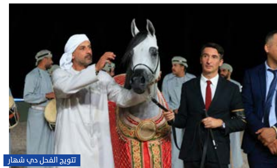
تتويج الفحل دي شهار

سجّلت المرباط الإماراتية حضوراً لافتاً في ختام المحطة الثالثة من جولة الجياد العربية العالمية 2026، التي أقيمت في الفترة من 31 مارس - 2 أبريل 2026 في العاصمة العمانية مسقط وسط مشاركة نخبة من الخيول العربية من مختلف دول العالم، مؤكدة مكانة دولة الإمارات كإحدى أبرز القوى في صناعة الخيل العربية.