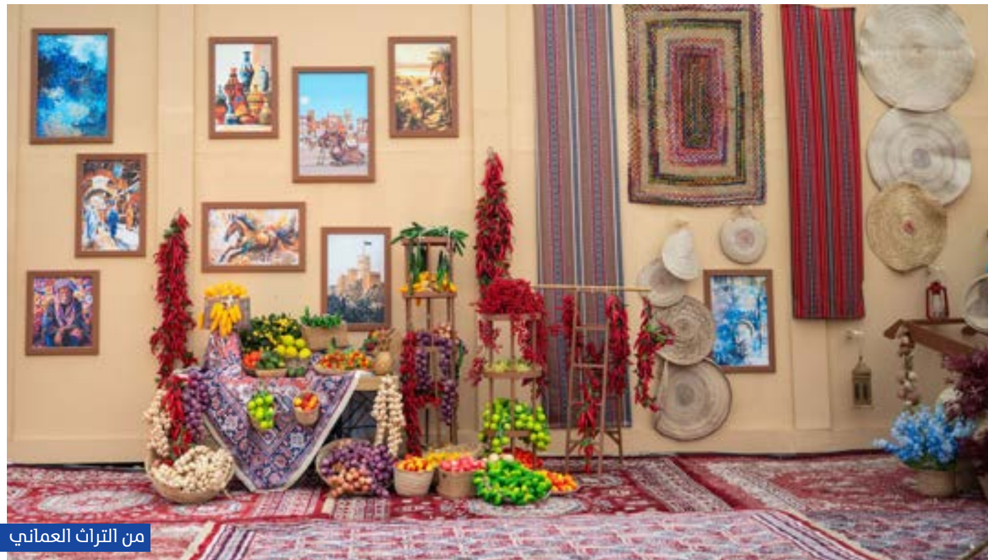
من التراث العماني

واختتمت المنافسات ببطولة الفحول، التي شهدت تنويع