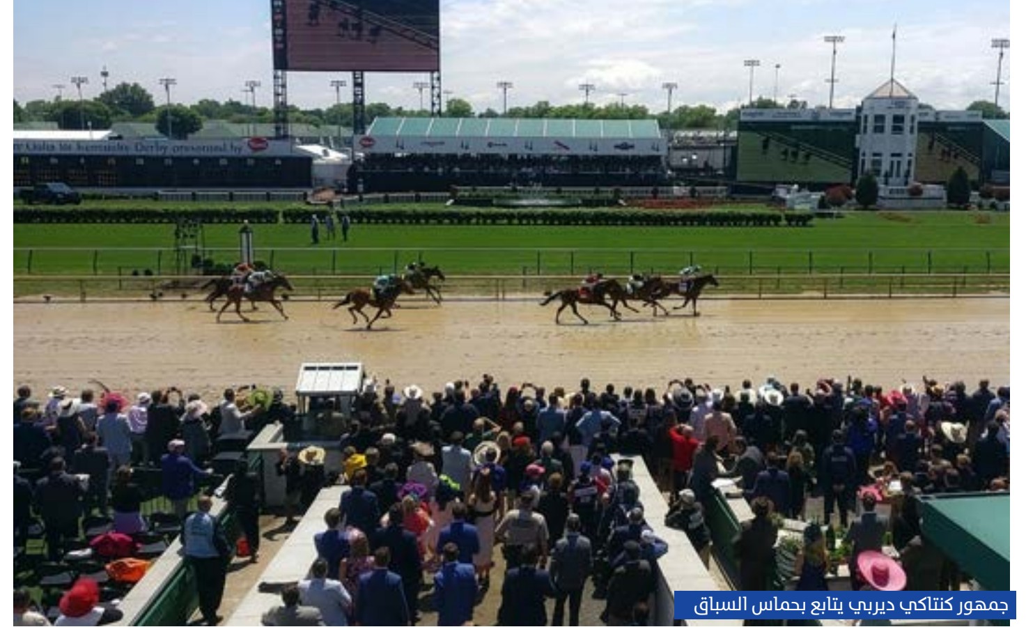
جمهور كنتاكي ديربي يتابع بحماس السباق