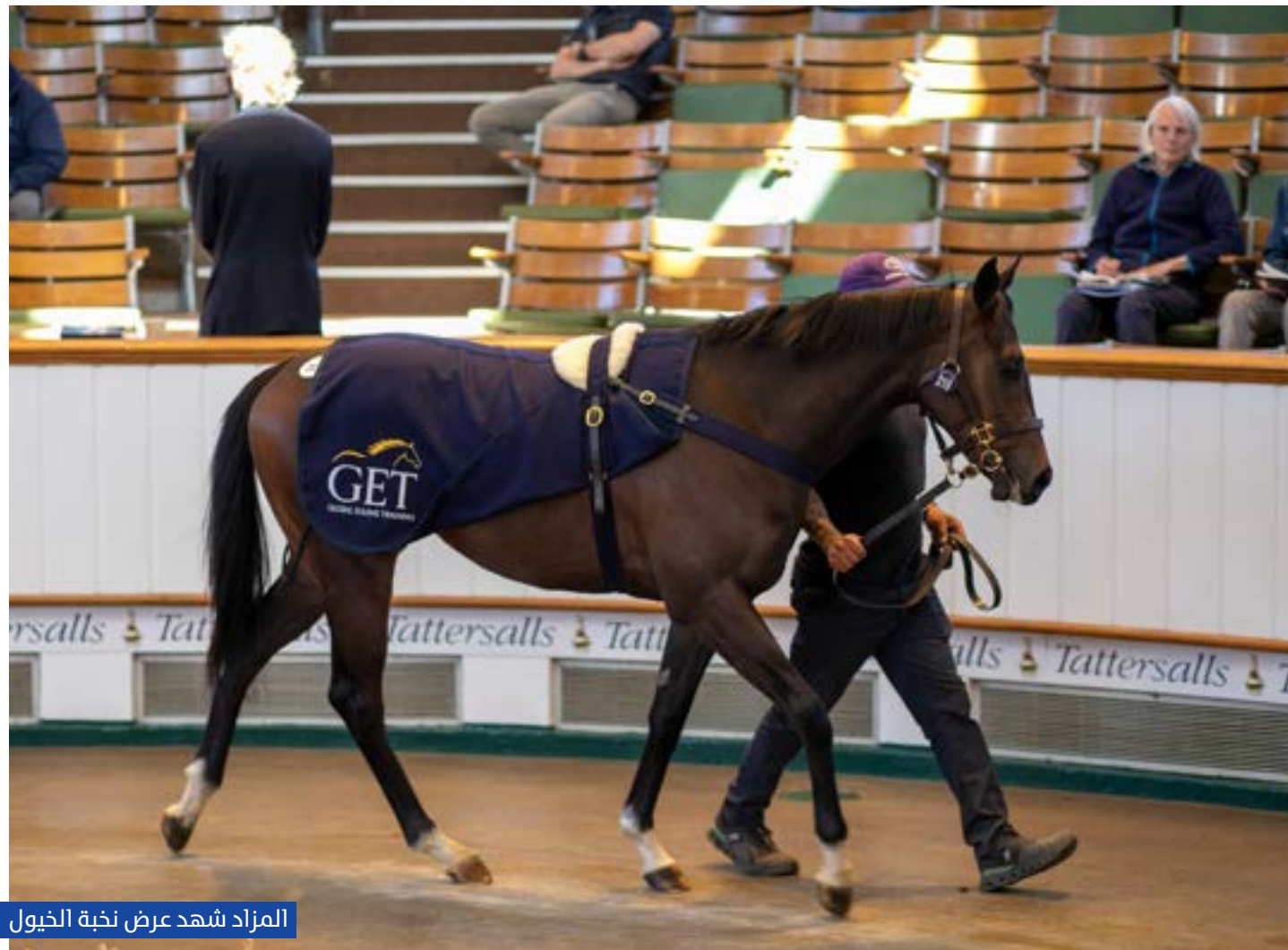
المزاد شهد عرض نخبة الخيول

أهمية هذه المنصة في تسهيل انتقال الخيول إلى مختلف الدول المجاورة، بما يتيح لها مواصلة مسيرتها التنافسية على مستوى المنطقة.