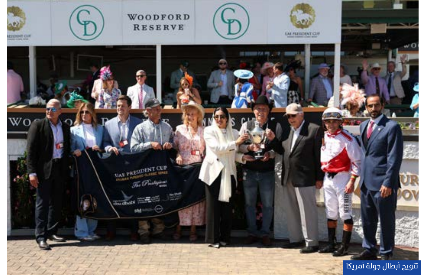
تتويج أبطال جولة أمريكا