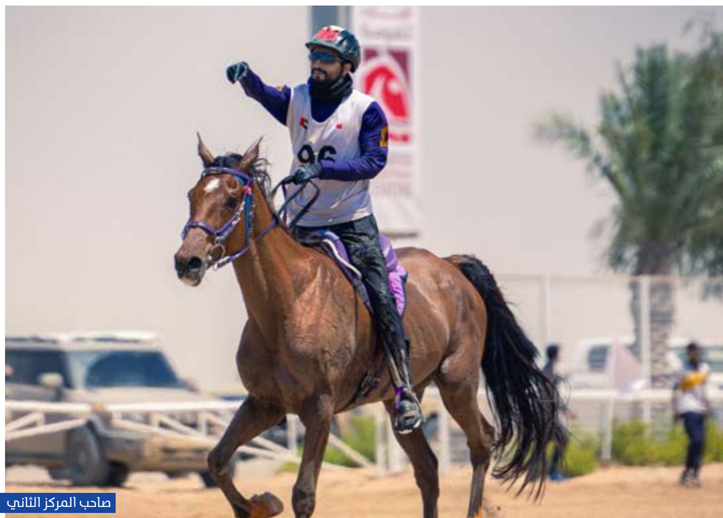
صاحب المركز الثاني

الـ5 في المرحلة الثالثة، وواصل الصعود إلى المركز الثاني في نهاية السباق في المرحلة الرابعة وسجل زمناً قدره 4:22:51 ساعة ليحل وصيفاً.