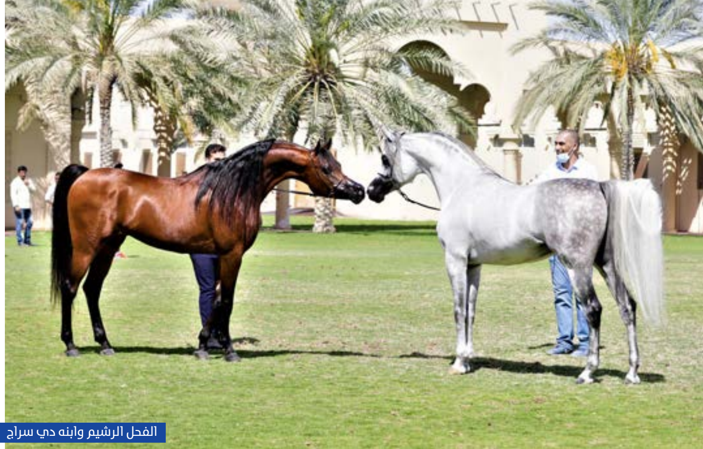
الفحل الرشيم وأبنة دبي سراج

المبادرات السامية تواصل إحداث أثرها الإيجابي في تطوير القطاع، وتعزز من مكانة الإمارات كمركز عالمي رائد في تربية وإنتاج الخيل العربية الأصيلة.