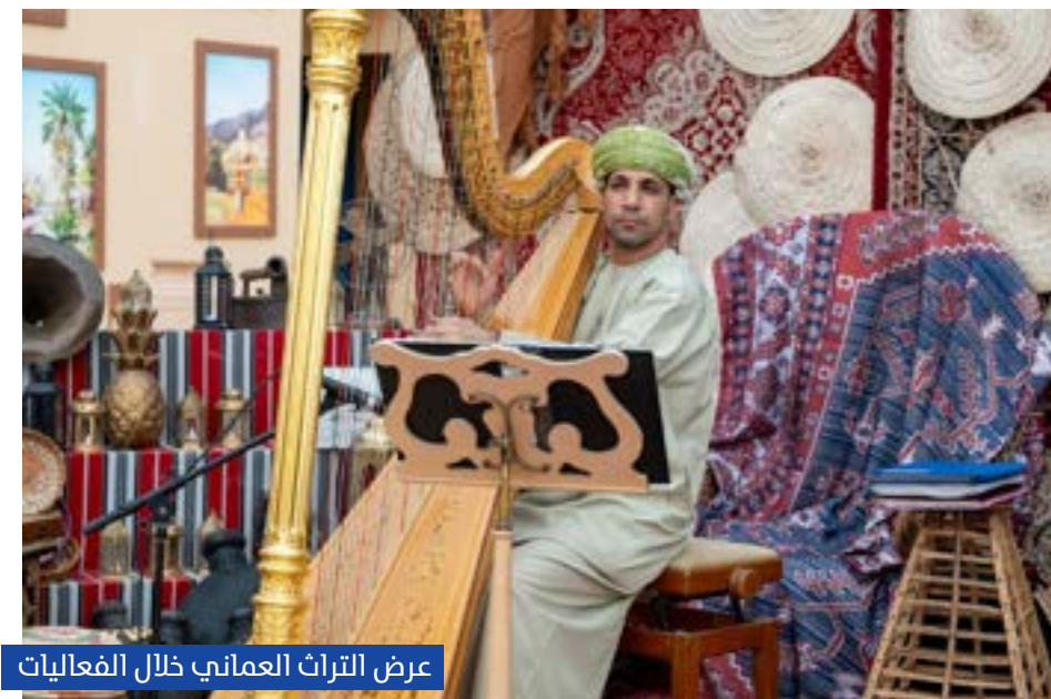
عرض التراث العماني خلال الفعاليات

ورغم تأجيل انطلاق الفعاليات في وقت سابق، خرج الحدث بصورة تنظيمية متميزة، مع منافسات قوية بين أبرز الخيول العربية عالمياً، ما عزز من مكانة محطة مسقط كأحدى أهم محطات الجولة.