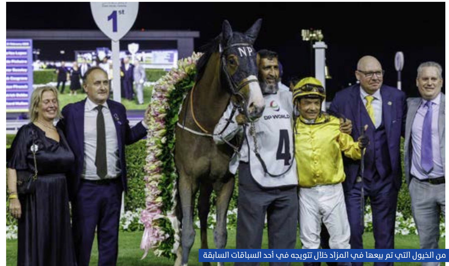
من الخيول التي تم بيعها في المزاد خلال تتويجه في أحد السباقات السابقة

الجواد، البالغ من العمر أربع سنوات، سجلاً مميزاً بتحقيقه فوزين في المملكة المتحدة، كما قَدِّم بداية واعدة أعلى الأسعار، حيث جاءت المراكز الأربعة الأولى من في آخر مشاركتين له بمضمار ميدان. كما هيمنت خيول المدرب تشارلي أبلبي على قائمة مشاركاته داخل الدولة هذا الموسم، بحلوله وصيفاً