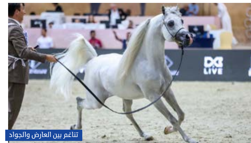
تناغم بين العارض والجواد