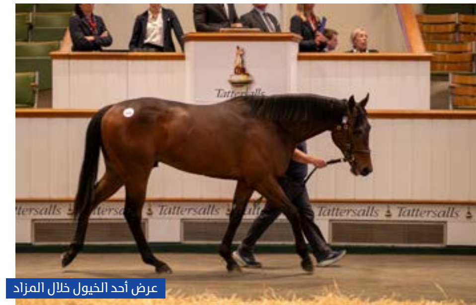
عرض أحد الخيول خلال المزاد