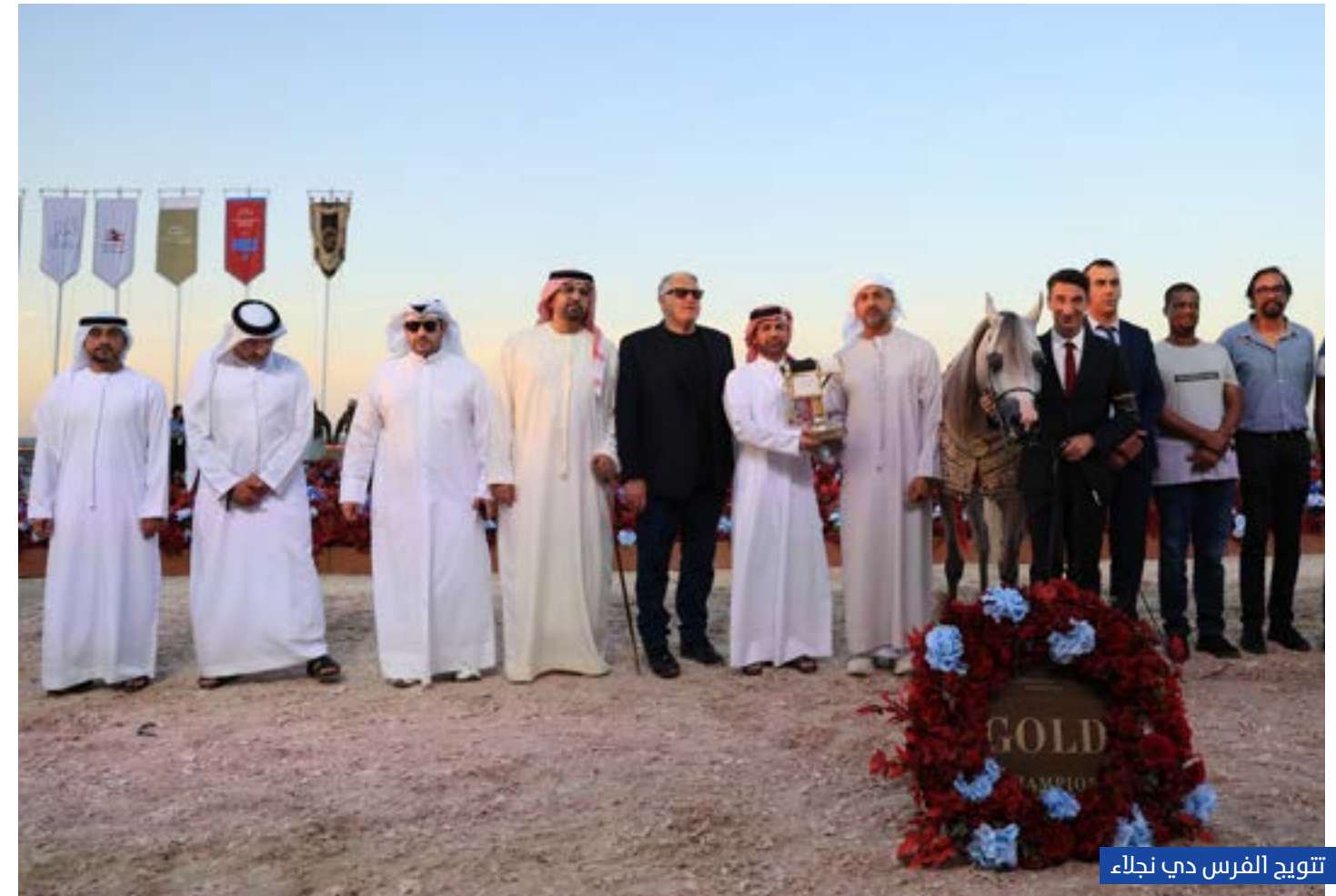
تتويج الفرس دي نجلاء

سجّلت المرباط الإماراتية حضوراً لافتاً في ختام المحطة الثالثة من جولة الجياد العربية العالمية 2026، التي أقيمت في الفترة من 31 مارس - 2 أبريل 2026 في العاصمة العمانية مسقط وسط مشاركة نخبة من الخيول العربية من مختلف دول العالم، مؤكدة مكانة دولة الإمارات كإحدى أبرز القوى في صناعة الخيل العربية.