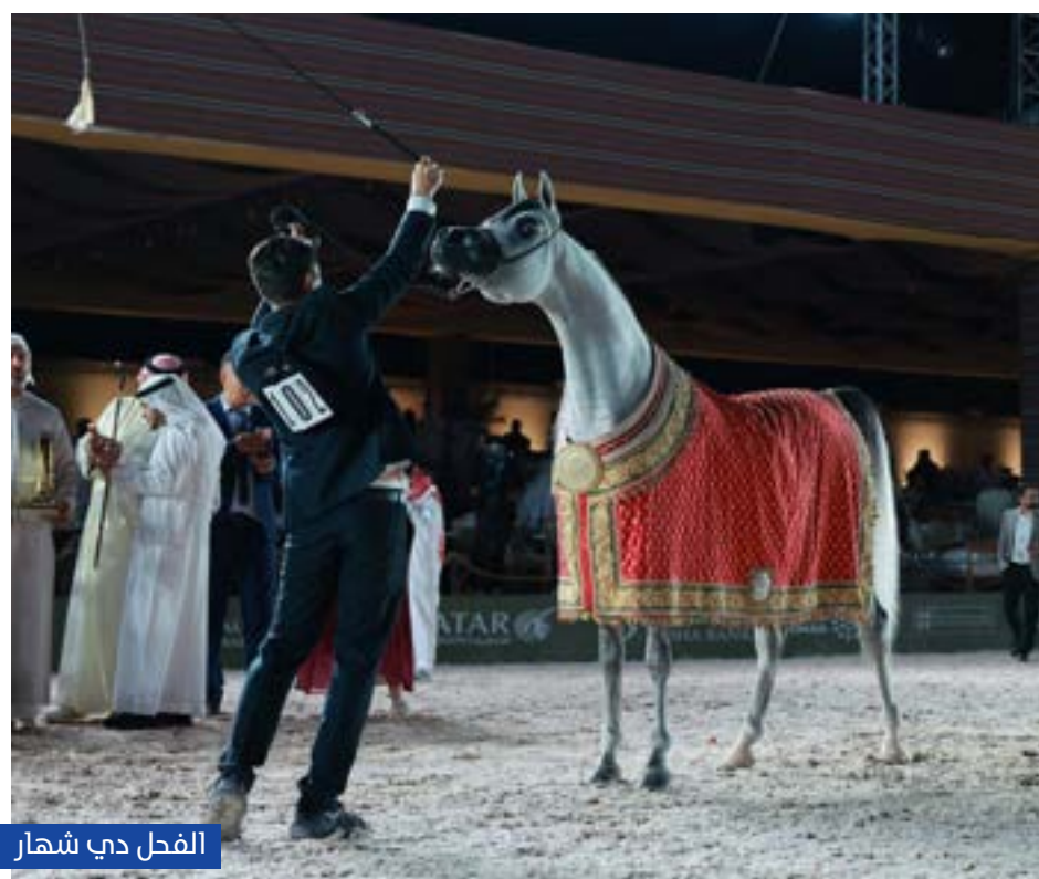
الفحل دي شهار

بين الثقافات من خلال الشغف المشترك، كما تشكل «جولة الجياد العربية» النظام الإيكولوجي المثالي للجياد