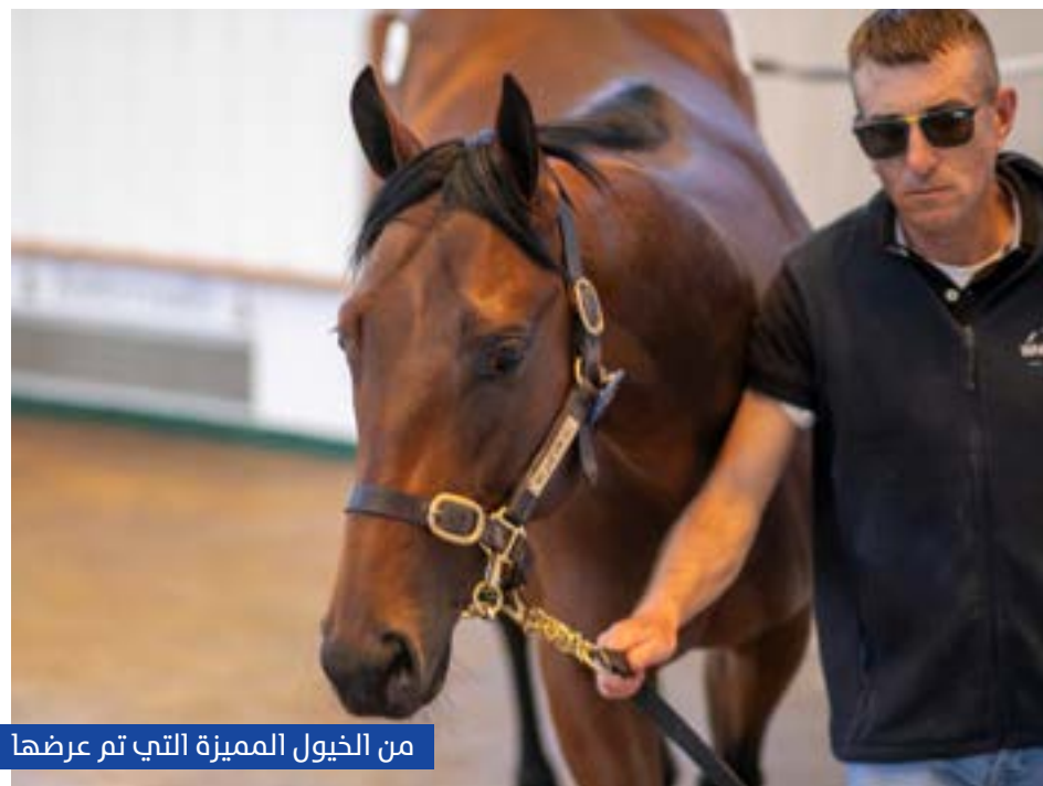
من الخيول المميزة التي تم عرضها