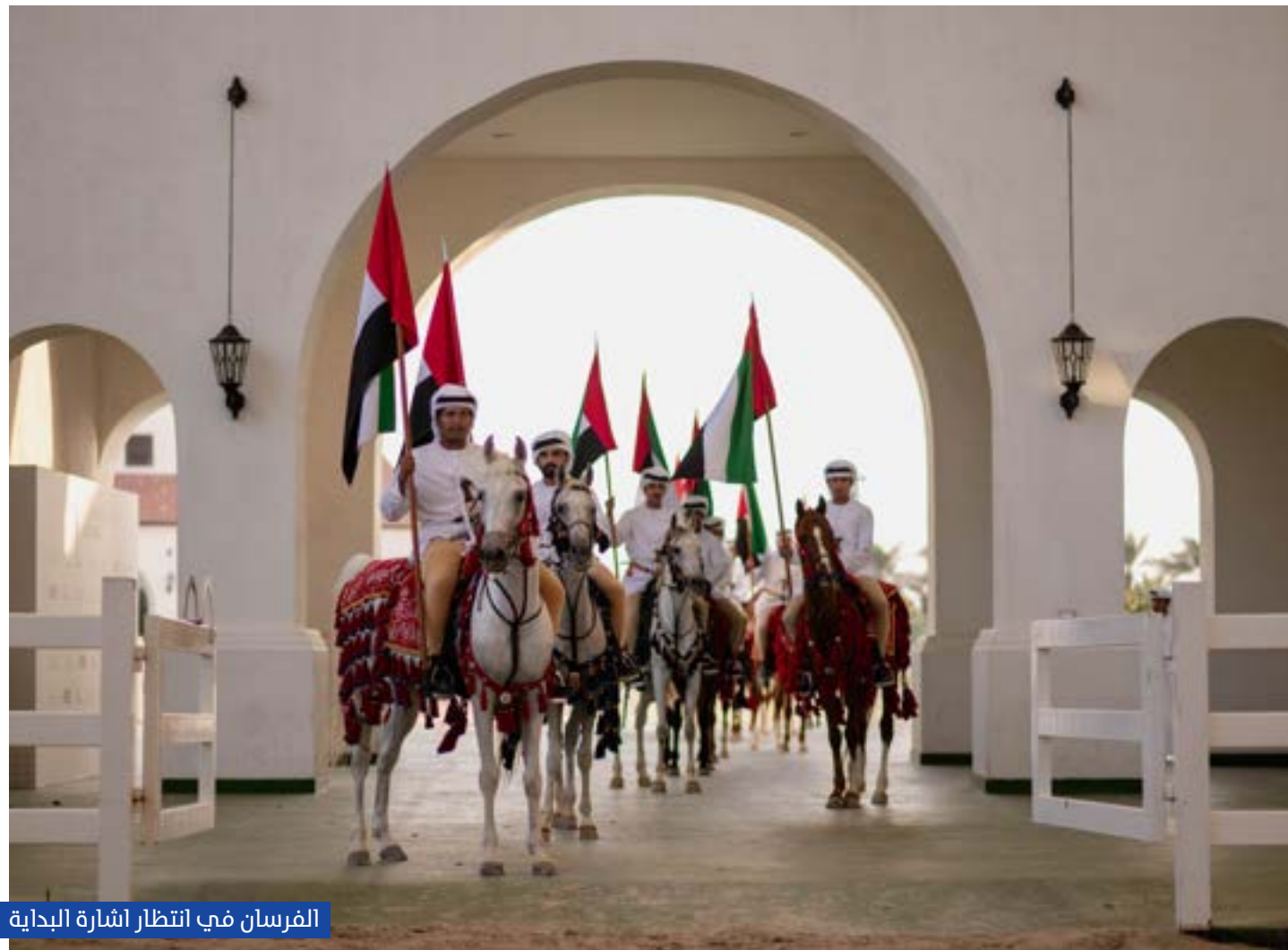
الفرسان في انتظار إشارة البداية

فدان، ويضم مضمار سباق بمواصفات عالمية، ومرافق ضيافة، ومسارات تدريب احترافية، وتجارب نمط حياة تتمحور حول ساحة الأركيدز كواجهة متكاملة للمطاعم والعافية والتجزئة الراقية والبرامج الثقافية.