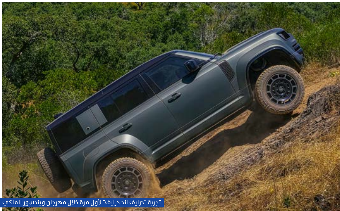
تجربة "درايف أند درايف" لأول مرة خلال مهرجان وندسور الملكي