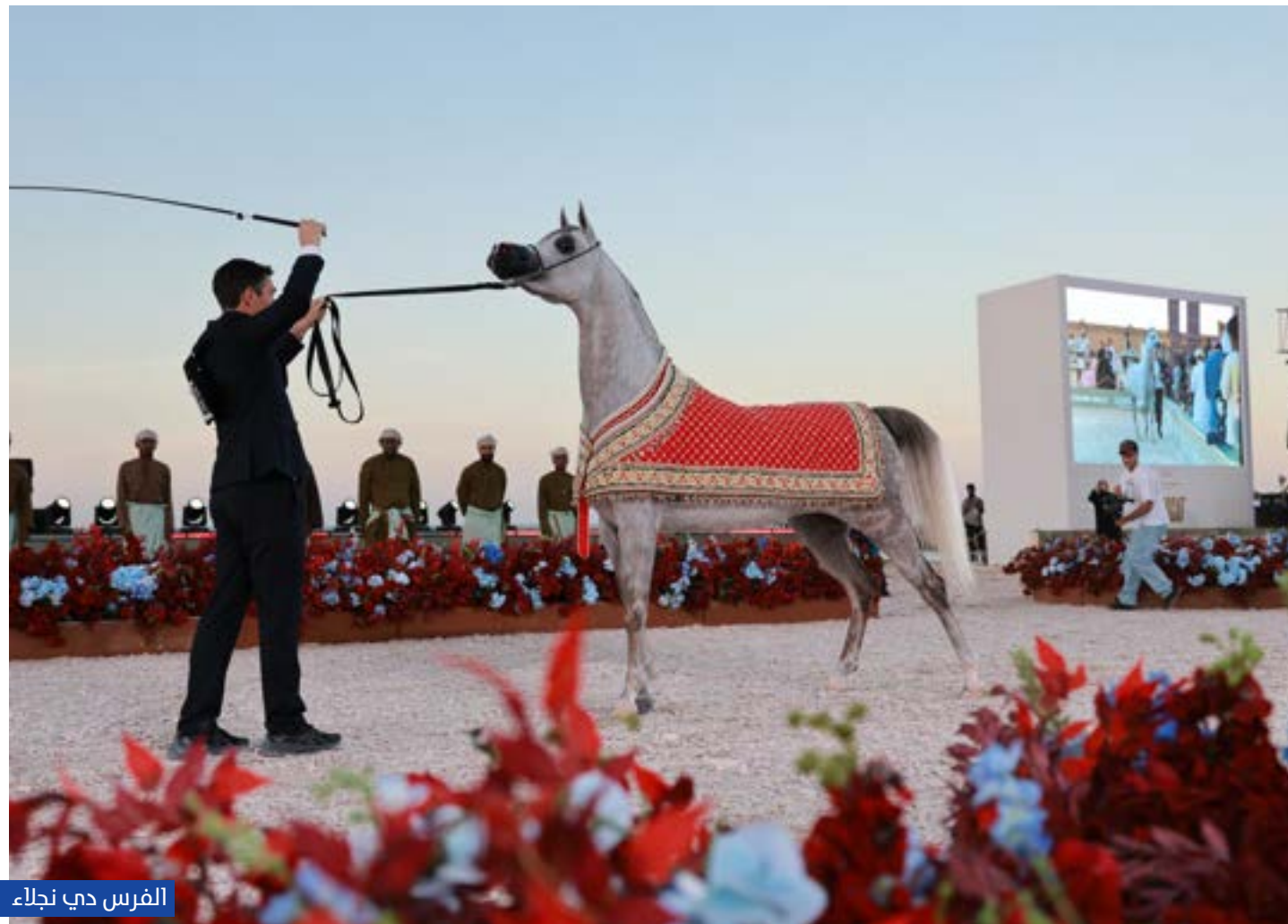
الفرس دي نجلاء

كما برزت البصمة الإنتاجية الإماراتية من خلال فوز الفحل «دي صامد» (من إنتاج مربط دبي والملوك لمربط