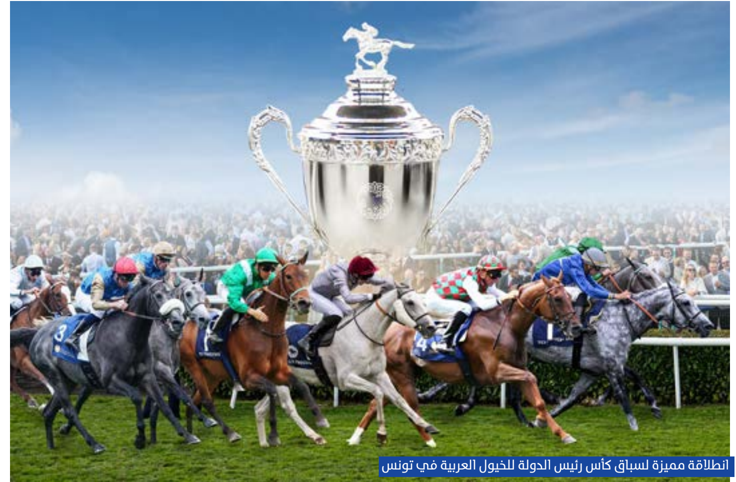
انطلاق مميزة لسباق كأس رئيس الدولة للخيول العربية في تونس

شهد مضمرا قصر السعيد الرملي في الجمهورية التونسية، انطلاقاً استثنائية لأولى محطات سلسلة سباقات كأس صاحب السمو رئيس الدولة للخيول العربية الأصيلة في نسختها الثالثة والثلاثين، وسط حضور جماهيري غفير تجاوز 15 ألف متفرج، في مشهد احتفالي عكس المكانة المرموقة للكأس العالمية على مستوى السباقات العالمية.