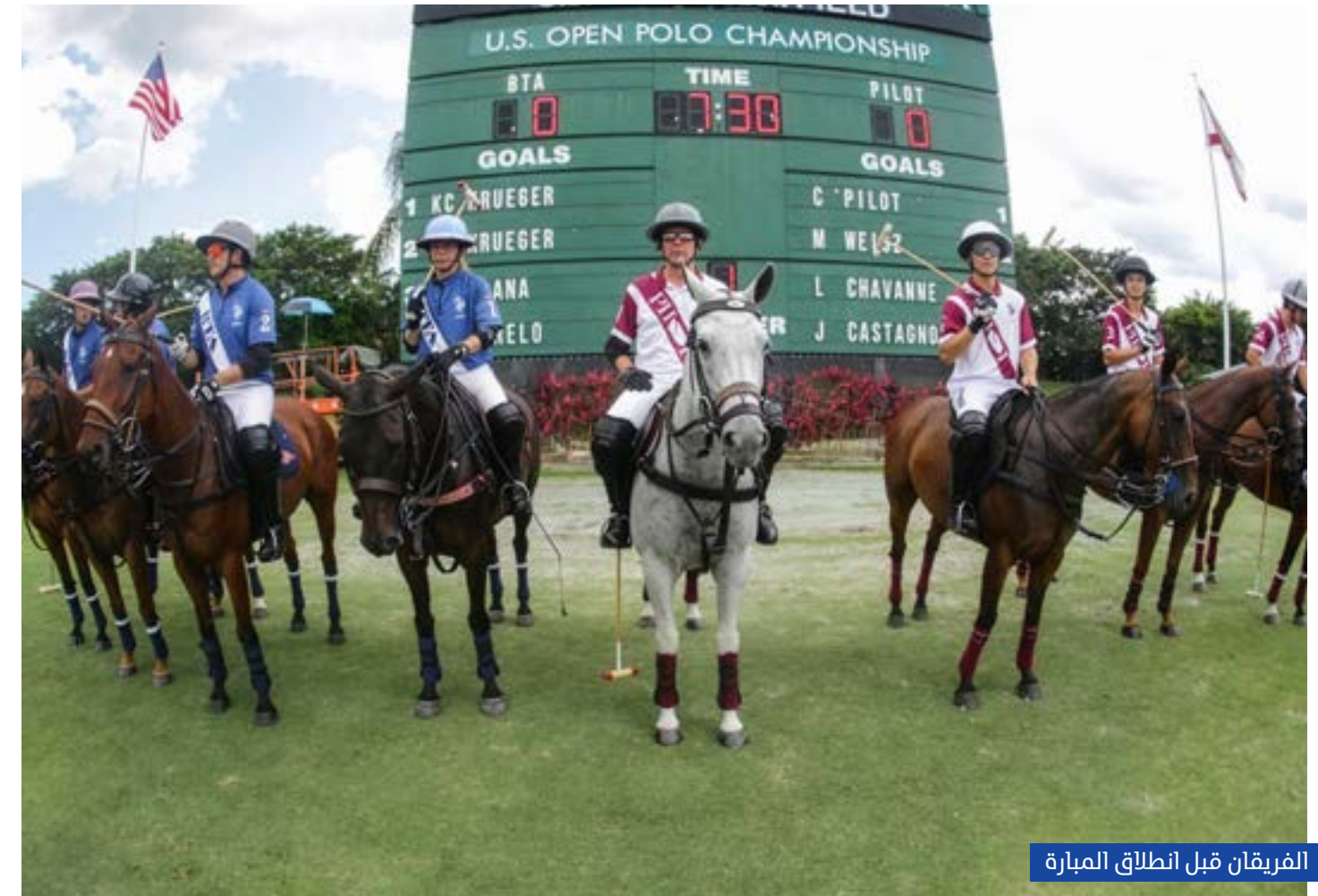
الفريقان قبل انطلاق المباراة

في مباراة نهائية تميزت بالسرعة والثقة والسيطرة الكاملة، عاد بايلوت إلى قمة لعبة البولو الأمريكية بأداء مهيب ضمن للفريق لقب بطولة الولايات المتحدة المفتوحة للبولو للمرة الثالثة.