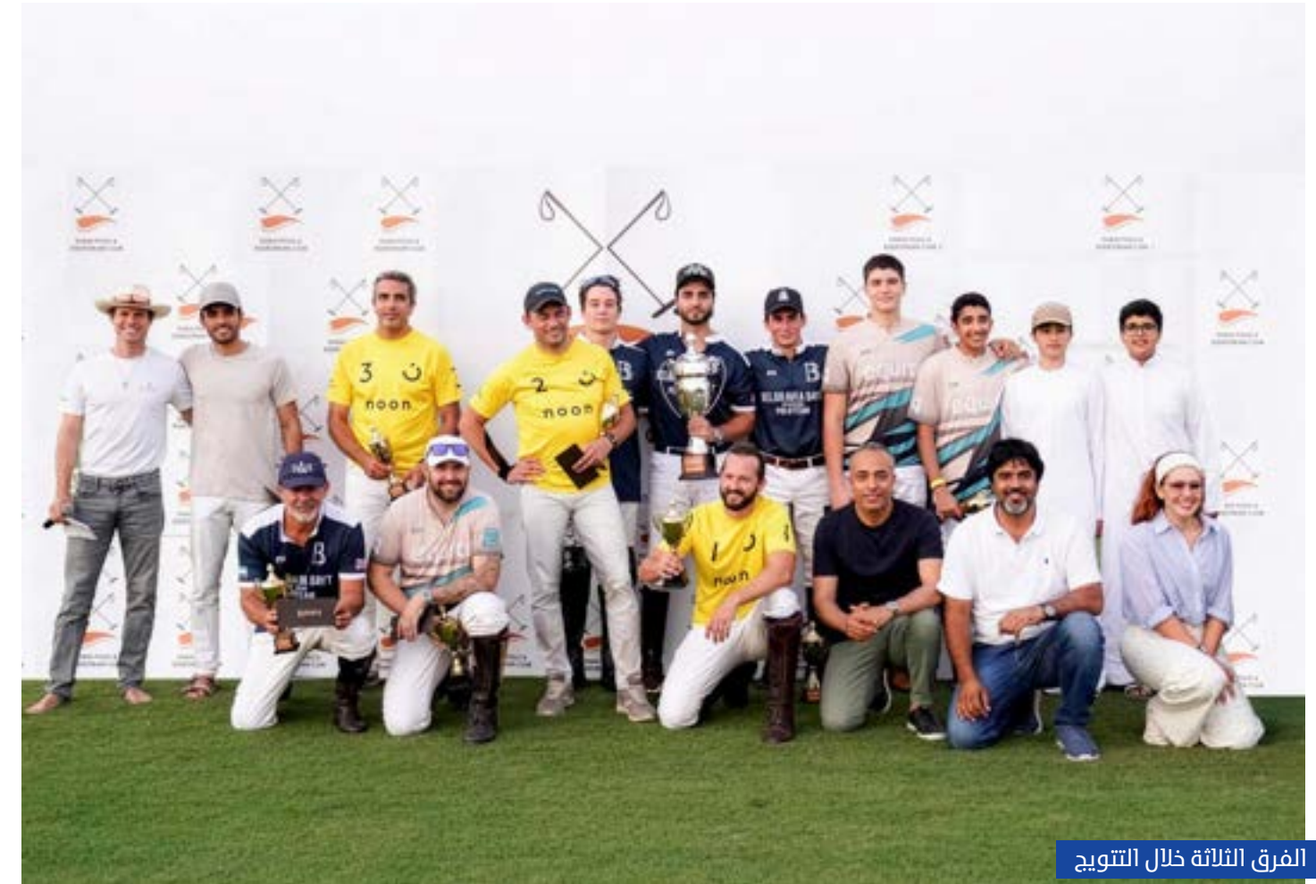
الفرق الثلاثة خلال التتويج

جمعت نخبة اللاعبين والفرق، مستفيداً من بنيته كواحد من أقوى وأثرى مواسم البولو في المنطقة، بفضل تنوع البطولات، وقوة المنافسة، والحضور الدولي المتزايد، إلى جانب الدعم الكبير الذي تحظى به الرياضة من الأندية والمؤسسات الرياضية في الدولة، ما جعل الإمارات محطة رئيسية على خريطة البولو العالمية. كما يؤكد موسم البولو الإماراتي عاماً بعد آخر مكانته