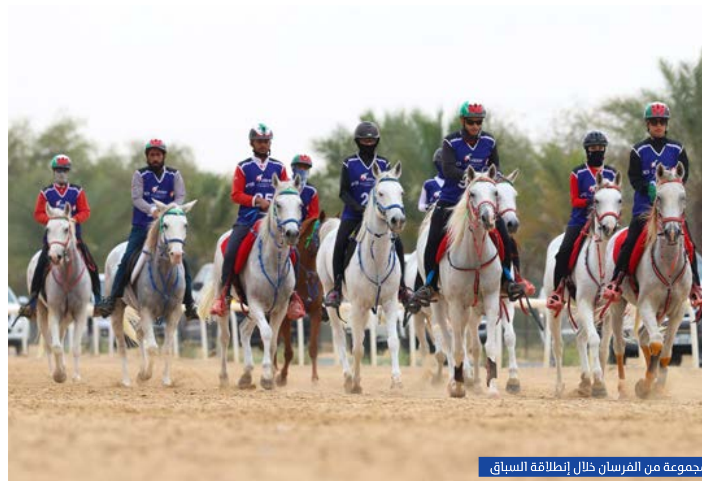
مجموعة من الفرسان خلال إنطلاقة السباق

اللياقة والتحصير، خصوصاً في السباقات الطويلة، حيث تشير معدلات الإكمال المرتفعة إلى تطور منظومة التدريب والاهتمام بالجاهزية البيطرية، إلى جانب تنامي الوعي بأساليب إدارة الجهد خلال مراحل السباق.