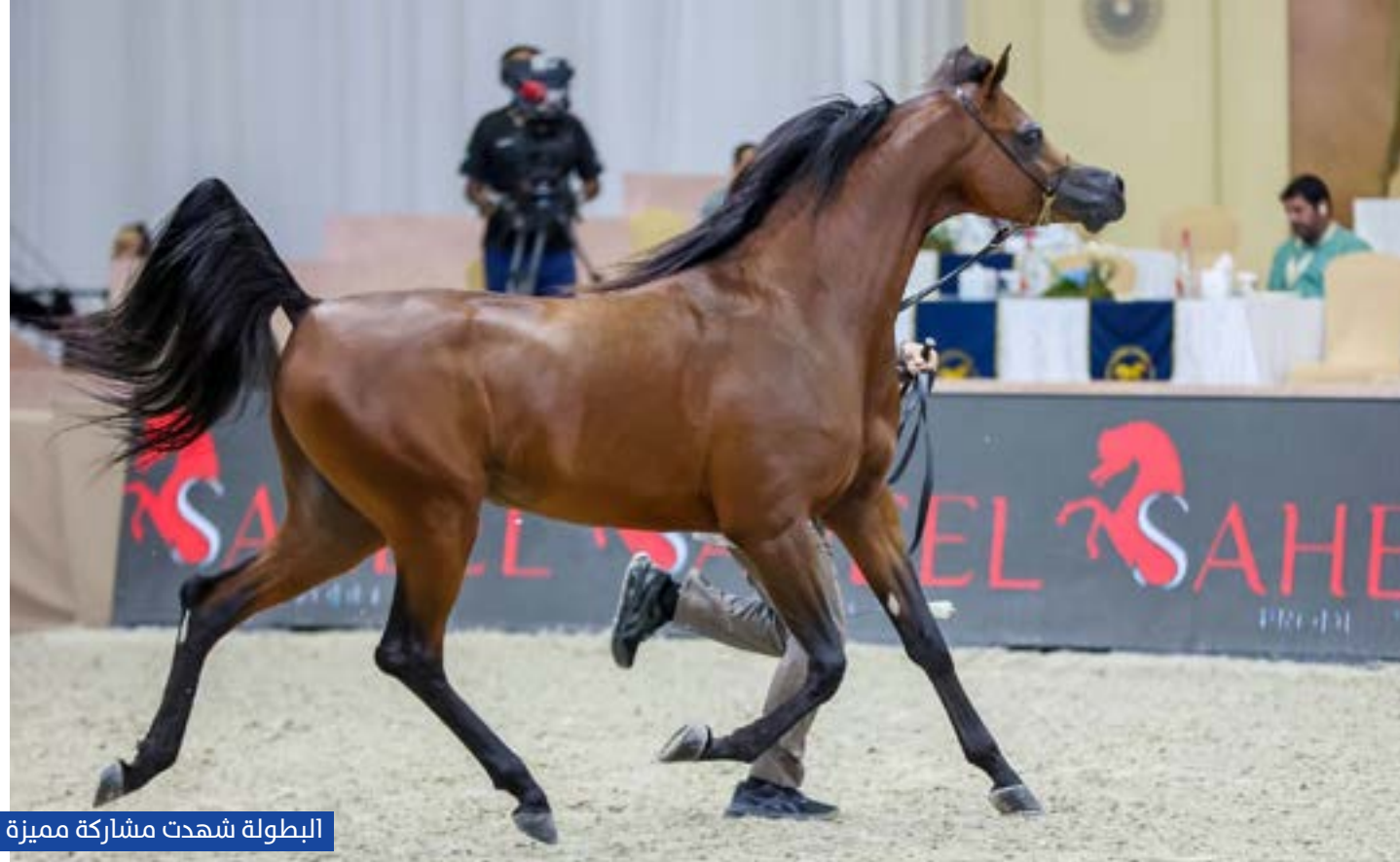
البطولة شهدت مشاركة مميزة

كما تالّق "دي بركان" لمربط دبي في بطولة المهور بعمر 2 و3 سنوات، محققاً المركز الأول والميدالية الذهبية، متقدماً على "عزام الأمل" للشيخ محمد بن سعود بن سلطان القاسمي، و"أشرف آر سي" للخيلة السلطانية العمانية الذي جاء ثالثاً.