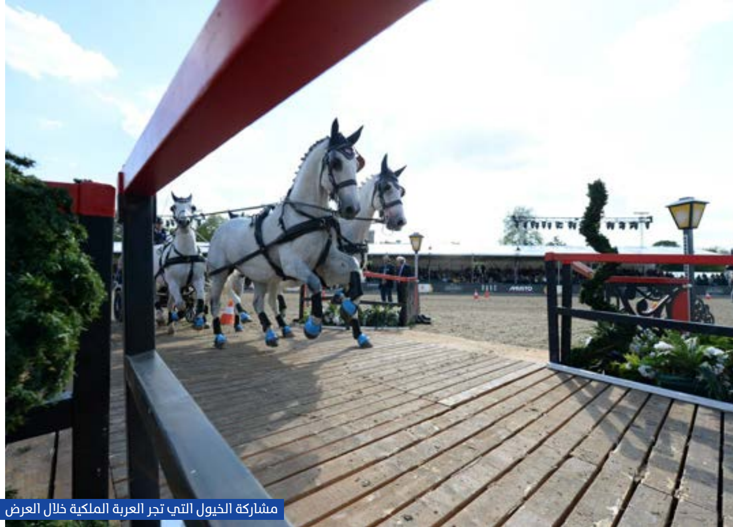
مشاركة الخيول التي تجر العربة الملكية خلال العرض

ويواصل المعرض احتفائه بتقاليد العريقة من خلال عودة العرض الموسيقي الشهير لفرقة مدفعية الخيالة الملكية،