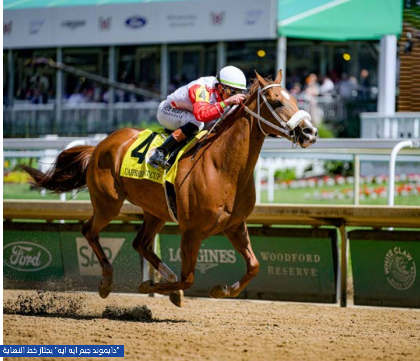
"دايموند جيم إيه" يجتاز خط النهاية