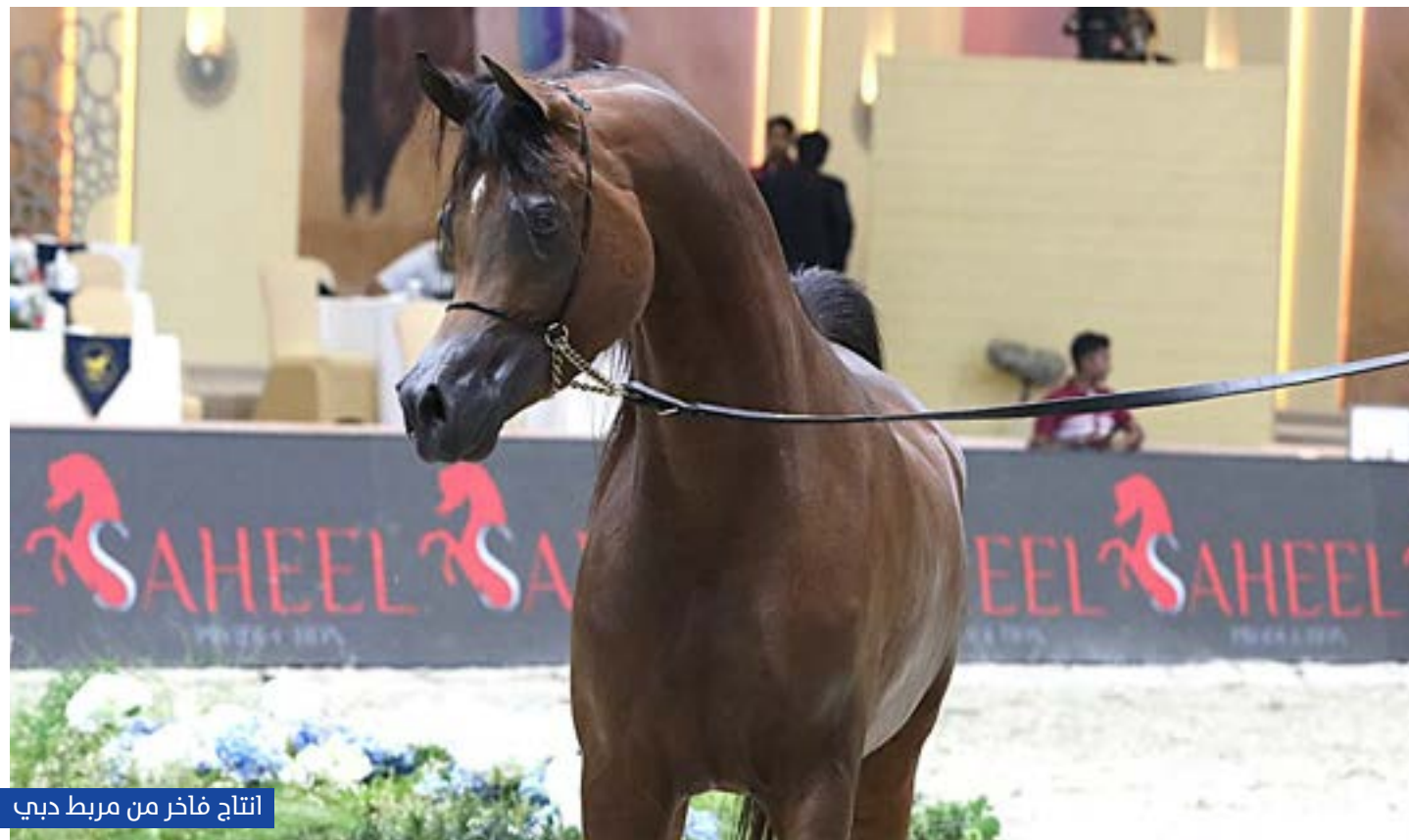
إنتاج فآخر من مربط دبي

وأضاف أن تجربة مربط دبي تجسد رؤية استراتيجية متكاملة، قامت على أسس علمية ومنهجية دقيقة، حتى غدت نموذجاً عالمياً في صناعة الخيل العربية، موضحاً