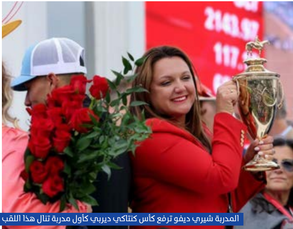
المدربة شيري ديفو ترفع كأس كنتاكي ديربي كأول مدربة تنال هذا اللقب

كما عزز الفارس جو أورتنز حضوره اللافت هذا الموسم، بعدما حقق قبل يوم واحد لقب «كنتاكي أوكس» على صهوة «أوليز آ رائن»، ليصبح تاسع فارس فقط ينجح في الفوز بالسباقين في العام ذاته.