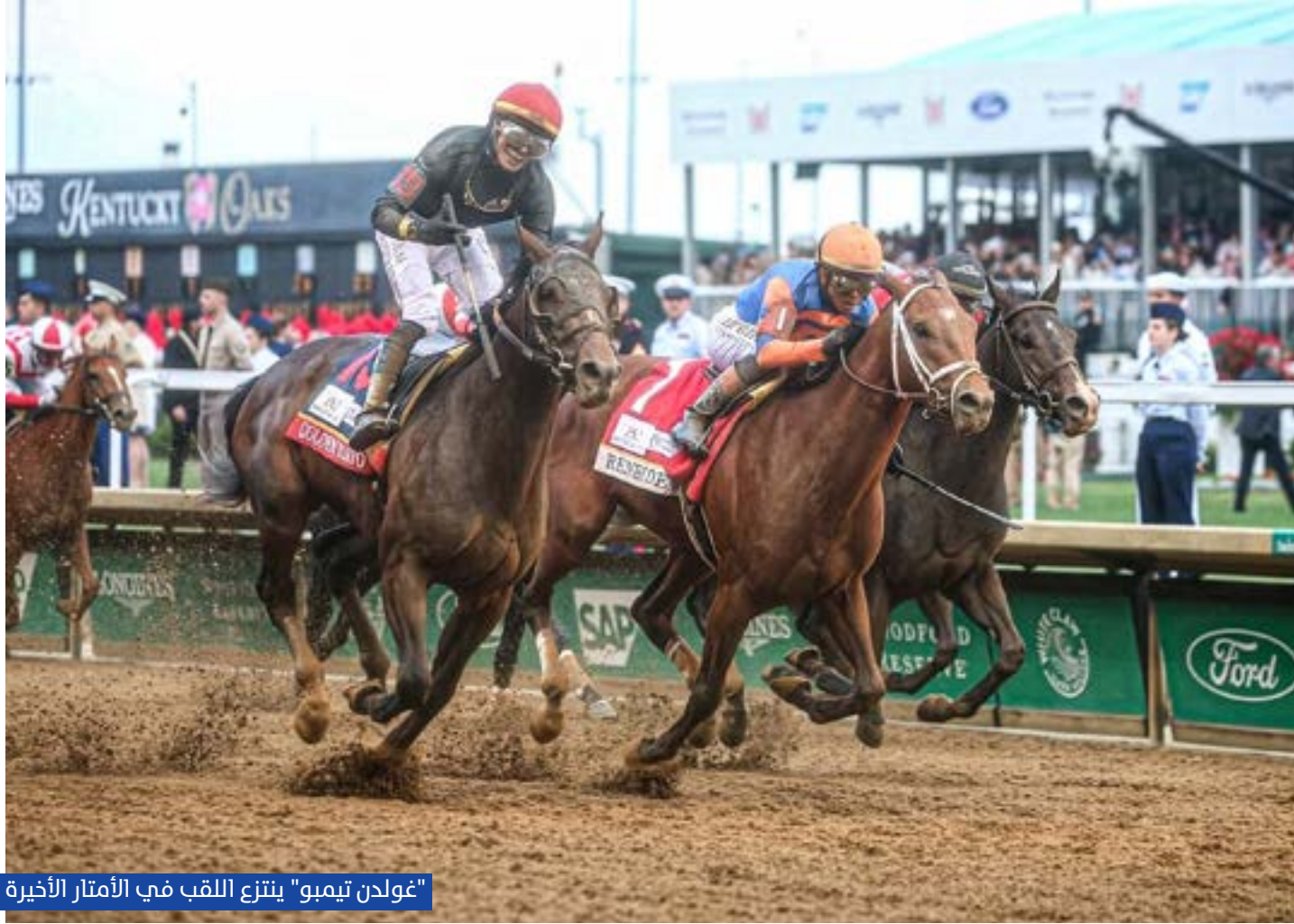
"غولدن تيمبو" ينتزع اللقب في الأمتار الأخيرة

فيه الكفاءة والخبرة قادرتين على كسر أقدام الحواجز في واحدة من أكثر الرياضات عراقة وتقاليده.