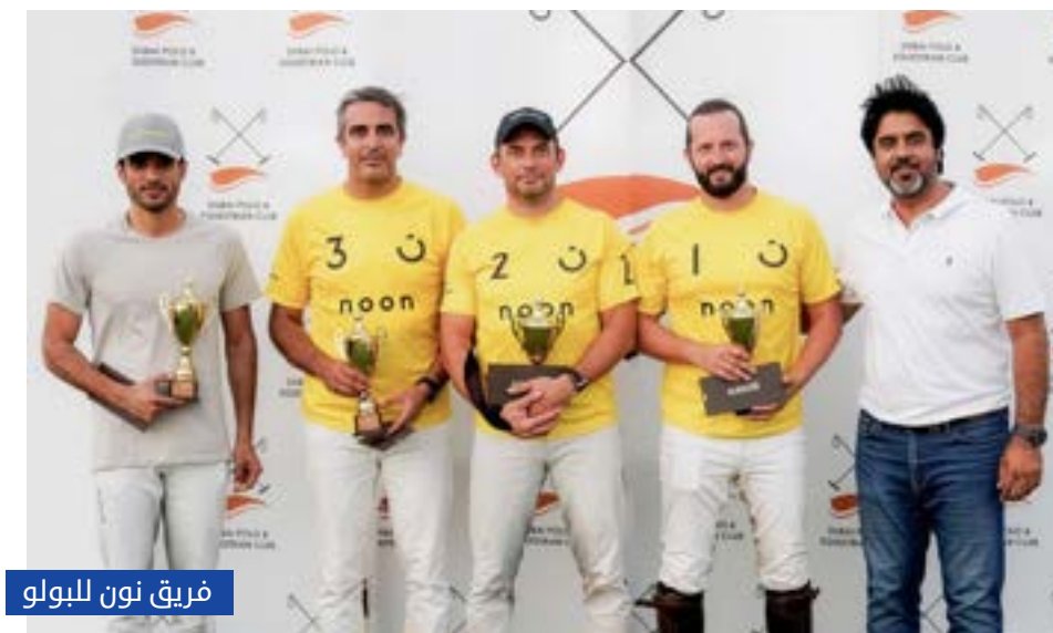
فريق نون للبولو

اختتم نادي دبي للبولو والفروسية موسمه الرياضي 2025-2026 ببطولة حافلة بالإثارة والتنافس، توج في ختامها فريق "بلغرافيا بيت" بطلاً لكأس ختام الموسم، بعد أداء مميز أكد حضوره القوي بين فرق البولو المشاركة في الموسم الإماراتي.